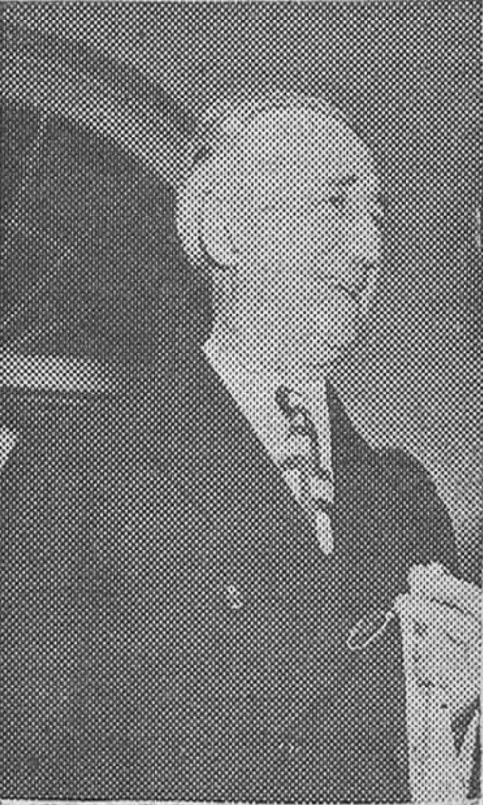
JAMES F. BYRNES

BYRNES PRONUNCIA UN DISCURSO EN EL CLUB DE PRENSA DE ULTRAMAR EN NUEVA YORK