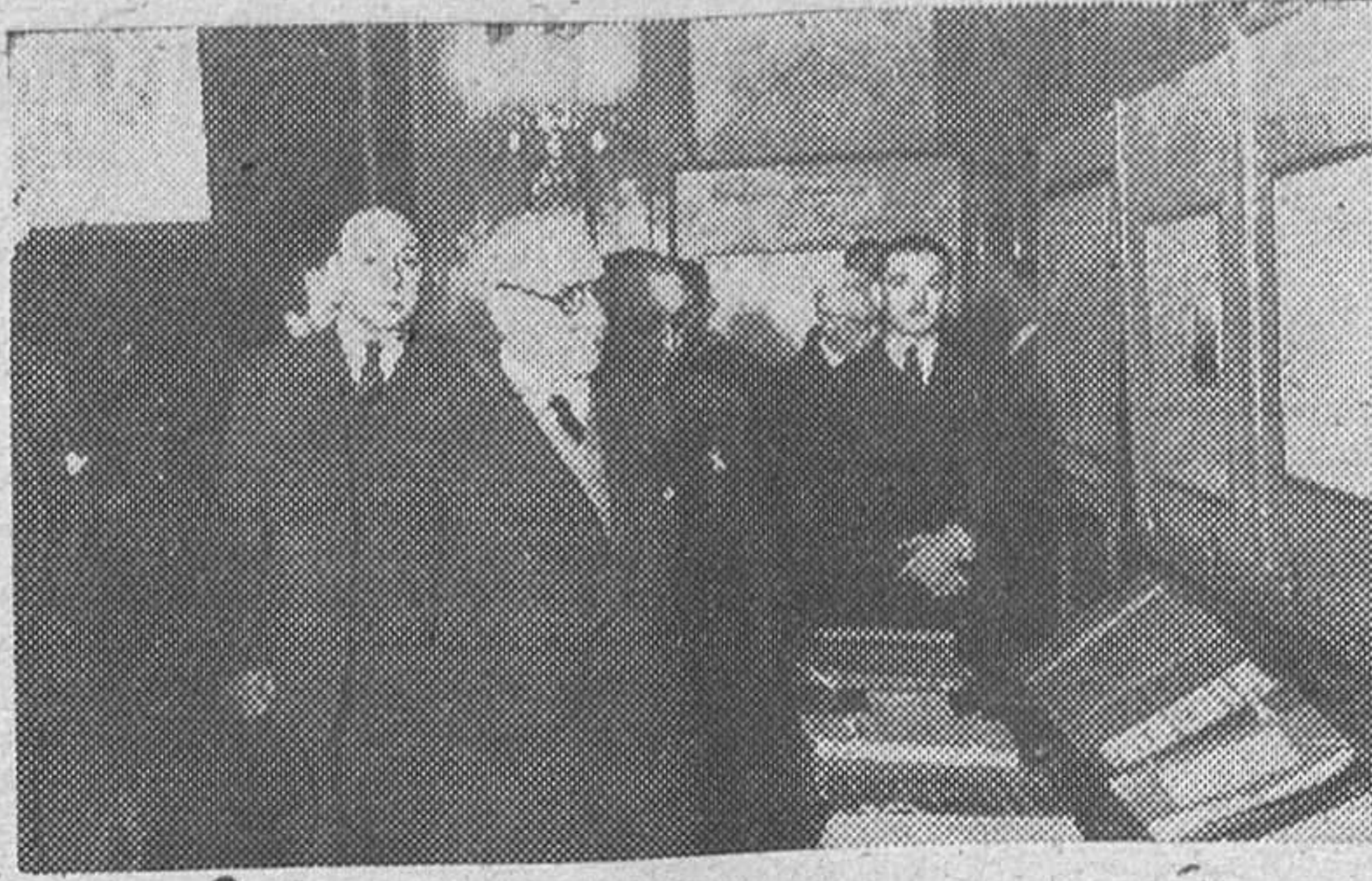
A su regreso a la península después de su recorrido triunfal por las siete islas del archipiélago canario, el señor ministro de Obras Públicas ha visitado en Sevilla los planos de las obras que se realizan en el valle inferior del Guadalquivir, de excepcional importancia para toda Andalucía