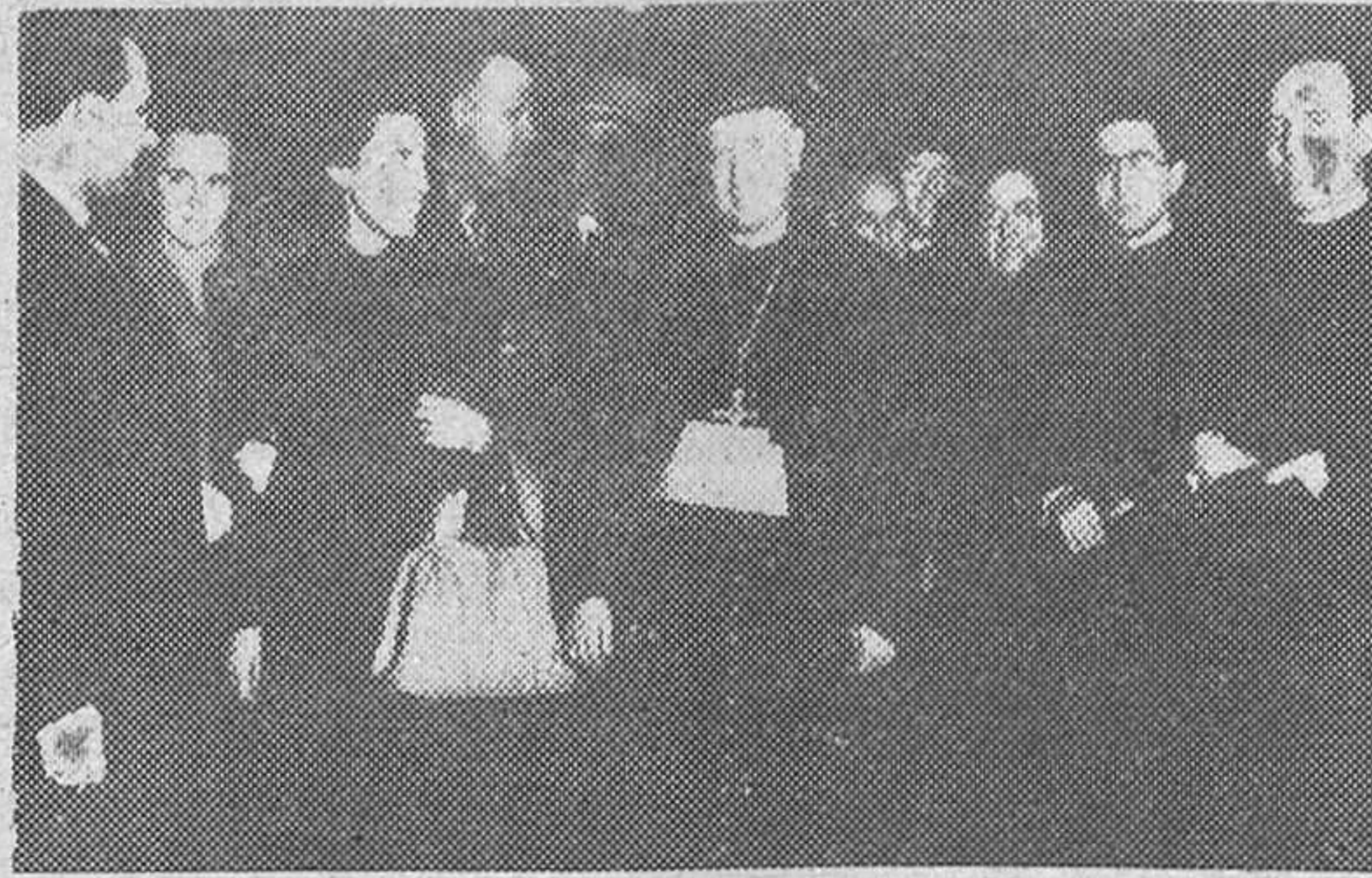
Ha llegado a Madrid la peregrinación española que ha asistido a todas las solemnes ceremonias del Consistorio celebrado en la Ciudad Vaticana y en el que Su Santidad Pío XII impuso el birrete cardenalicio a veintinueve mitrados. Todos los peregrinos han exteriorizado su emoción ante la magnificencia y ceremonial de aquel acto.