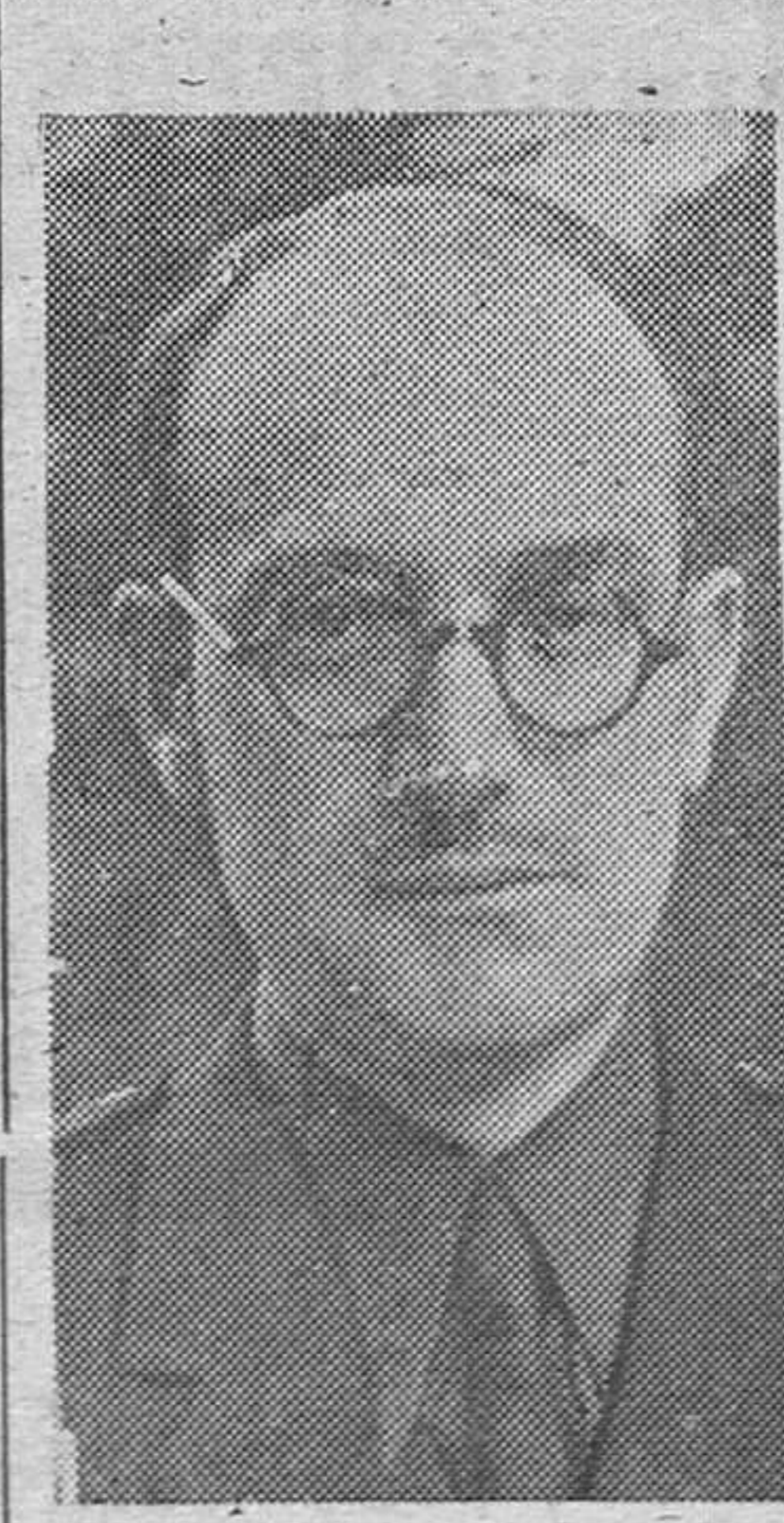
Don José Ibáñez Martín ministro de Educación Nacional

Como se indicaba en la nota oficial del último Consejo de Ministros, el Gobierno ha estudiado un plan general de ordenación económica-social que afecta a todas las provincias de España. Considerando el tema de excepcional importancia, «Arriba» ha conseguido del Ministro de Educación Nacional, como titular del Departamento a quien competen los servicios de información y de Prensa, unas importantísimas declaraciones, en las que se expone el desarrollo inmediato de esta empresa trascendental del Estado.