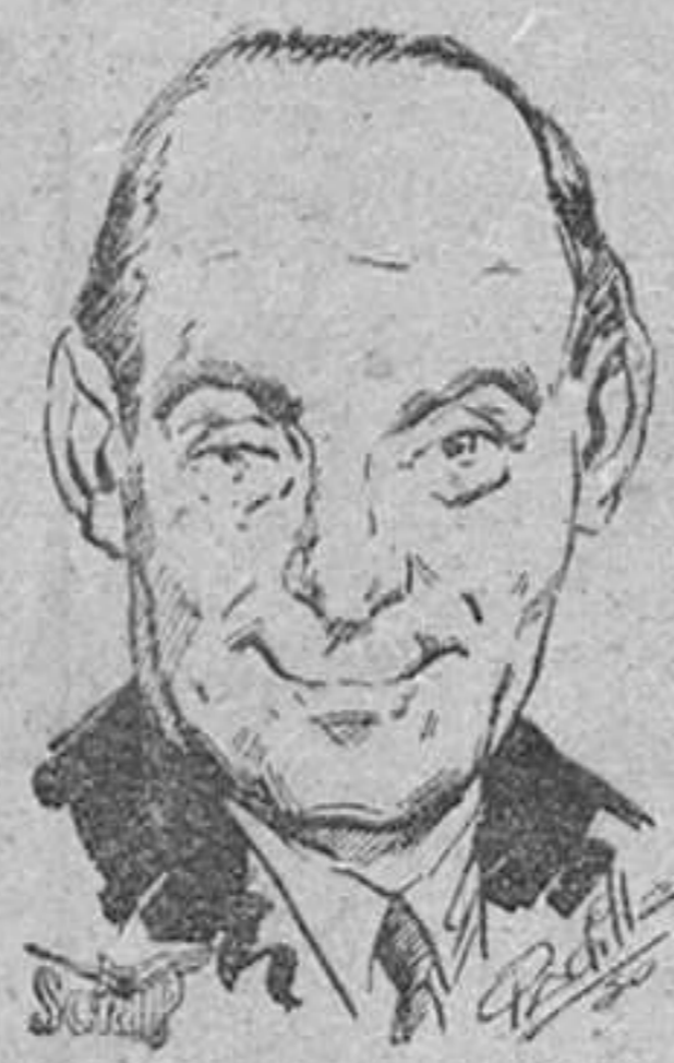
favorecido el doctor noruego Max Tau, eminente sociólogo de dicho país.

Increíble parece que un país sometido aún a las tremendas convulsiones de una paz inestable, con ejércitos de ocupación y la no muy problemática amenaza de otra guerra, pueda establecer seriamente un premio a la paz. La enorme vitalidad alemana, determinada por su actual íreces; en el trabajo pese a todas las penalidades, aparece en todos sus estratos sociales: lo mismo en los del trabajo manual que en las del intelectual. Ahora, sus hombres de letras reunidos, han entregado en Francfort del Main un premio de la paz instituido por ellos del que ha sido