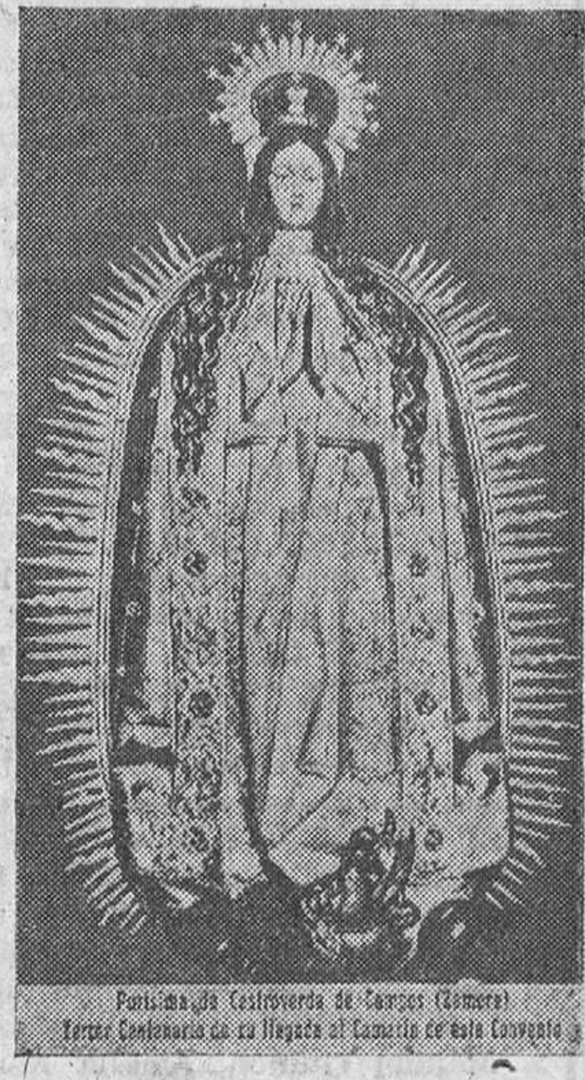
Purísima de Castroverde de Campos (Camara). Primer Centenario de su llegada al Convento de San Antonio.

Al salir la imagen del templo, una escuadrilla de la base de Villanubia evolucionó sobre el