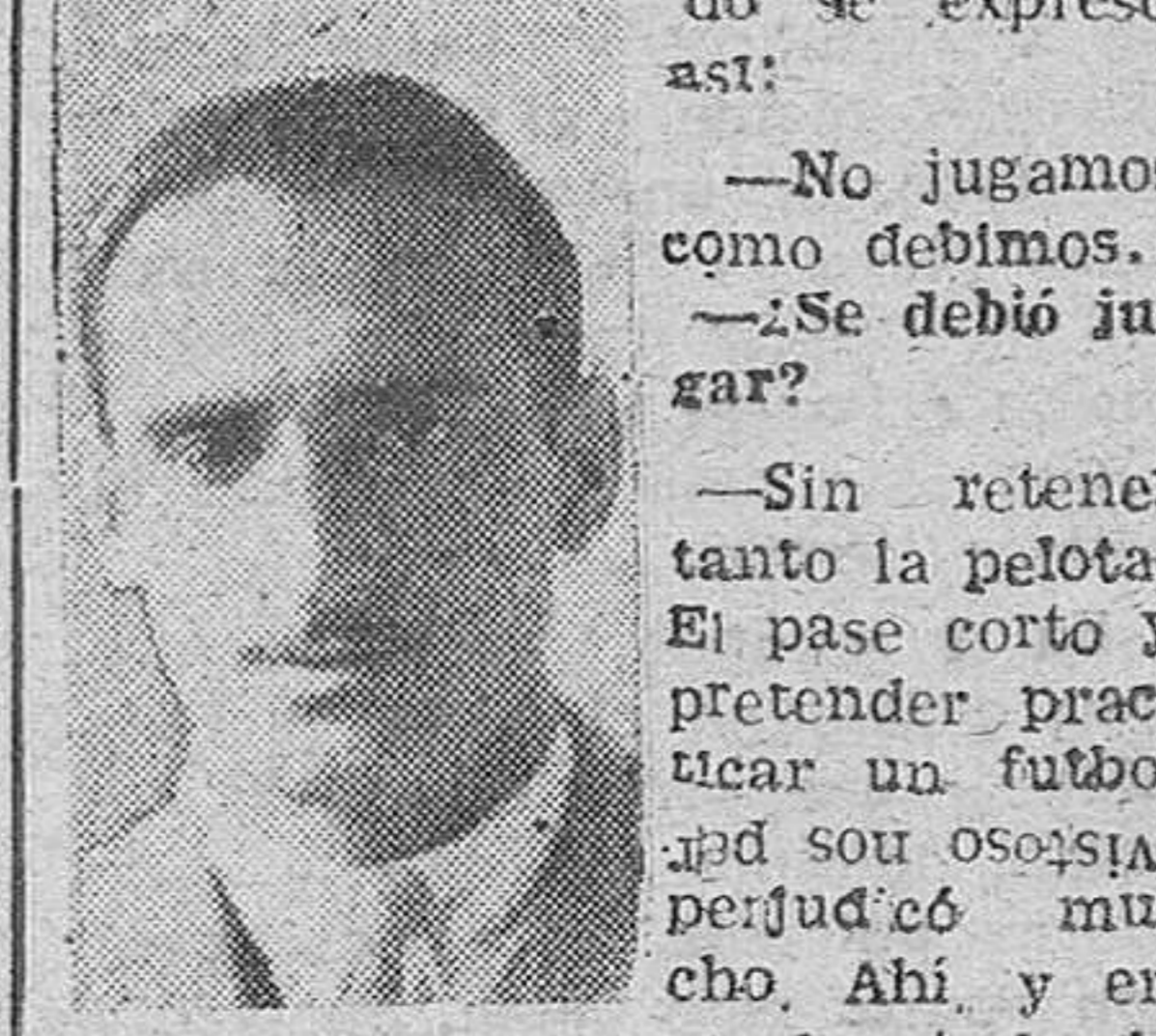
Las Moreras, estribó el triunfo del Caudal.