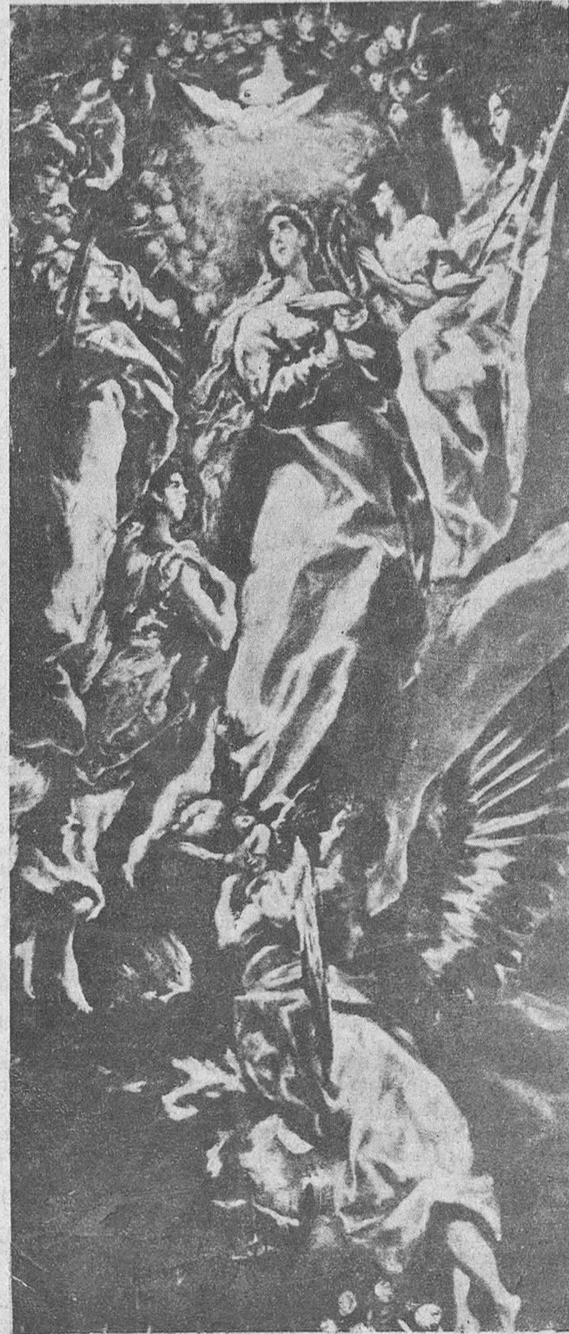
La Asunción de Nuestra Señora, por el GRECO

Contraportada: La Asunción, por el Greco.