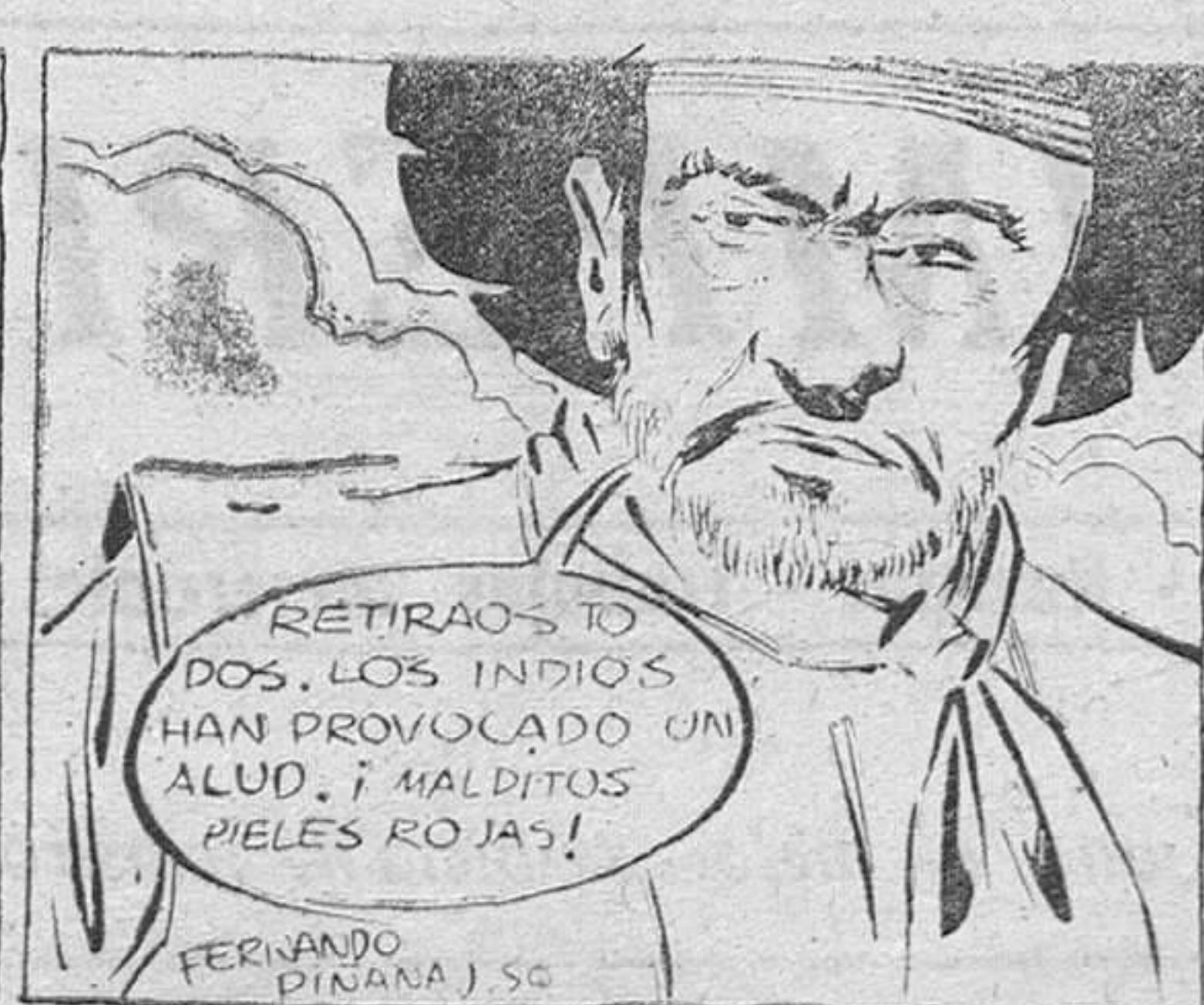
RETIRAO'S TO DOS. LOS INDIOS HAN PROVOCADO UN ALUD. ¡MALDITOS PIELS ROJAS!