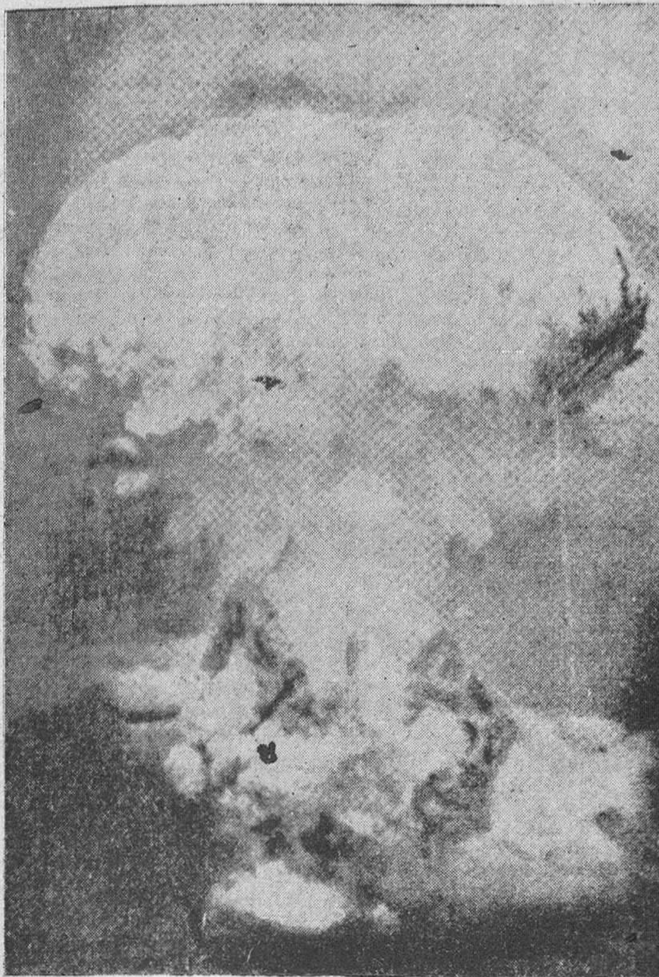
EFFECTOS DE LA EXPLOSION DE LA BOMBA ATOMICA EN BIKINI

¿Cómo defenderse contra estos efectos y particularmente contra los rayos? He aquí la receta más sencilla: cubrirse con un lienzo o un traje blanco (el negro es fatal y hay que evitar por lo tanto el uso común en la guerra pasada—de cortinas negras, colocadas en las ventanas para impedir la filtración de la luz hacia el exterior); no tratar de averiguar el lugar de la caída de la bomba mirando hacia la luz que de ella emana, tirarse inmediatamente al suelo y protegerse la cara y las manos—es decir, todas las partes expuestas del cuerpo—con los trajes que uno lleva puestos, o, de ser posible, con