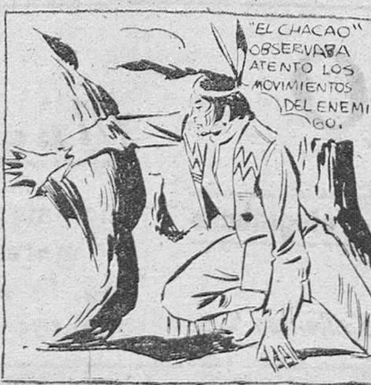
"EL CHACAO" OBSERVABA ATENTO LOS MOVIMIENTOS DEL ENEMIGO.