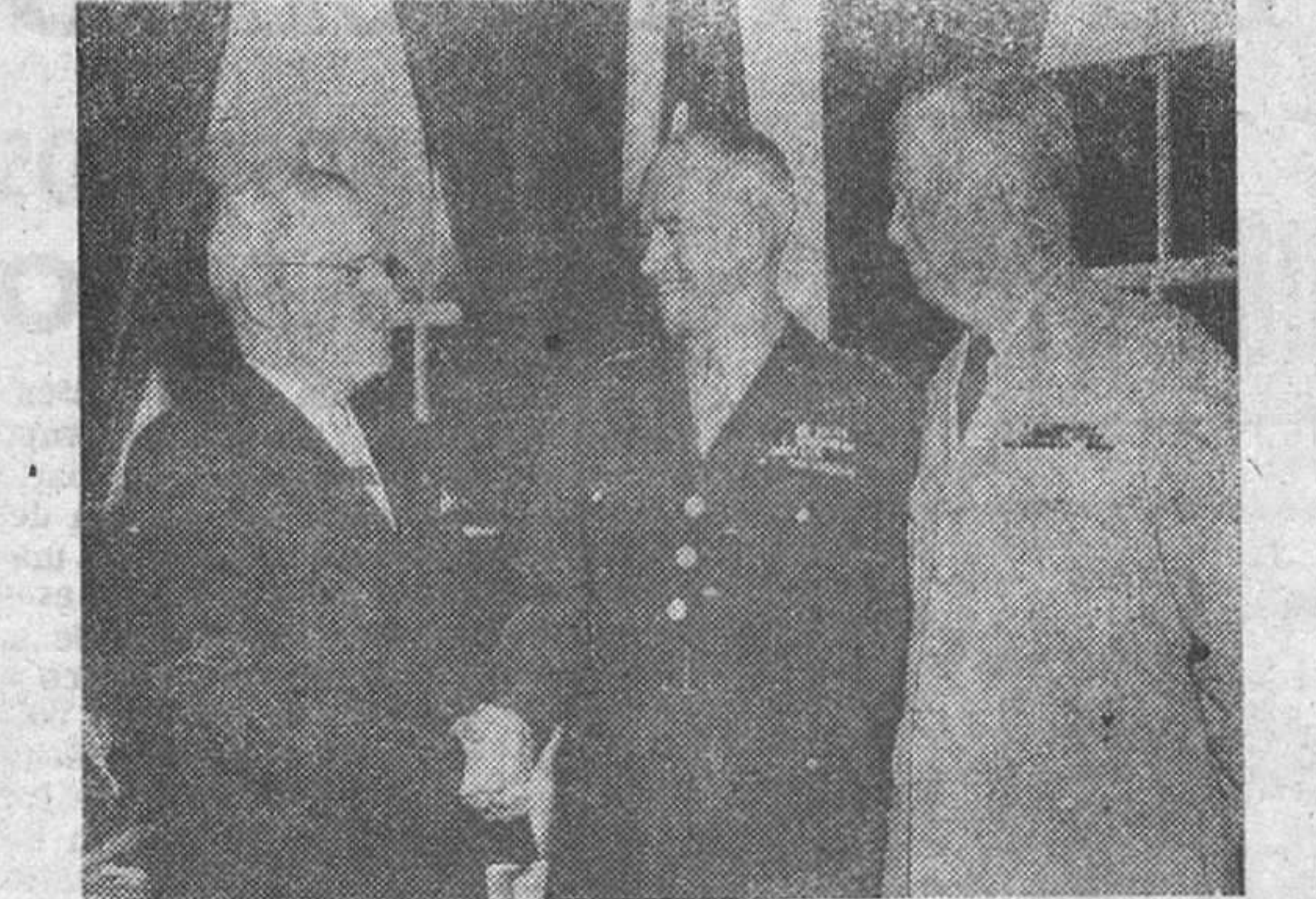
El Presidente Truman felicita al general Bradley, después de comunicarle su nombramiento como presidente de la Asociación de Ex-combatientes, a la derecha figura el general Marshall.

Lejos de ser un apaciguador, Byrnes fué el primer americano