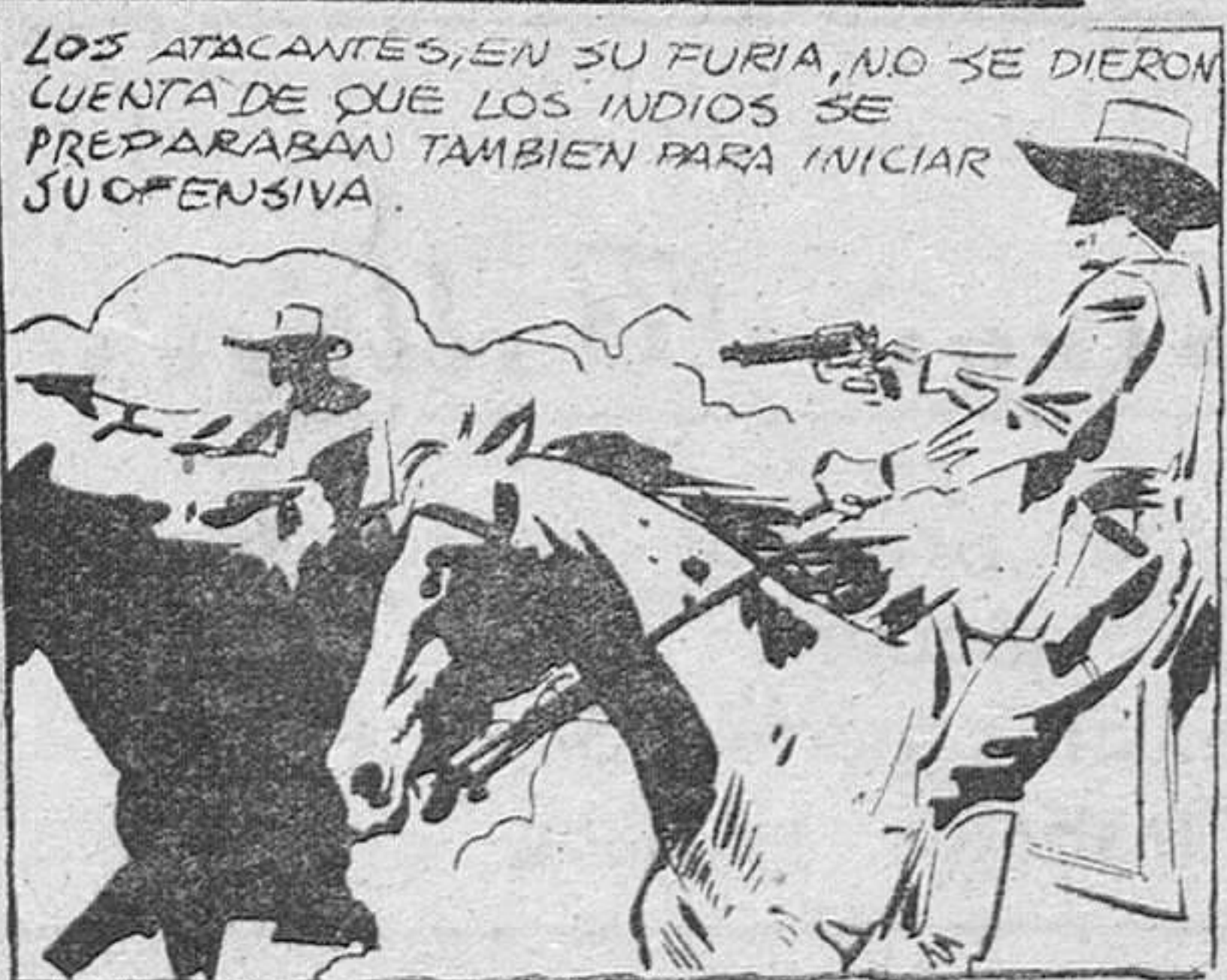
LOS ATACANTES, EN SU FURIA, NO SE DIERON CUENTA DE QUE LOS INDIOS SE PREPARABAN TAMBIEN PARA INICIAR SU OFENSIVA.