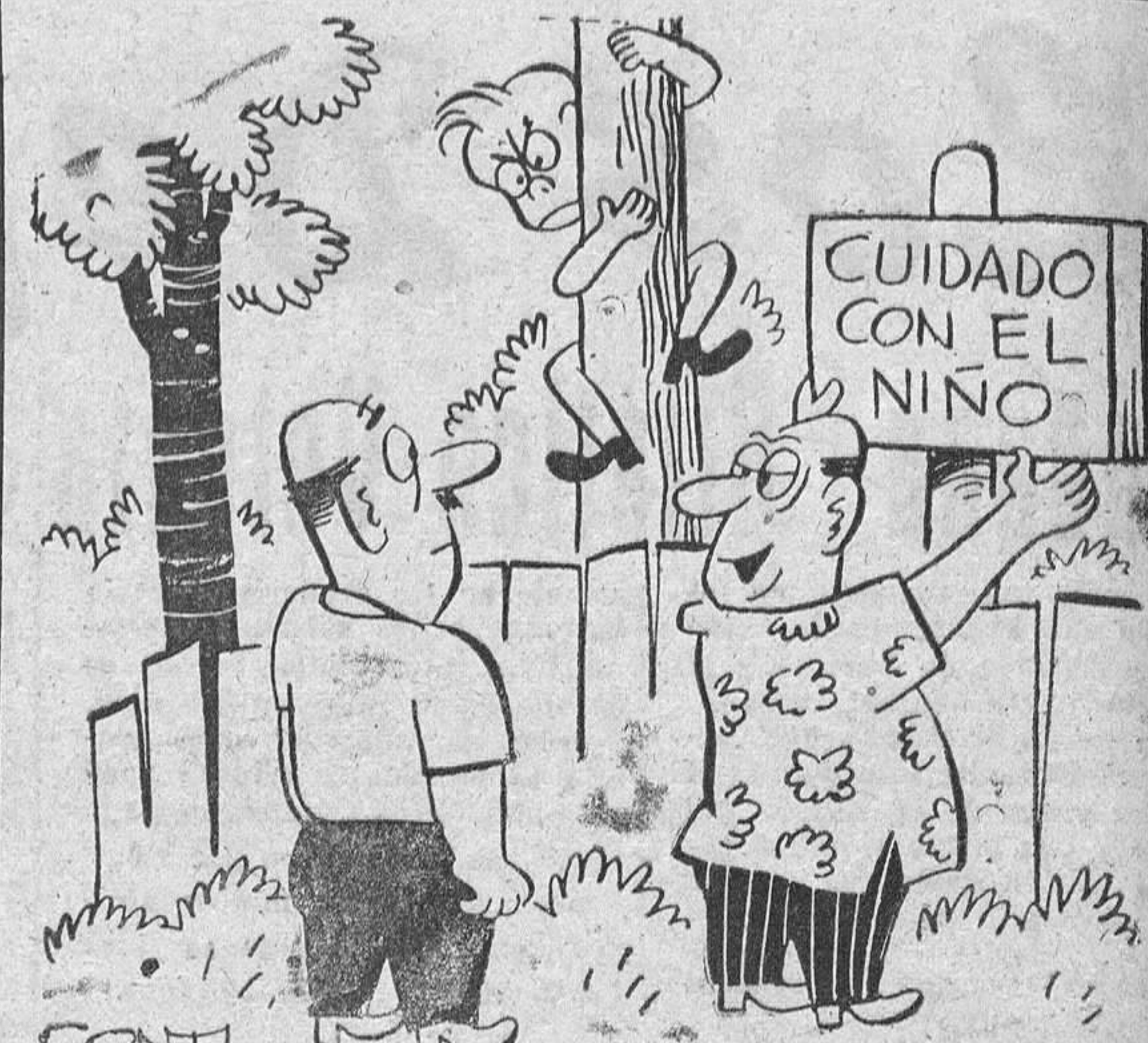
—Si en cuanto lleva dos meses de veraneo y haciendo vida salvaje, muere.