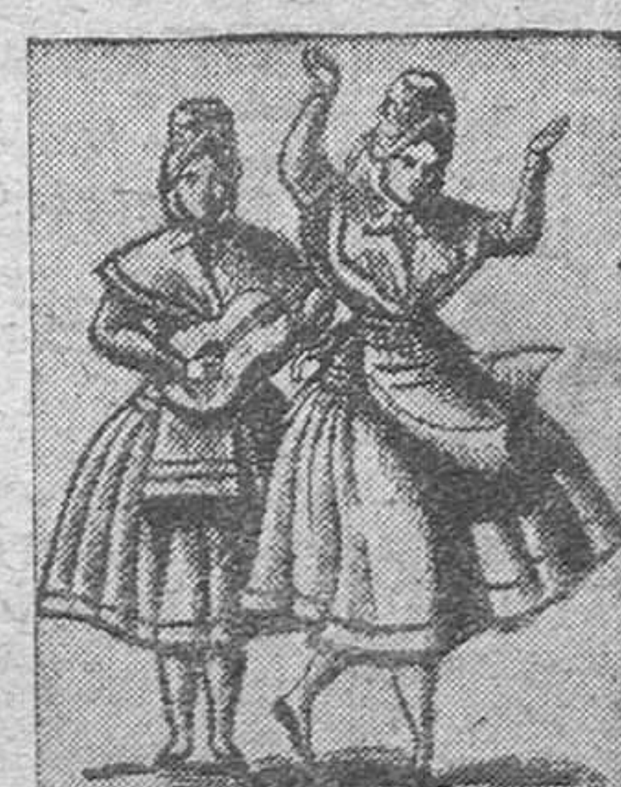
(LEIDO PARA USTED) en "Arriba"

le más que todo". "Es una comida excelente para la fotografía y los anuncios, pero a nuestro paladar no le va nada". Les encanta el paisaje de California. La gente de allí es simpática. Visitaron el Seminario/Dominguez, de los padres claretianos, y presidió la comida el obispo auxiliar de Los Angeles, que se extrañaba mucho de la genuflexión a la española. Los seminaristas cantaron el Himno Nacional, y luego, los padres, pusieron en la radiogramola unos discos en los que se narra la guerra española y el tiempo anterior a ella—a través de unos episodios claretianos. Los discos están grabados por estudiantes de nacionalidad americana. "Pero qué español, chico", comentan todas. "Era emocionante. De repente oías al Tercio y luego a los requetés, y cuando decía una voz "¡Ahí van los falangistas" y empezaban a escucharse cornetas y tambores y el "Cara al Sol".