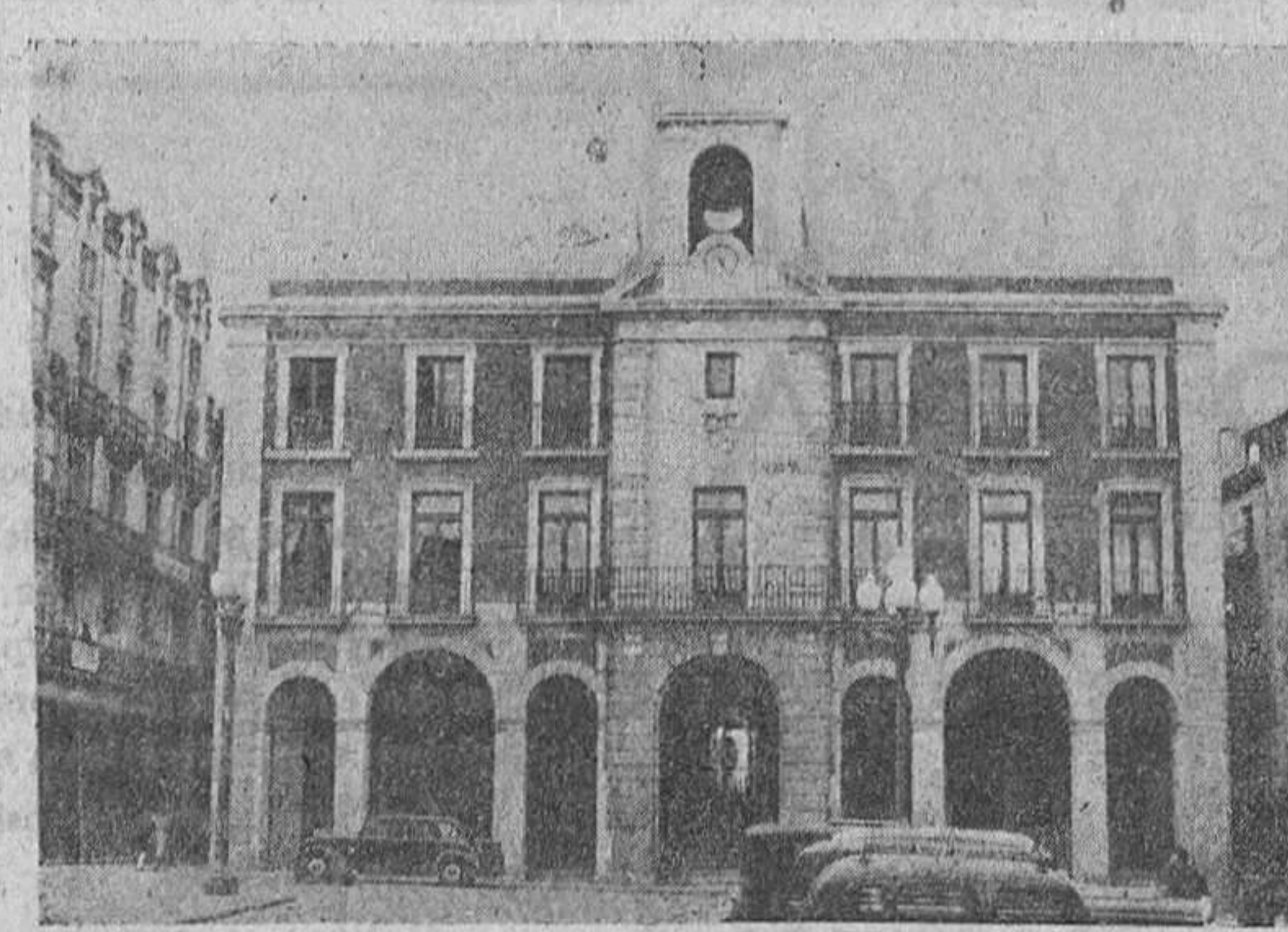
El nuevo Ayuntamiento de Zamora