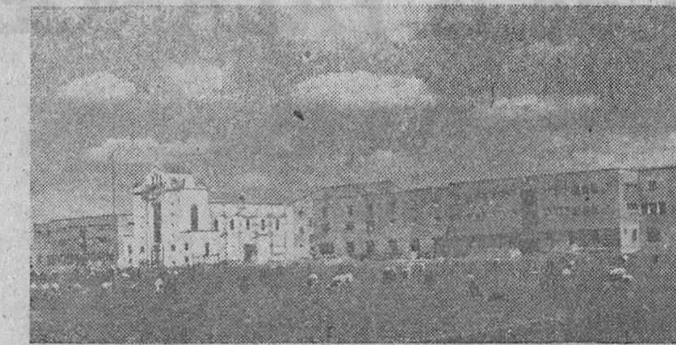
Vista de las obras del Hospital, en construcción