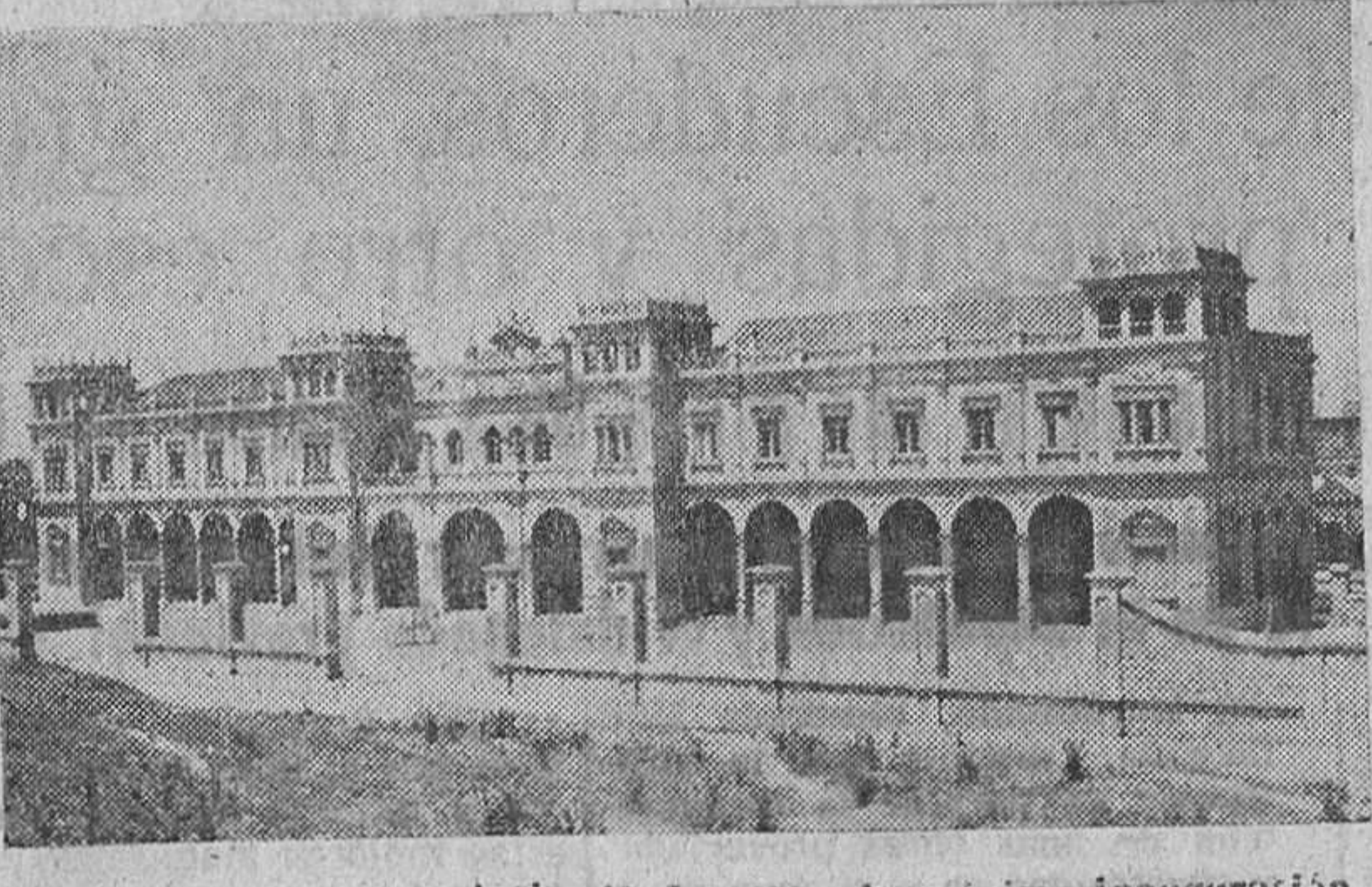
La nueva estación ferroviaria de Zamora, de próxima inauguración

Agua para los campos sedientos. El canal de San José, inaugurado en 1949