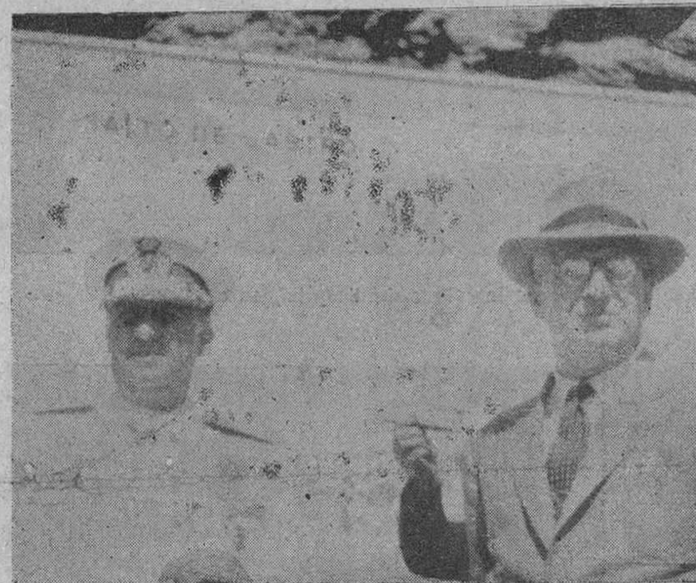
Cada viaje del Caudillo por tierras españolas marita nuevos jalones en el resurgir industrial de España. La foto recoge un momento de la inauguración del S. de Villacampo, durante su última visita a Zamora

dimensiones nacionales, se está destruyendo aquella triste realidad de que "España es una eterna media sofocada por la hiedra..." Ya está libre y limpio el tronco robusto y ha reanudado su crecimiento hacia el cielo, y otra vez dicta su lección al mundo.