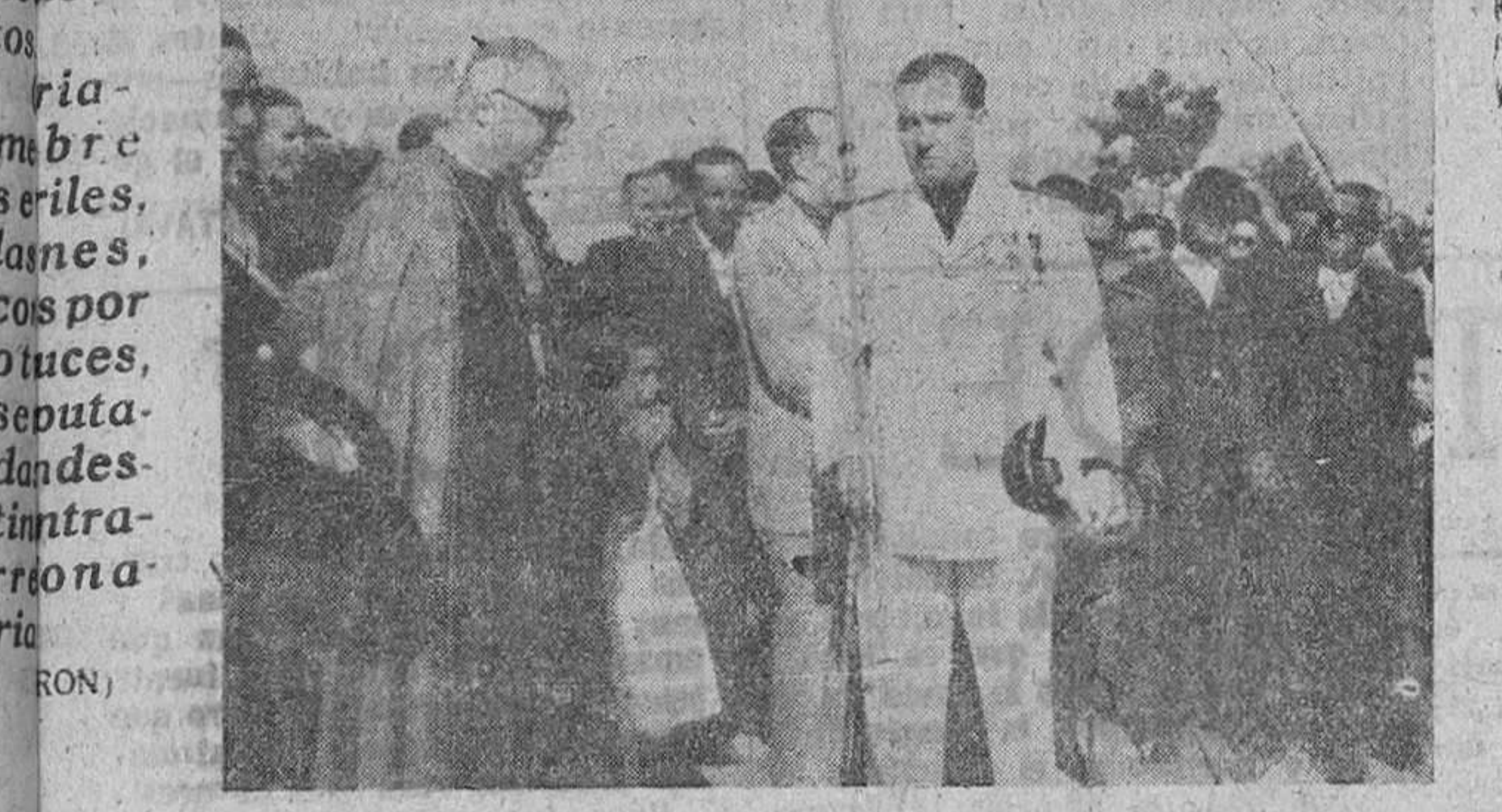
El obispo de la Diócesis y el jefe provincial y gobernador civil presidían la inauguración del Canal de San José, en Villarbarbo (julio 1949)