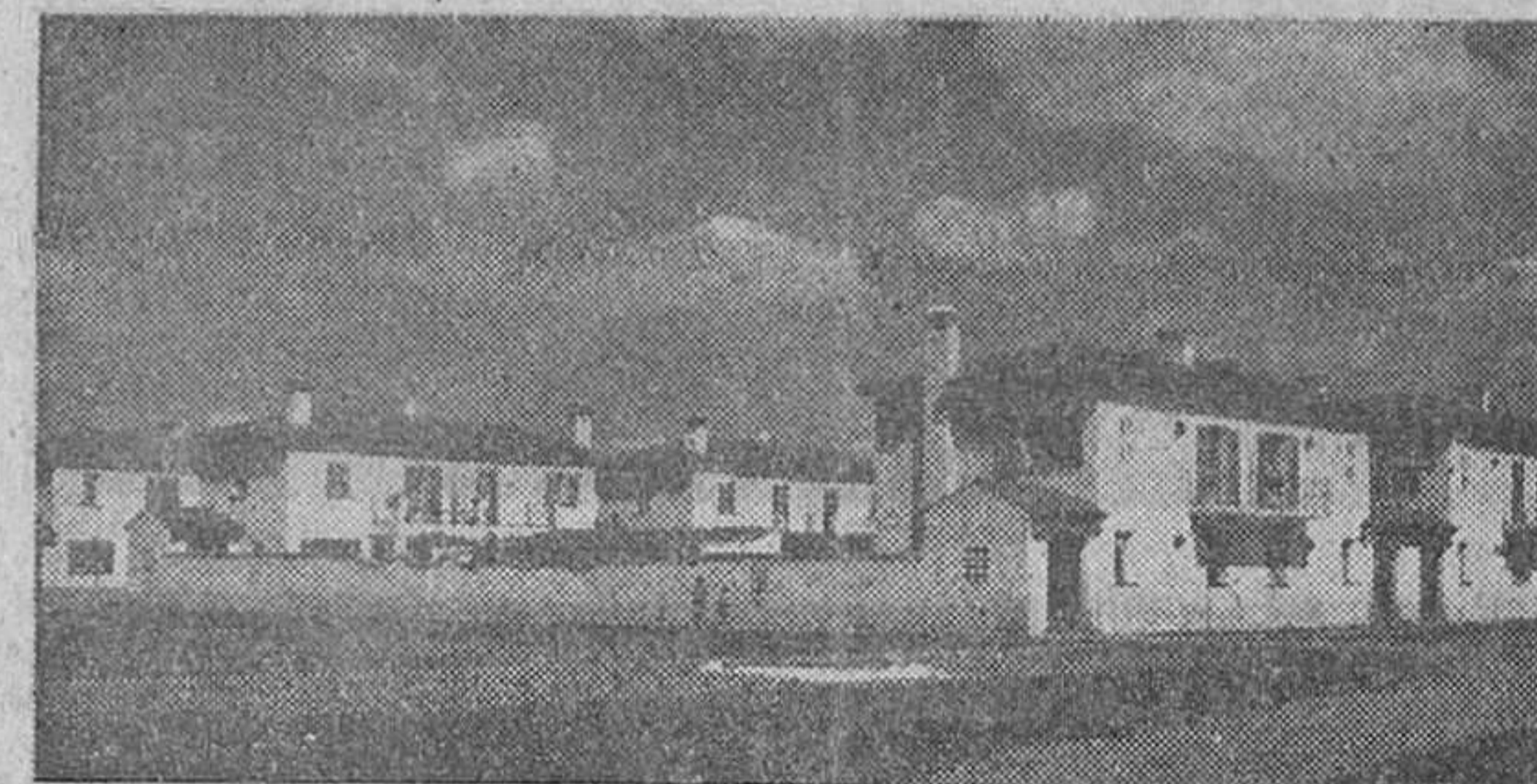
Grupo de casas de la Diputación Provincial