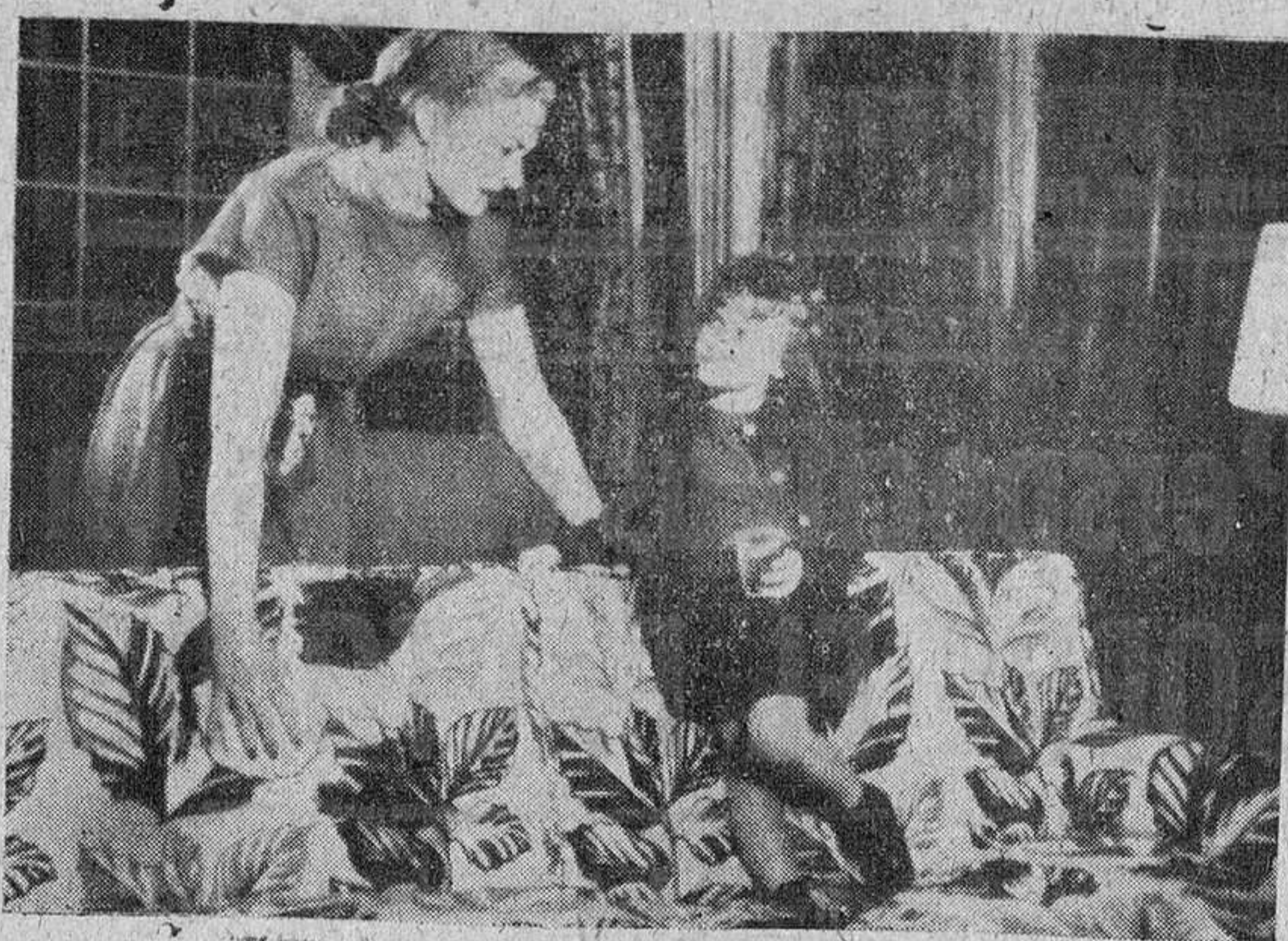
Esta casadita demuestra la facilidad con que se puede limpiar con un trapo húmedo un sofá recubierto de una sustancia plástica.