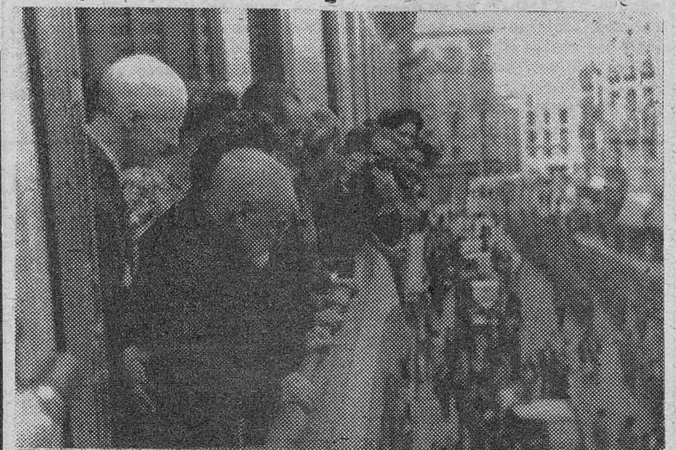
El general don Emilio Díaz Aranzagui que al cumplir los cien años de edad ha recibido el Homenaje del Ejército, presencia el desfile en su honor. (S. O. C.)