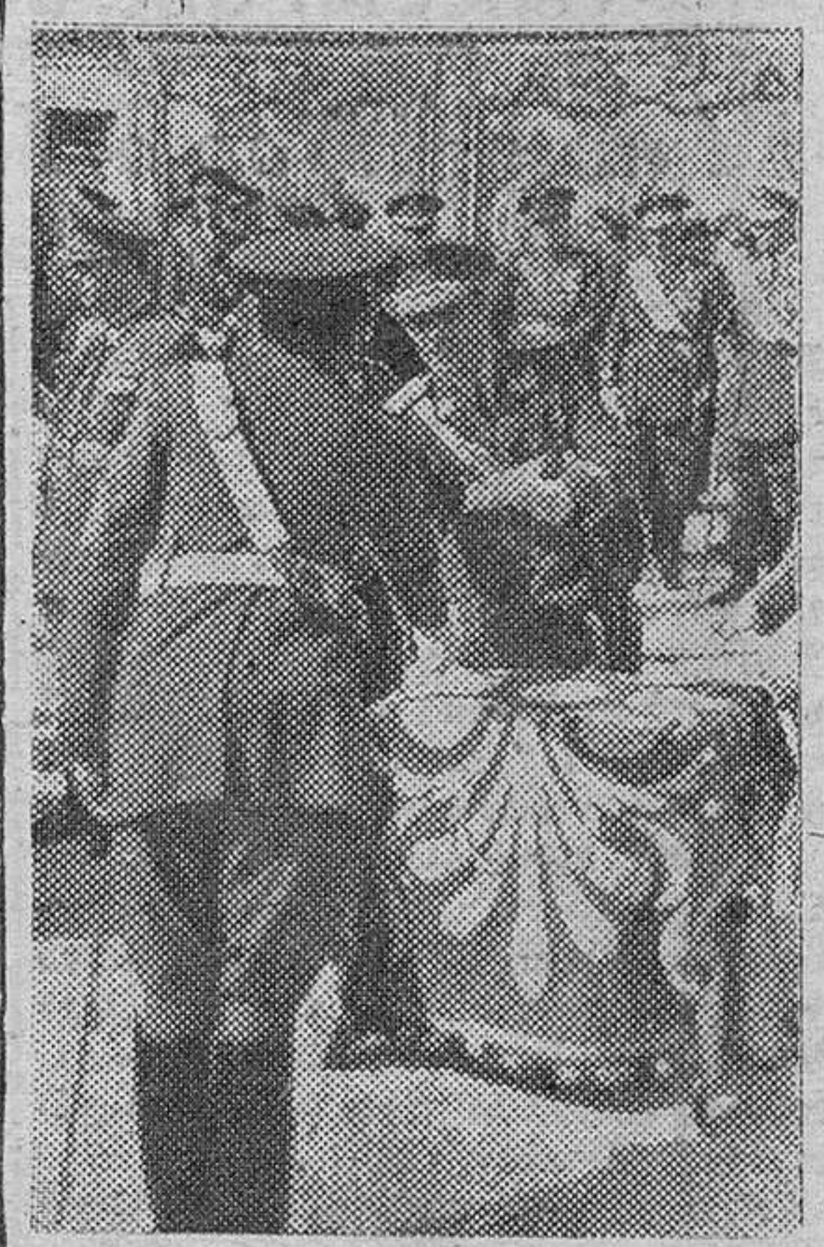
El general Asensio, Ministro del Ejército entrega los despachos a los cadetes de la Escuela de Transformación de Villaverde (Madrid) (S.O.C.)