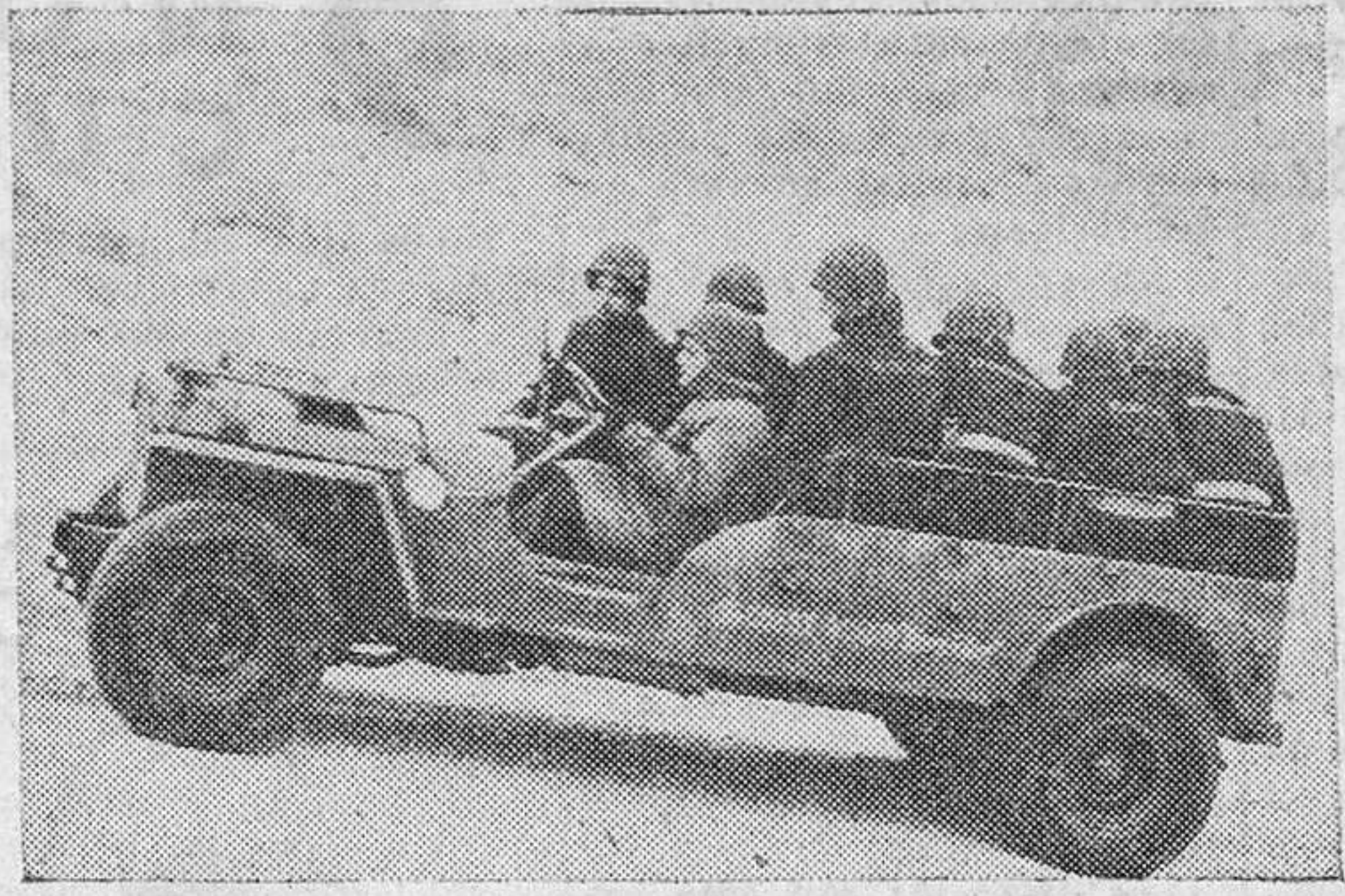
El nuevo «jeep» norteamericano, que tiene una mayor cobija que el modelo anterior

Los ciudadanos de los Estados Unidos se han alegrado al conocer estas noticias. Se les ha dicho que la probable demanda de coches de turismo en los primeros años después de reanudar la producción, se eleva a unos 10.000.000 de coches por año, mientras que la cifra máxima