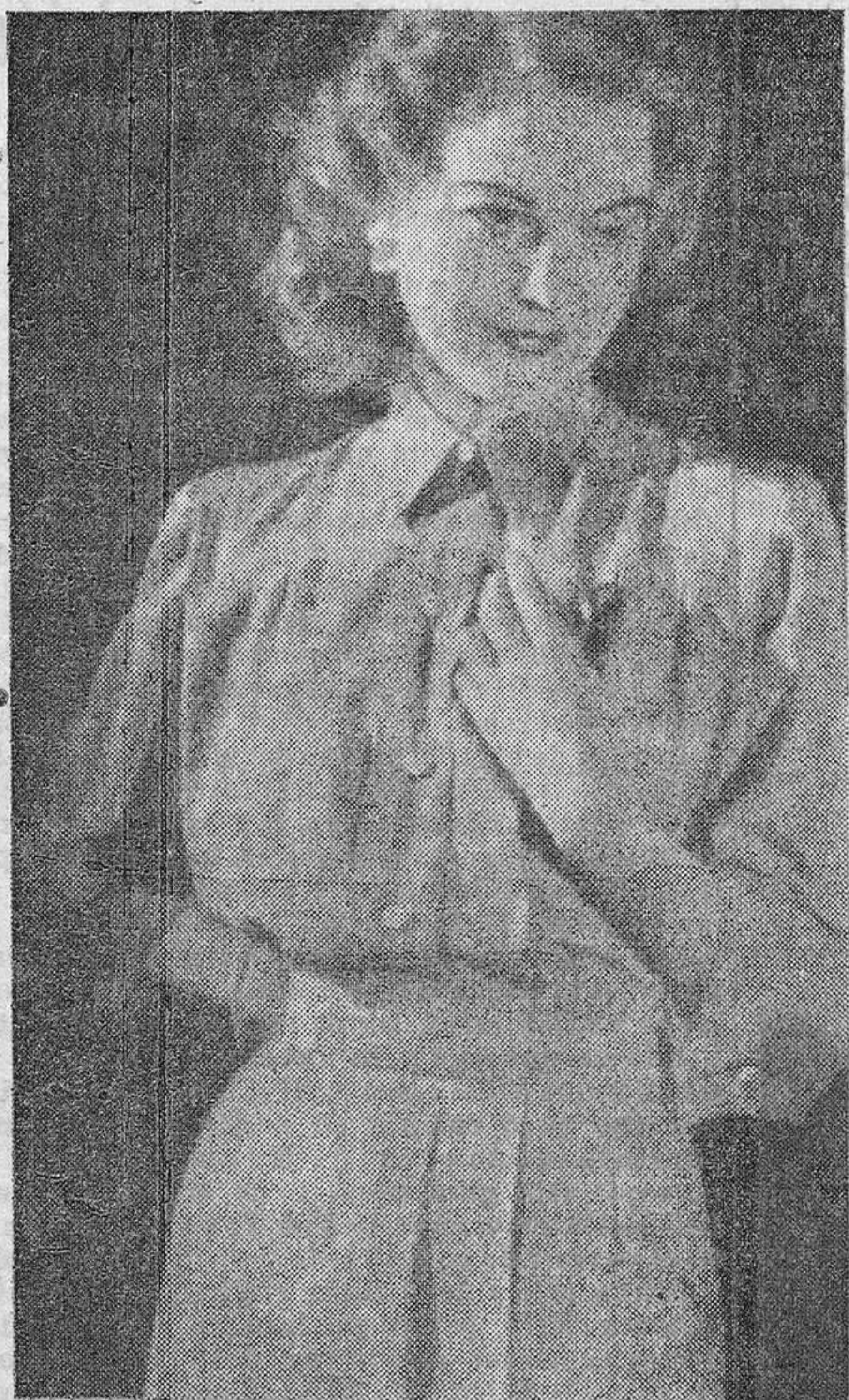
Vestido veraniego con falda de pliegos y blusa de forma o mixera

La Interrogación parecerá obvia; toda mujer se preocupa de lucir hermosa. Pero hay quienes pese a su afán por embellecerse, a su continua asimilación de conocimientos al respecto, a pesar del ensayo de maquillajes y de productos de tocador, descuidan puntos que son importantes. El dominio de los nervios es esencial para eliminar esos visajes, esas actitudes que dañan y conspiran en contra de la naturalidad y de la belleza. Sólo con fuerza de voluntad y de en desterrarse esos hábitos, pues careciendo de ese celo no es posible ser plenamente hermosa aún cuando las facciones sean agradables. Analicemos entonces algunos detalles ilustrados.