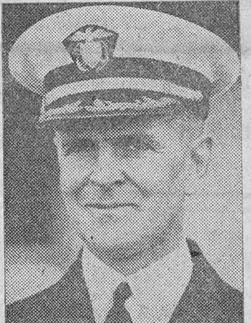
Contra-almirante de la Marina de los EE. UU.