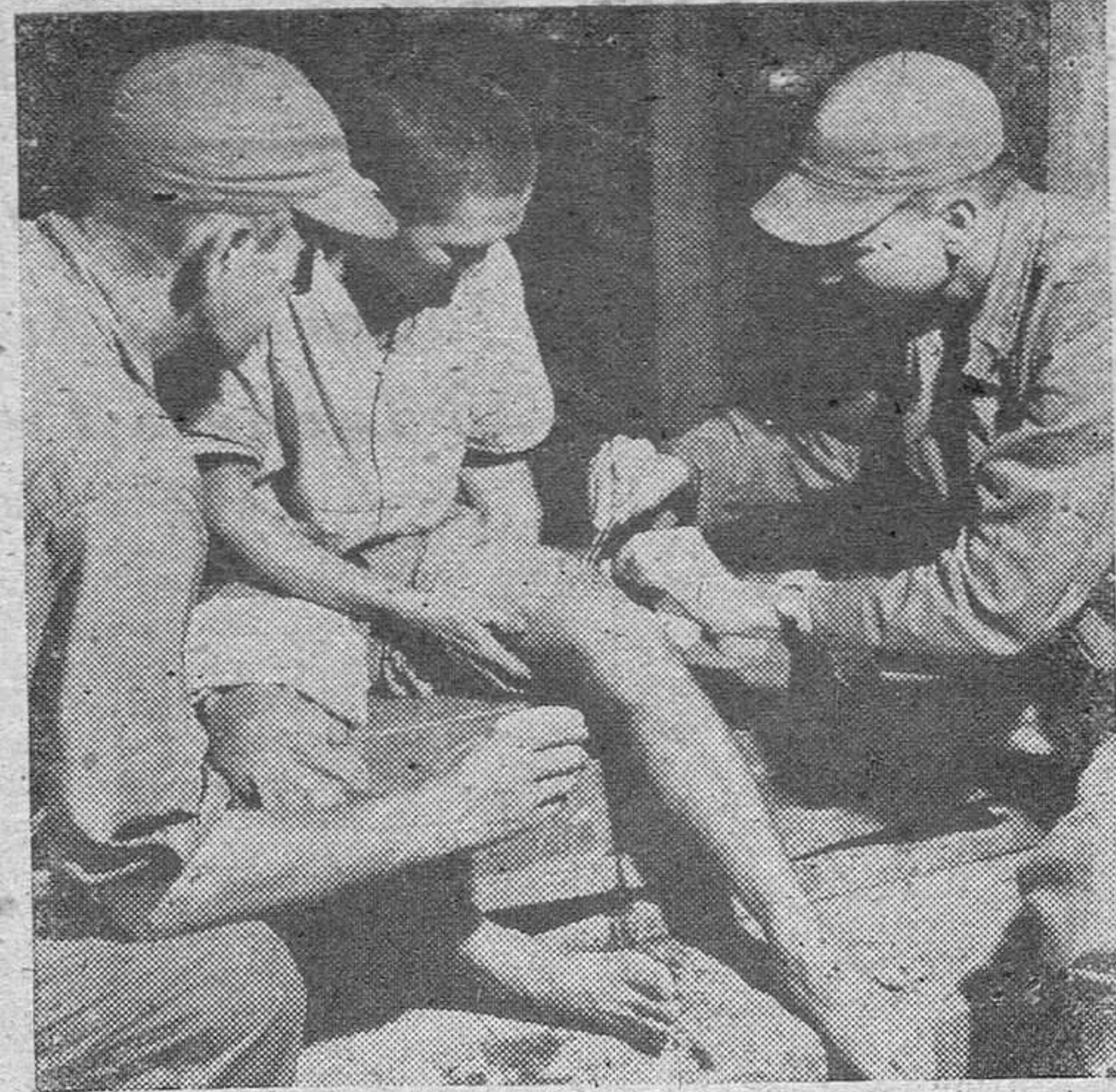
Sanitarios norteamericanos curan en plena calle a un indonesio herido durante los disturbios registrados en Surabaya