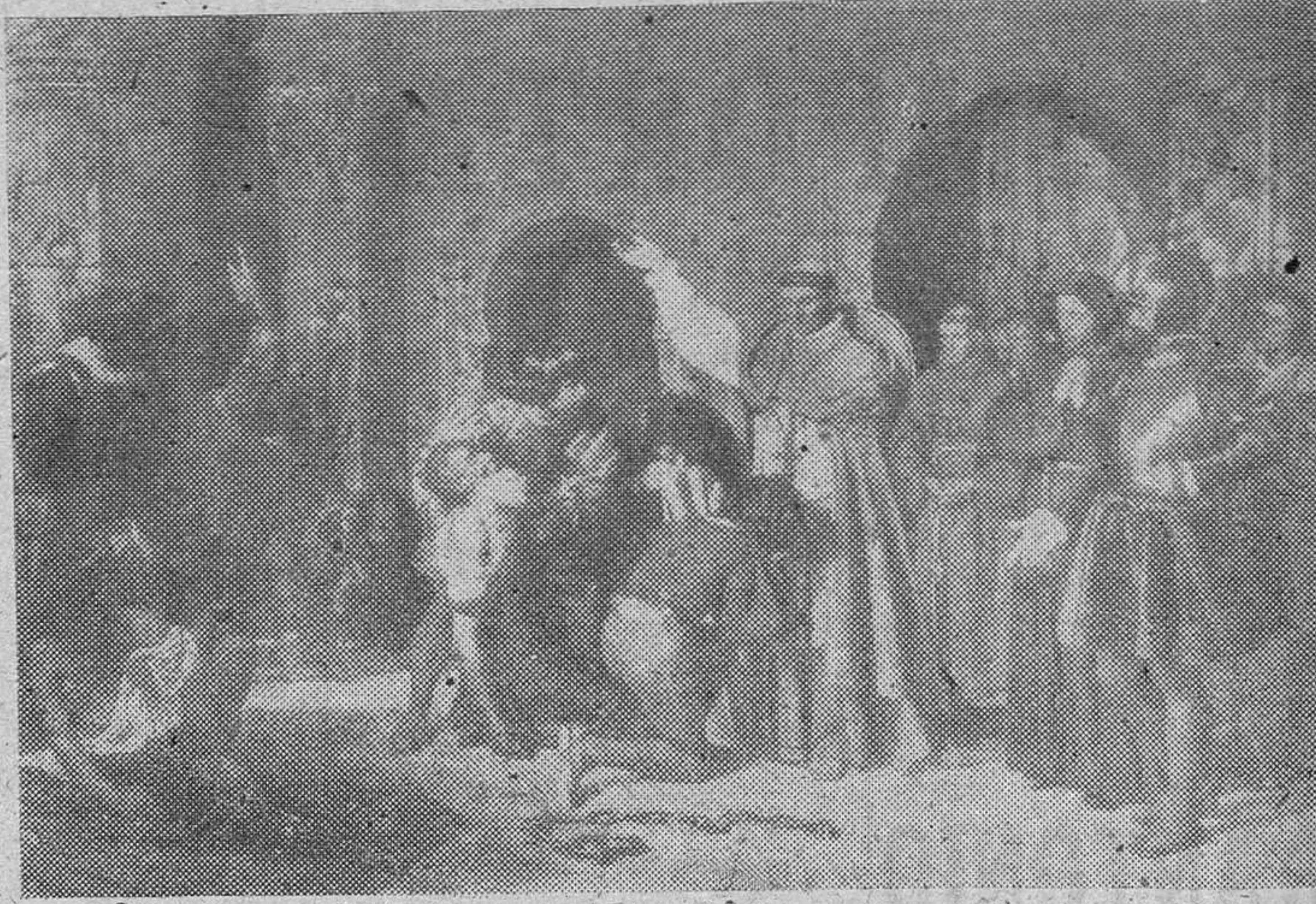
"La conquista de Orán" de Francisco Jover

Estamos viendo por esta colección de artículos que se vienen publicando, la predilección entusiasta que sienten los pintores españoles por concebir las escenas patrióticas en la pintura, que la valentía de nuestros antecesores describieron en defensa de la Patria en cuanto se vio comprometida su independencia. Unas veces son los artistas contemporáneos al suceso, los que se encargan de perpetuar en el lienzo, el momento o el gesto individual más enterizo que tuvo la proeza; otras son pintores de generaciones sucesivas los que, aunando datos y crónicas, enmarcan en el cuadro con atisbos de exactitud histórica, el hecho militar tal como se ha hecho llegar hasta ellos; pronto veremos cómo artistas contemporáneos pintan asimismo preferentemente sucesos militares pasados y presentes de nuestra Patria.