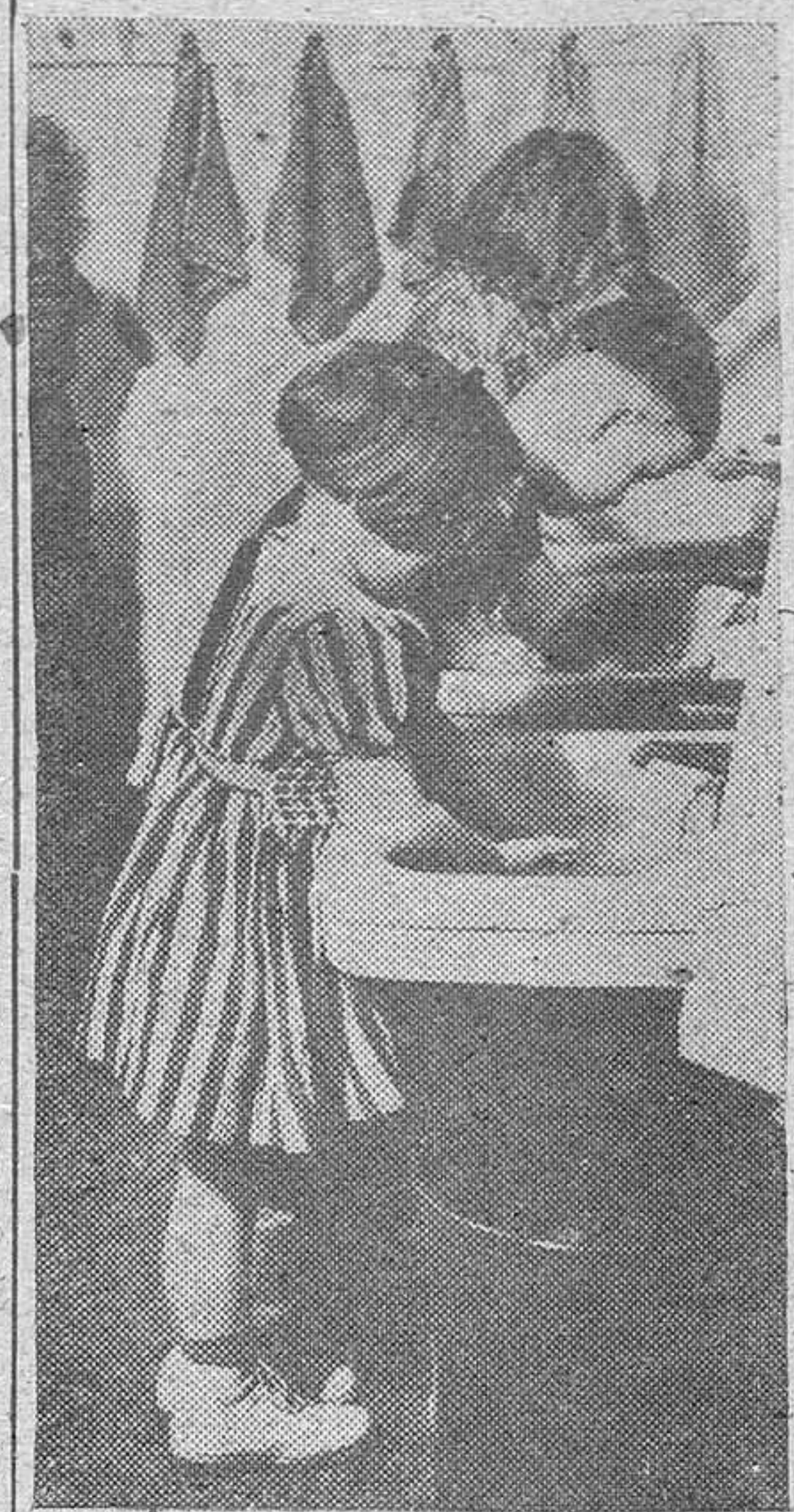
La hora del aseo en una de las modernas escuelas de puericultura para los niños de los obreros empleados en los astilleros norteamericanos.

En una Escuela Puericultora norteamericana