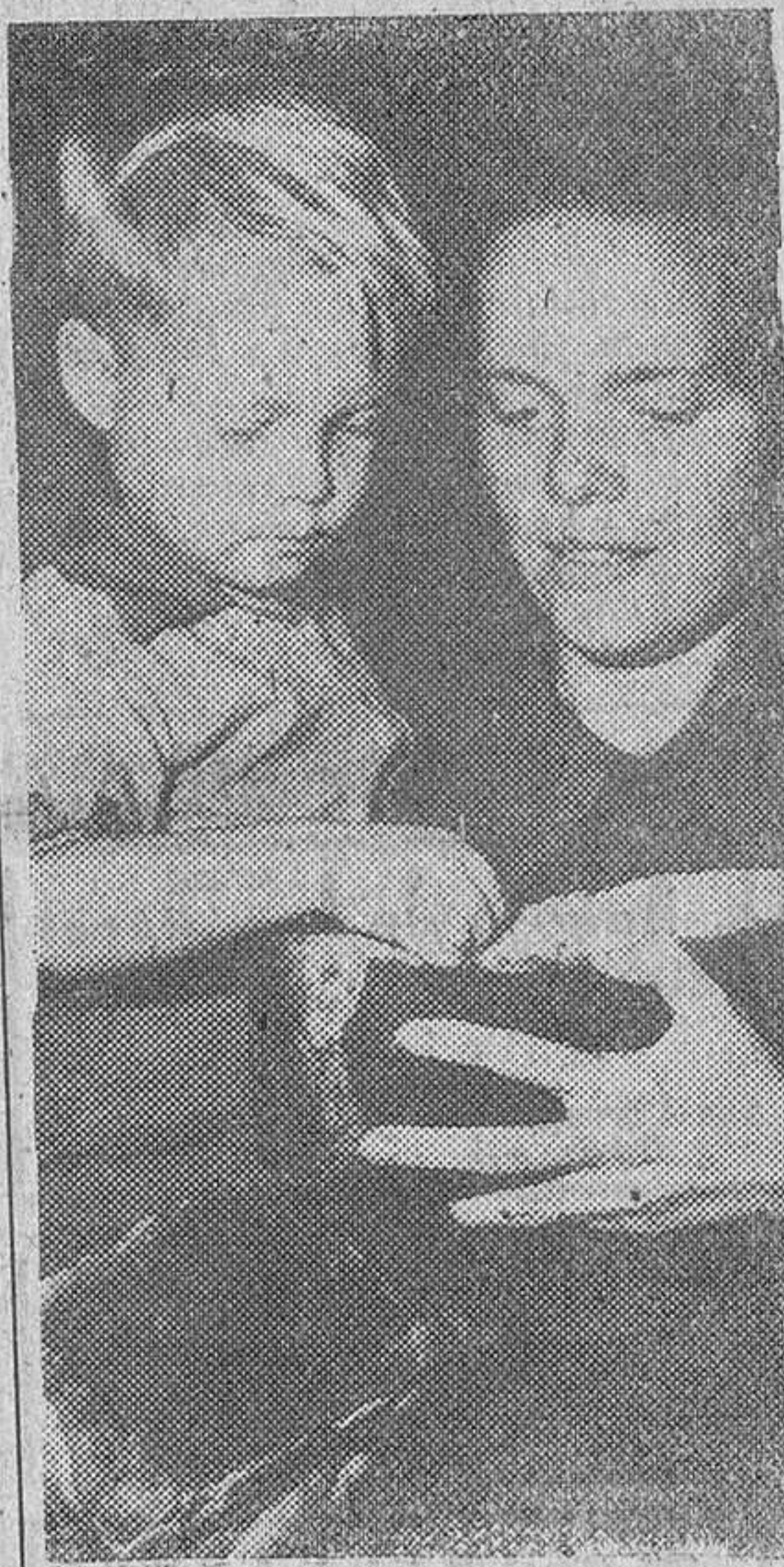
Una madre americana con su hijo, contemplan los panes que han visto por primera vez desde hace tres años después de liberados de un campo de internamiento japonés.