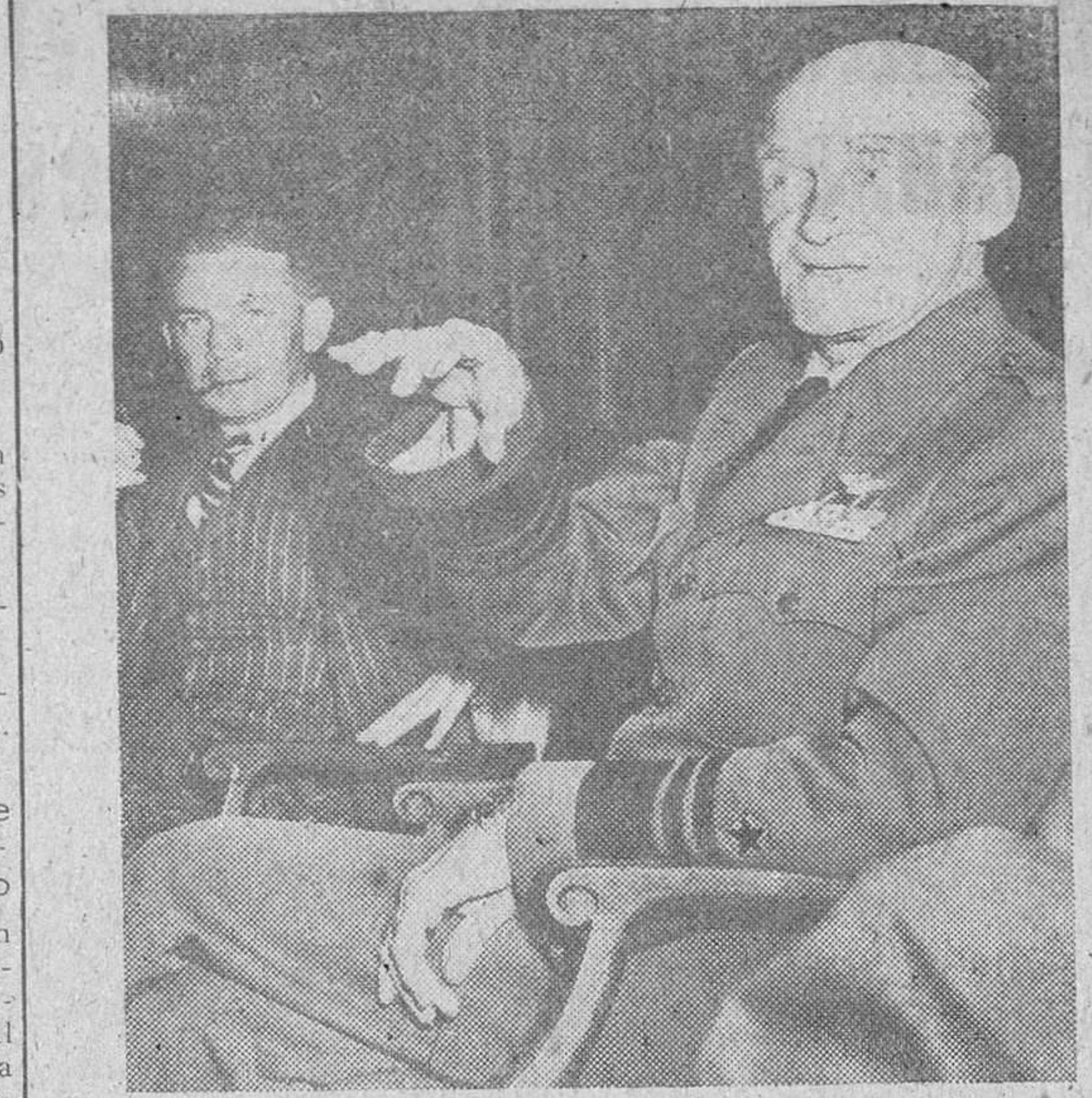
El vicealmirante norteamericano Marc A. Mitscher, jefe de una fuerza de choque de la 5ª Flota, describe las encarnizadas luchas de Okinawa, mientras el secretario de la Marina, James V. Forrestal, escucha.

ROMA, 21.—Once congresistas norteamericanos, representantes de otros tantos comités de la Cámara, han llegado a Roma con dos días de retraso sobre el horario previsto. Serán recibidos en audiencia por el Papa. El objeto del viaje es que cada miembro pueda hacerse una idea de las condiciones en Europa y comprobar cómo se gasta el dinero norteamericano y en qué.—Efe.