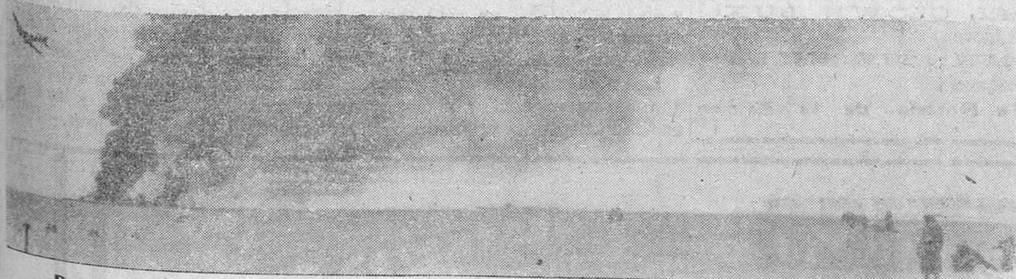
Dos aviones soviéticos derribados por un avión de transporte alemán se consumen entre llamas.