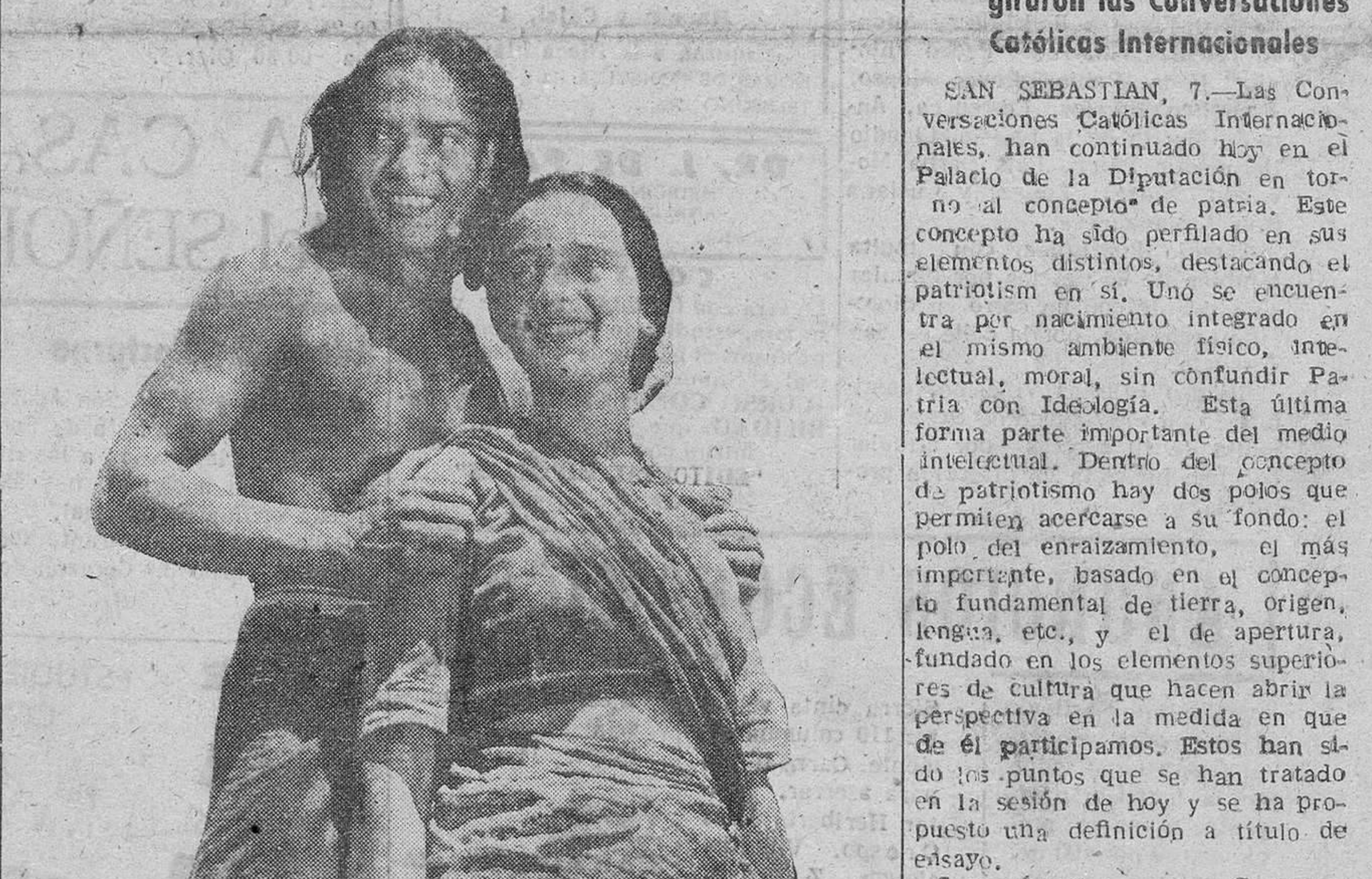
Una escena de la película "El libro de la selva", en la que María Montez, la malograda estrella de cine, aparece con Sabú

PARIS, 7.—En torno al descarrilamiento de un tren en el sureste de Francia, a consecuencia de un acto de sabotaje se conocen los siguientes detalles. Se produjo a las siete de la mañana (hora local). Tres coches del expreso Périgueux-Agen se salieron de la vía entre las poblaciones de Versaas y Gello. Varias personas han resultado heridas.—Efe.