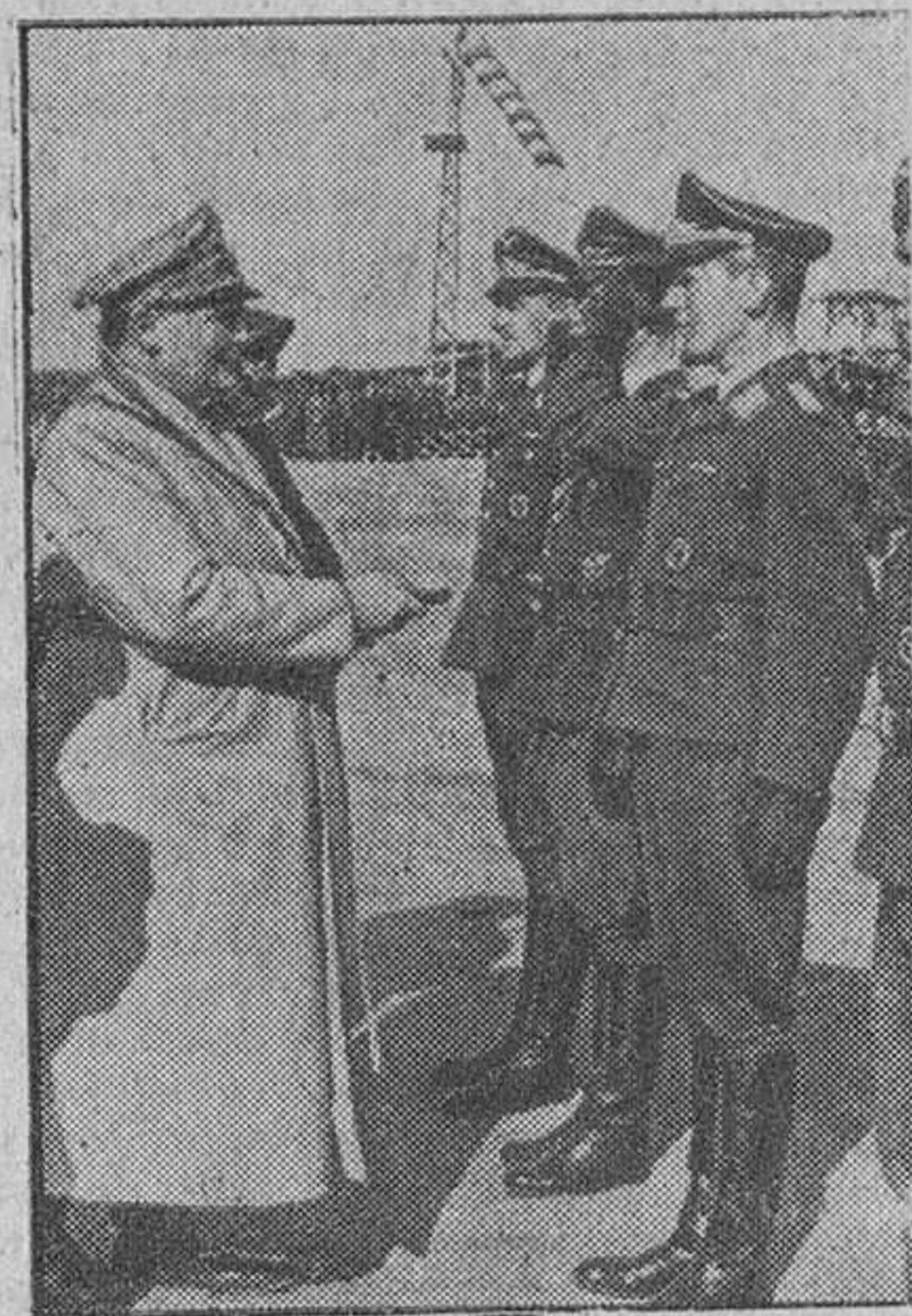
El creador de la Luftwaffe Hermann Goering antiguo piloto de caza visita la unidad aérea que lleva su nombre

ROMA, 28 (S. E. T.).—De las informaciones sobre los ataques aéreos norteamericanos contra Bremen se deduce en la capital de Italia la existencia