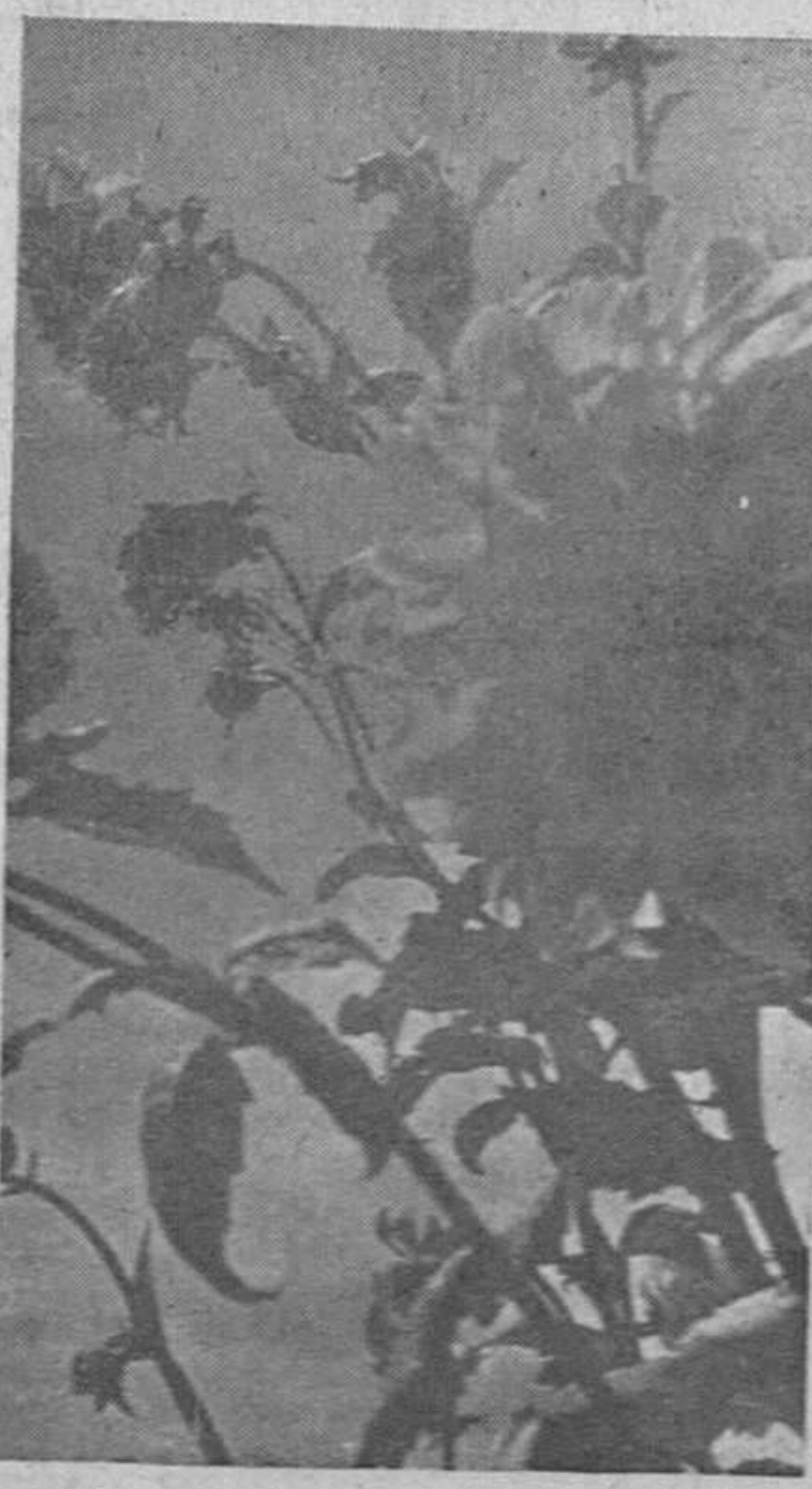
En la amanecida, húmedas de rocío, se abren en el sosiego del campo estas flores ocultas que dan al aire su olor entre San Juan y San Pedro...

Todavía diréis que con la primera parte del refrán estábamos al cabo de la calle. Podrá ser interpretando el refrán al modo agrícola. Pero al