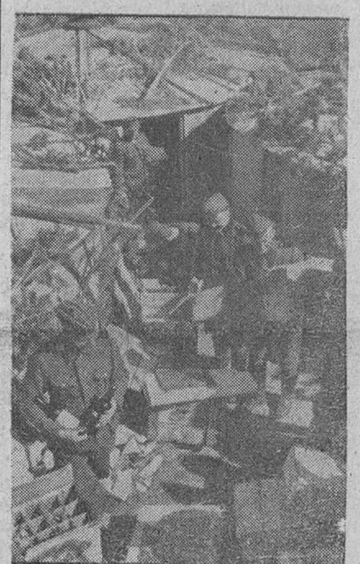
El correo, junto a la carta familiar, hace entrega de los paquetes de obsequios que envía la retaguardia