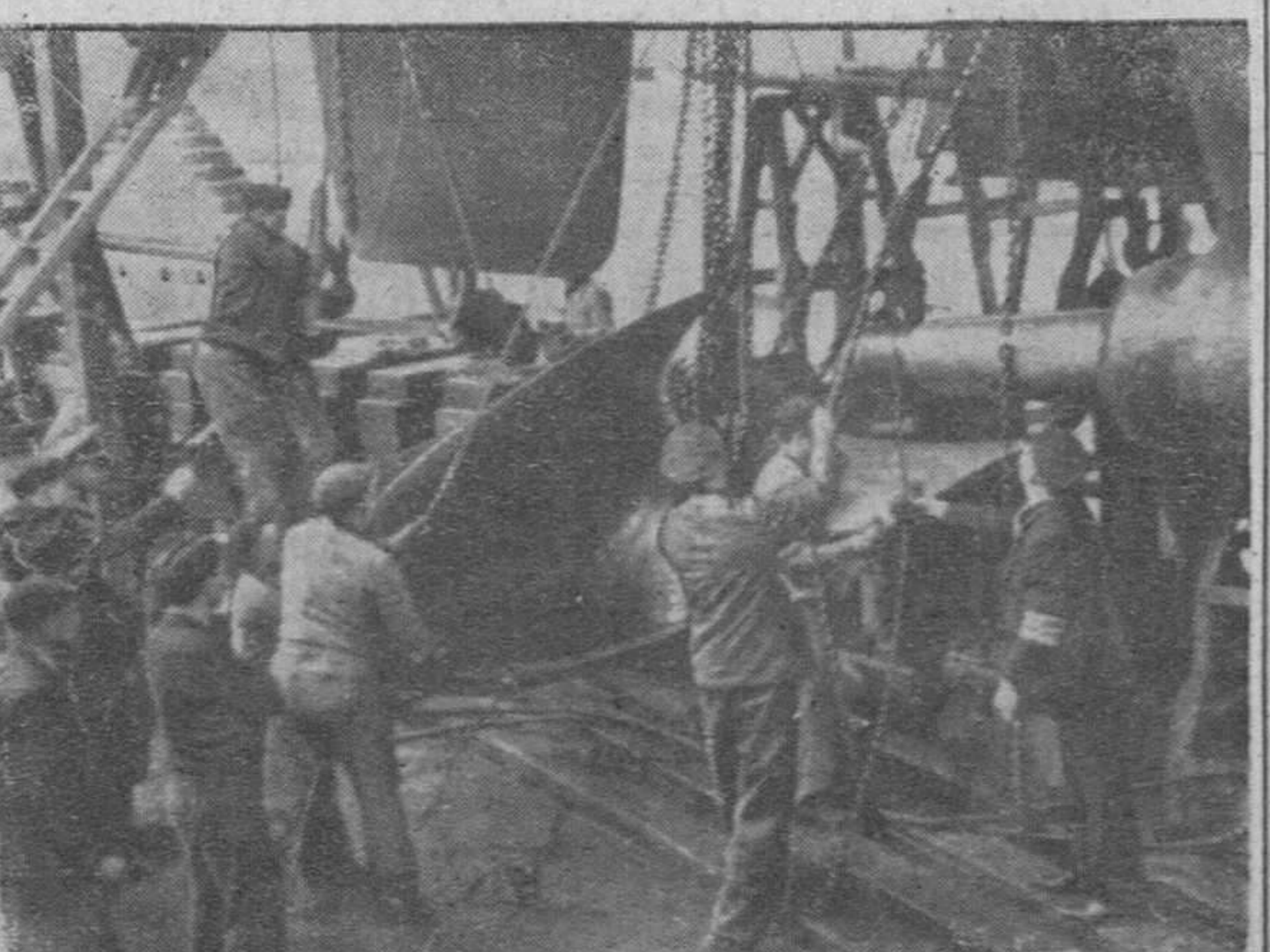
Artilleros alemanes proceden al montaje de nuevos cañones de largo alcance en la costa atlántica europea para reforzar las defensas de la misma que resguardan al continente de las posibles incursiones enemigas.