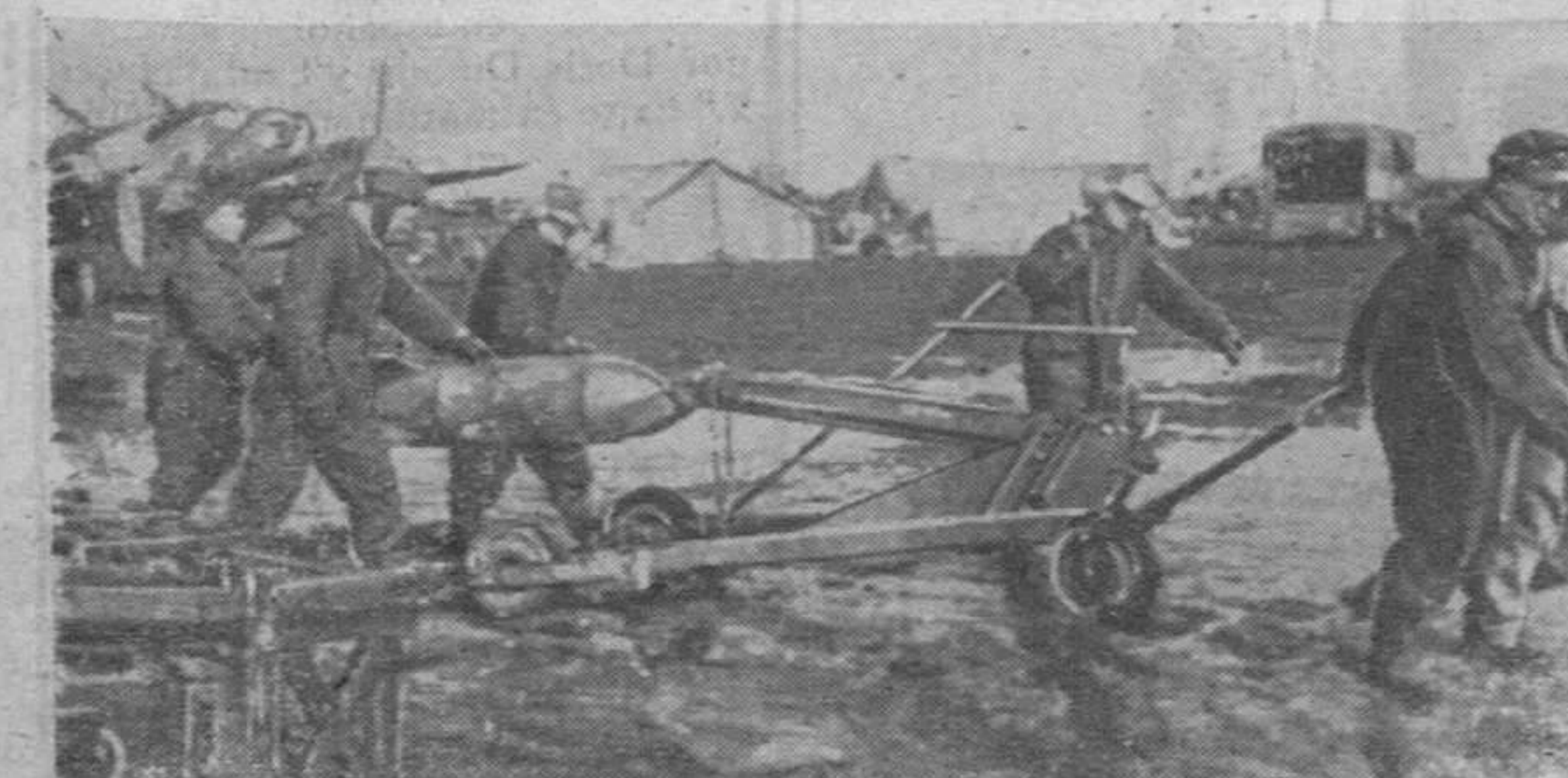
El aeródromo convertido en barrizal por el deshielo no es obstáculo para la guerra moderna. Apenas han tomado tierra los aparatos hay que cargarlos de nuevo venciendo el lodo que aprisiona a los servidores y las máquinas