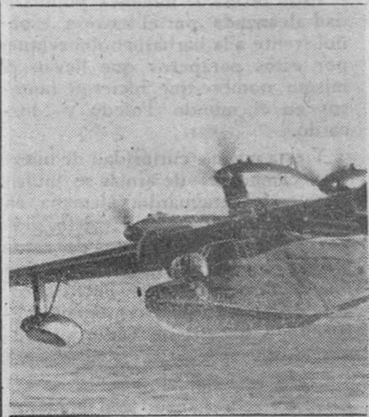
Numerosos hidroaviones de reconocimiento a larga distancia constituyen un poderoso complemento del bastión defensivo de Europa