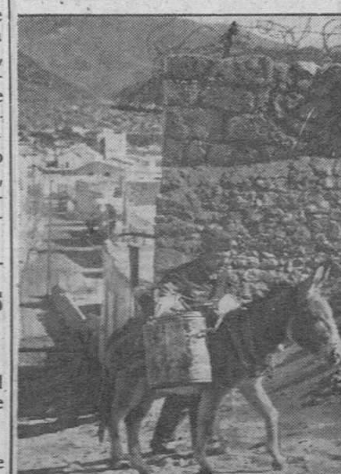
Para atender a las necesidades de la guarnición alemana el agua es transportada a los destacamentos valiéndose de este medio primitivo