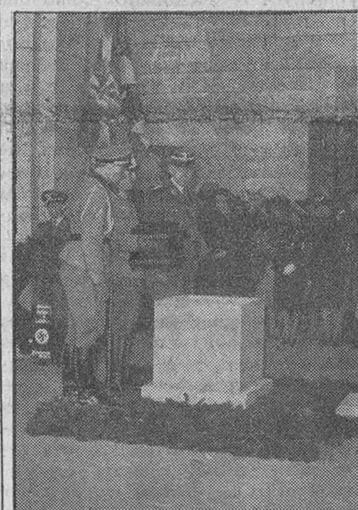
Una conteniendo los restos del jefe de Deportes del Reich antes de ser enterrados en el Estadio de Berlín