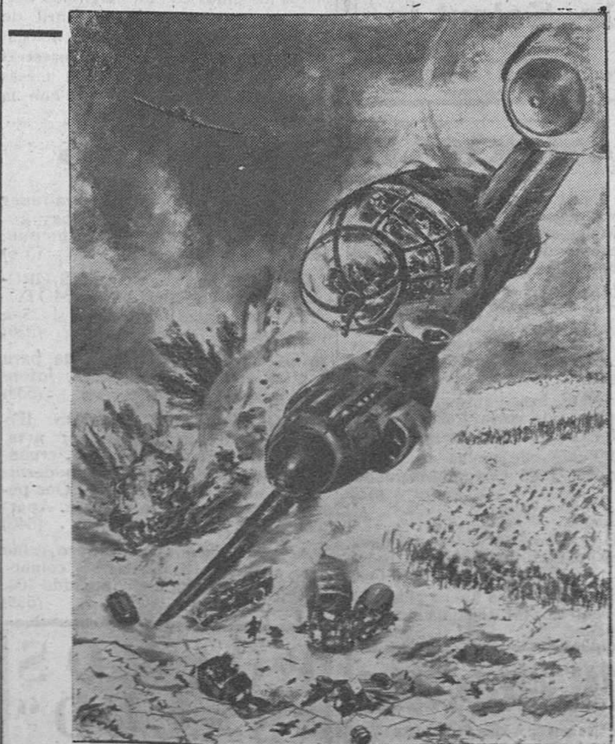
Impresionante dibujo de un corresponsal alemán, en el que se recoge la destrucción de un convoy ruso de aprovisionamiento, por aviones germanos de combate