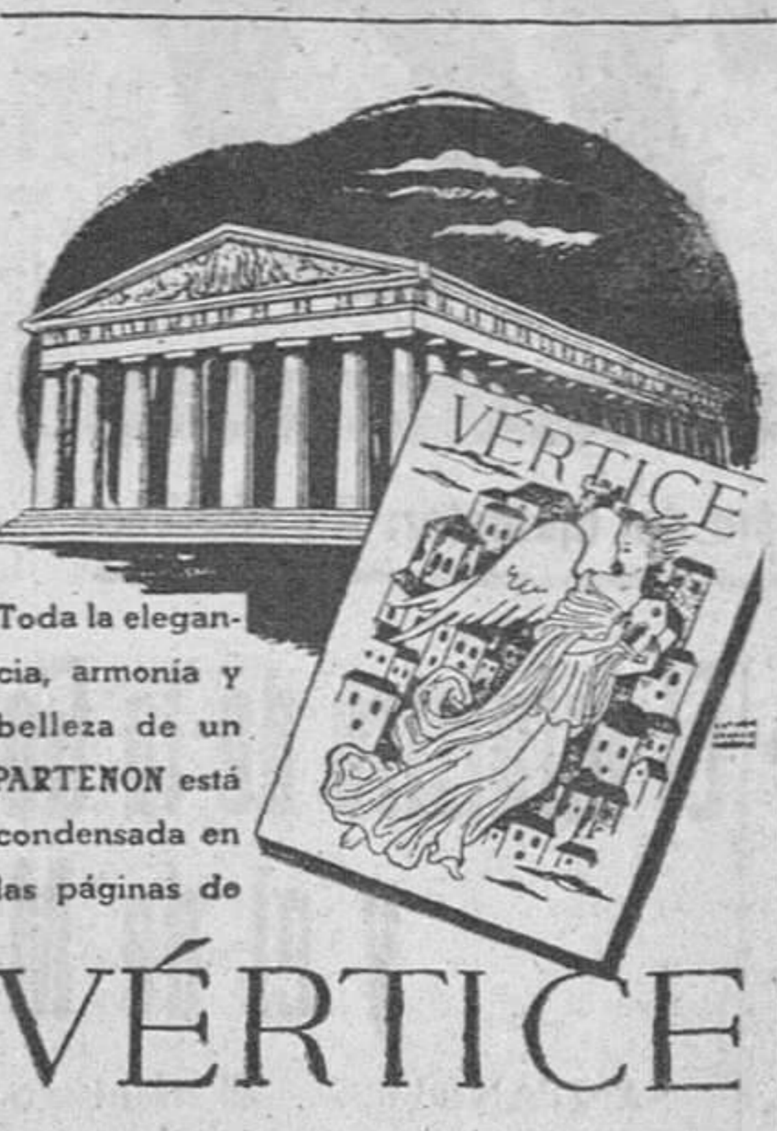
Toda la elegancia, armonía y belleza de un PARTENON está condensada en las páginas de

Con esta única consigna, siguen perpetuando los españoles al otro extremo del mapa europeo, el gesto orgulloso de la Raza.