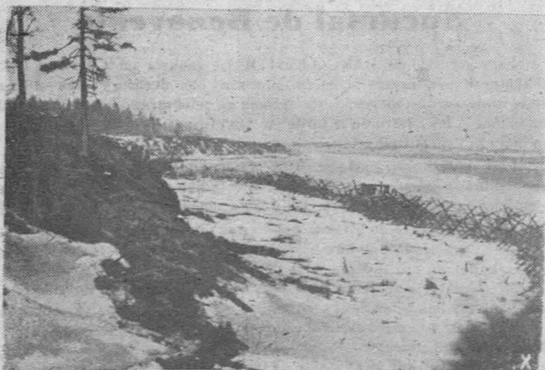
Poderosas líneas alemanas corren a lo largo del río Neva, preparadas para recibir los ataques bolcheviques facilitados ahora por el espesor del hielo.