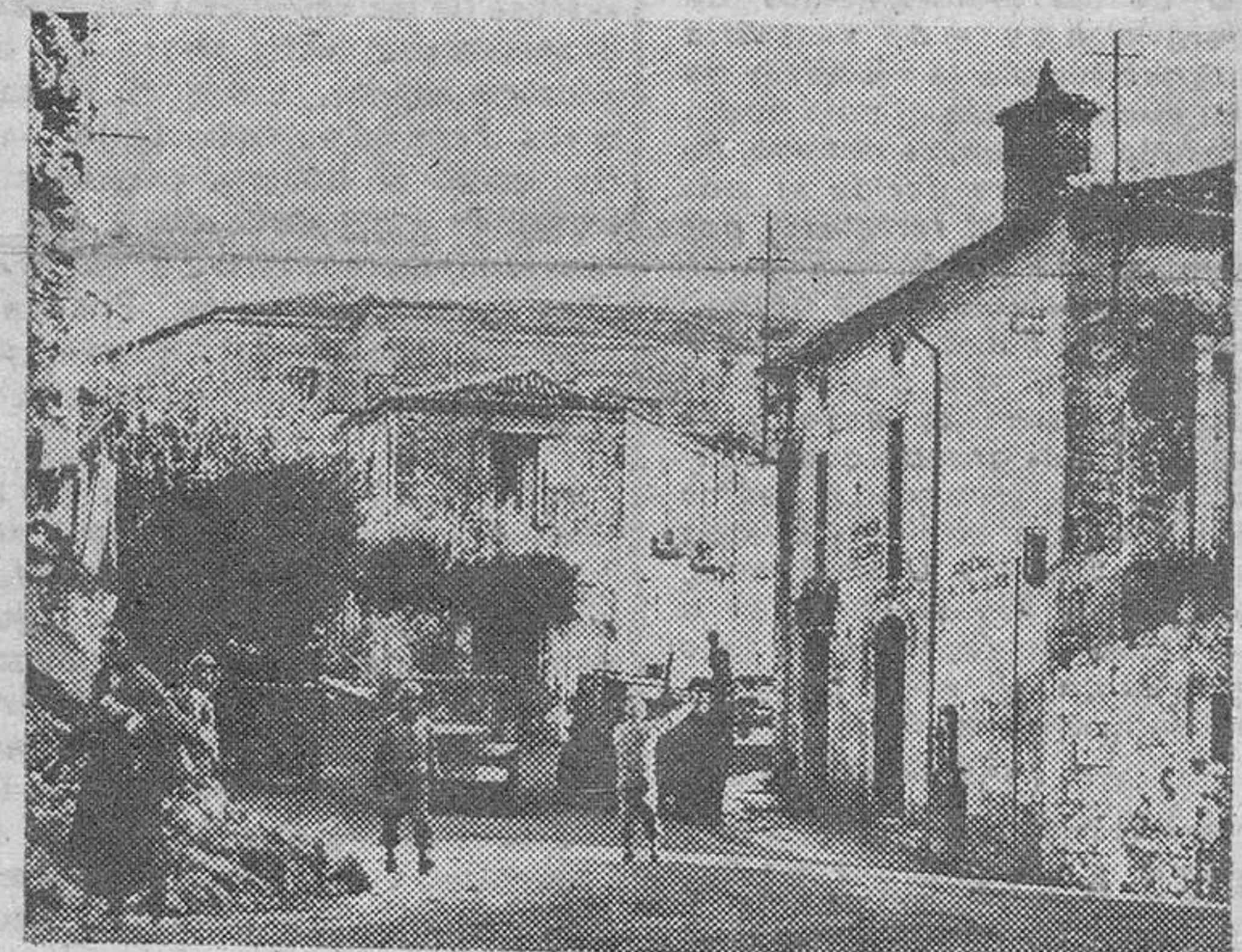
Un soldado americano regula el tráfico en un cruce de la calle principal de Venafro, Italia.

LONDRES, 29.—Aterca de las negociaciones entre la URSS y Finlandia y en respuesta a una pregunta formulada en los Comunes, el ministro Eden dijo que no tenía nada que añadir a la nota del Gobierno soviético publicada por radio Moscú el 21 de marzo. El Gobierno de S. M., añadió, ha sido consultado acerca de las posiciones del Gobierno soviético.