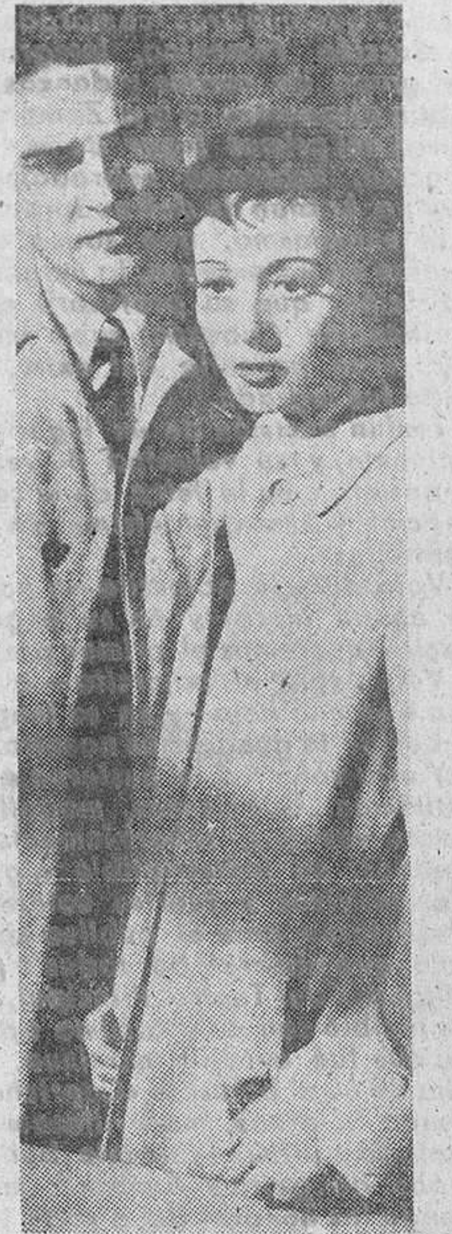
Luisa Rainer y Arturo de Cordova, en una escena de «Rehens»

Luisa Rainer que desesperadamente le seguía los pasos, de un lugar para otro encuentra a su padre en Marsella y por medio del cónsul norteamericano