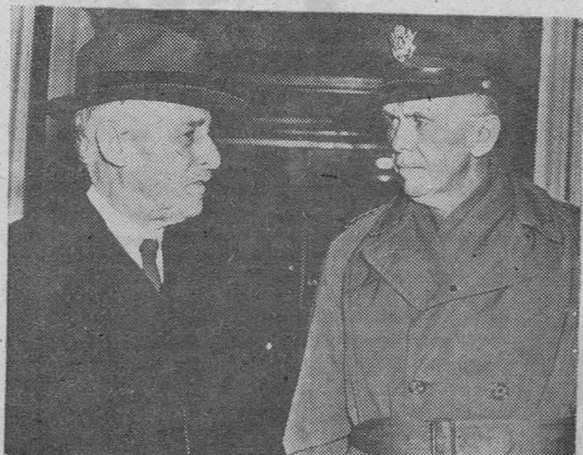
El secretario de Guerra norteamericano, Stimson, y el general Marshall, saliendo de la Casa Blanca en Washington después de conferenciar con el Presidente.