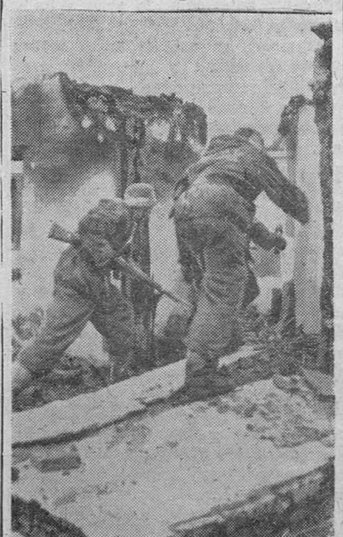
Fuileros de la División «Gran Alemania» contraatacan en las ruinas de un pueblo soviético destruido.