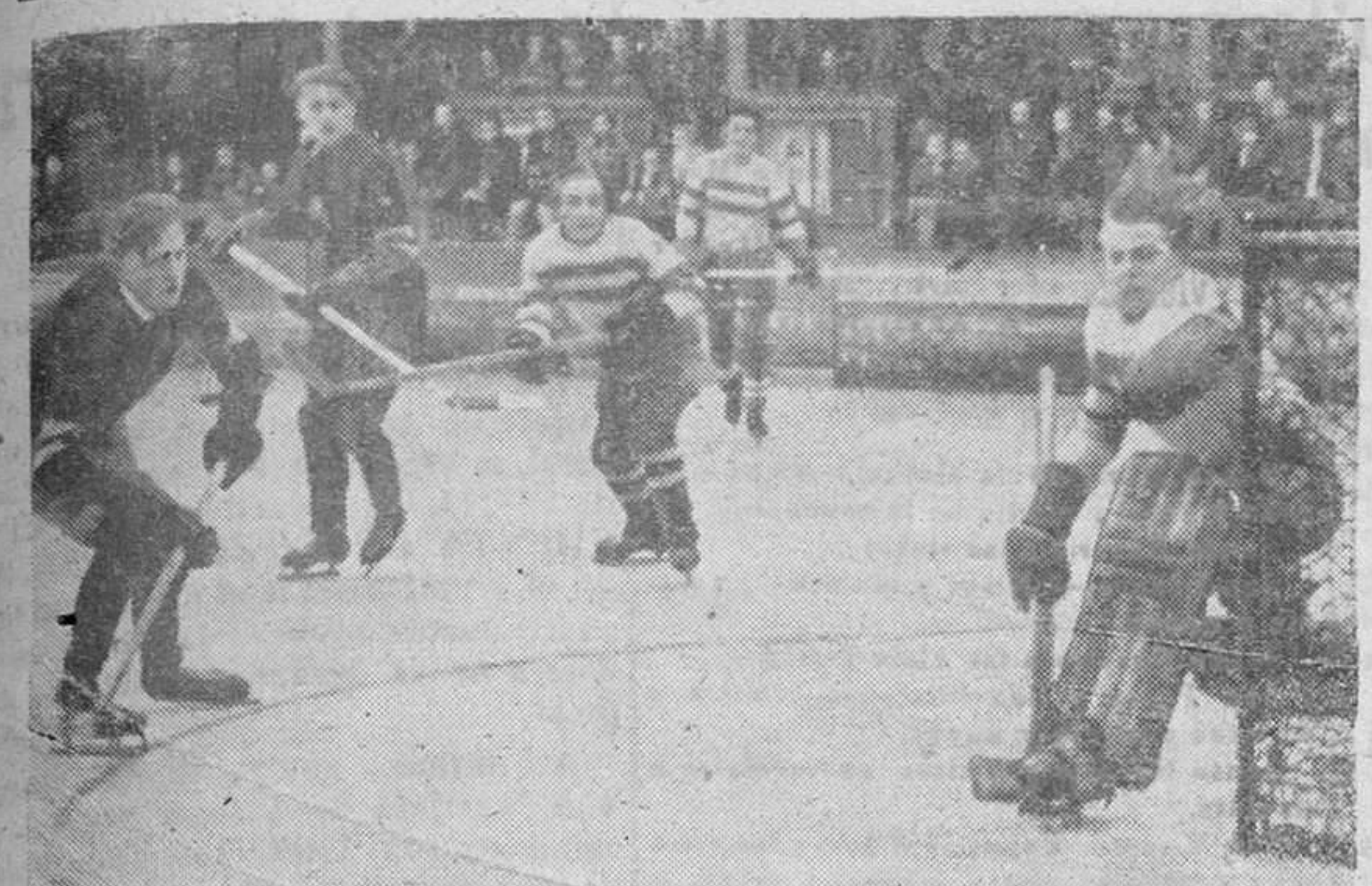
En Praga se ha celebrado un campeonato de hockey sobre hielo en que intervinieron equipos de las Juventudes Hilerianas.