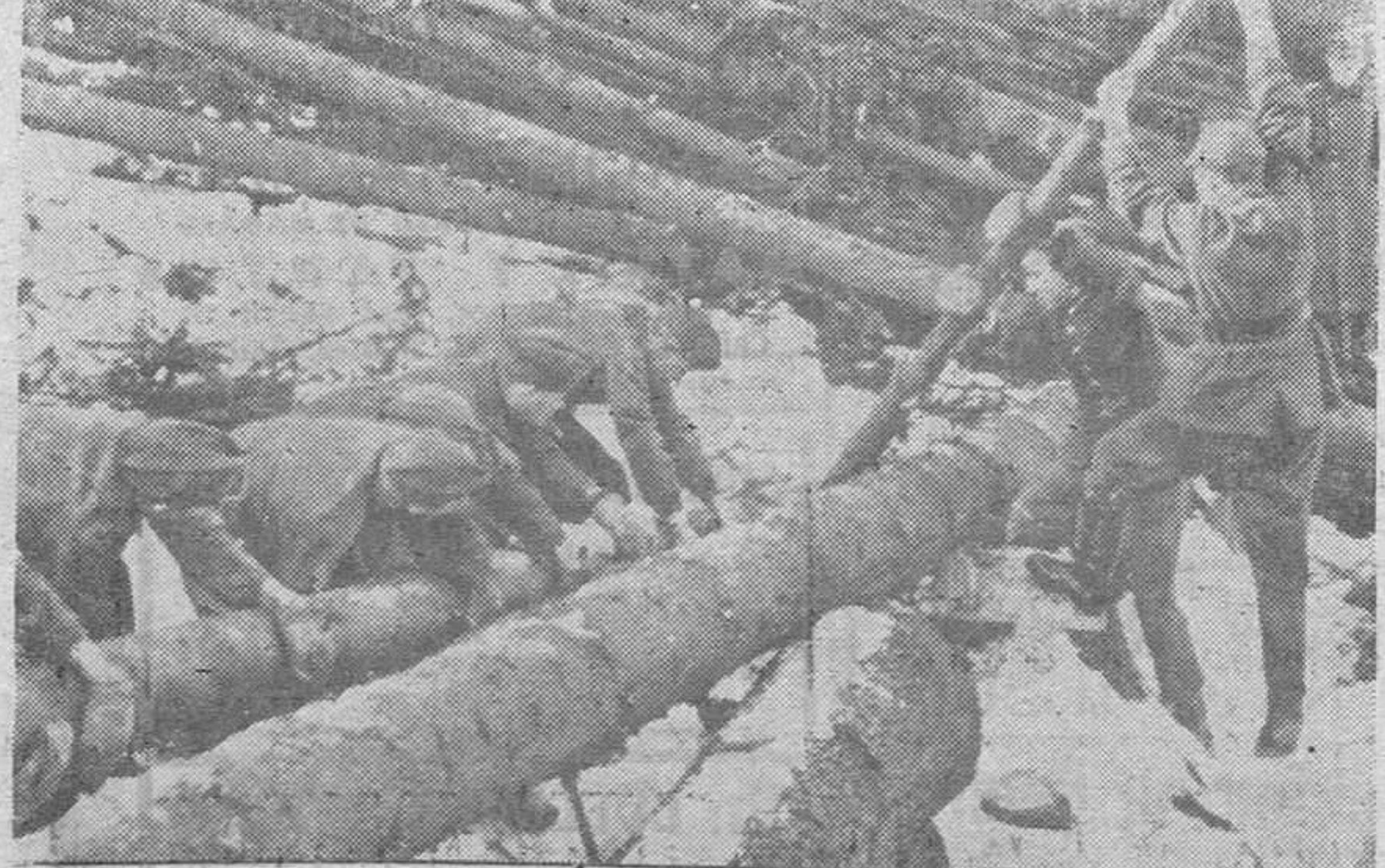
Un grupo de muchachos del Servicio de Trabajo alemán, coloca los primeros troncos para la construcción de una fortificación de madera.