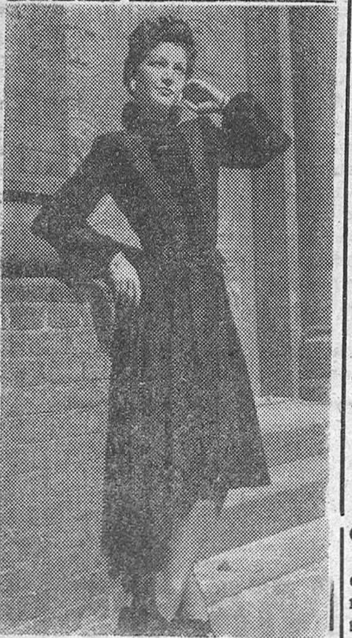
De lana negra está hecho todo este vestido de tarde. Un pechero fruncido de la misma tela del vestido, está separado de éste por dos tiras de mojré

Vea en la página 4.ª nuestra sección Fémica y en la 3.ª Discurso de las Armas y las Letras