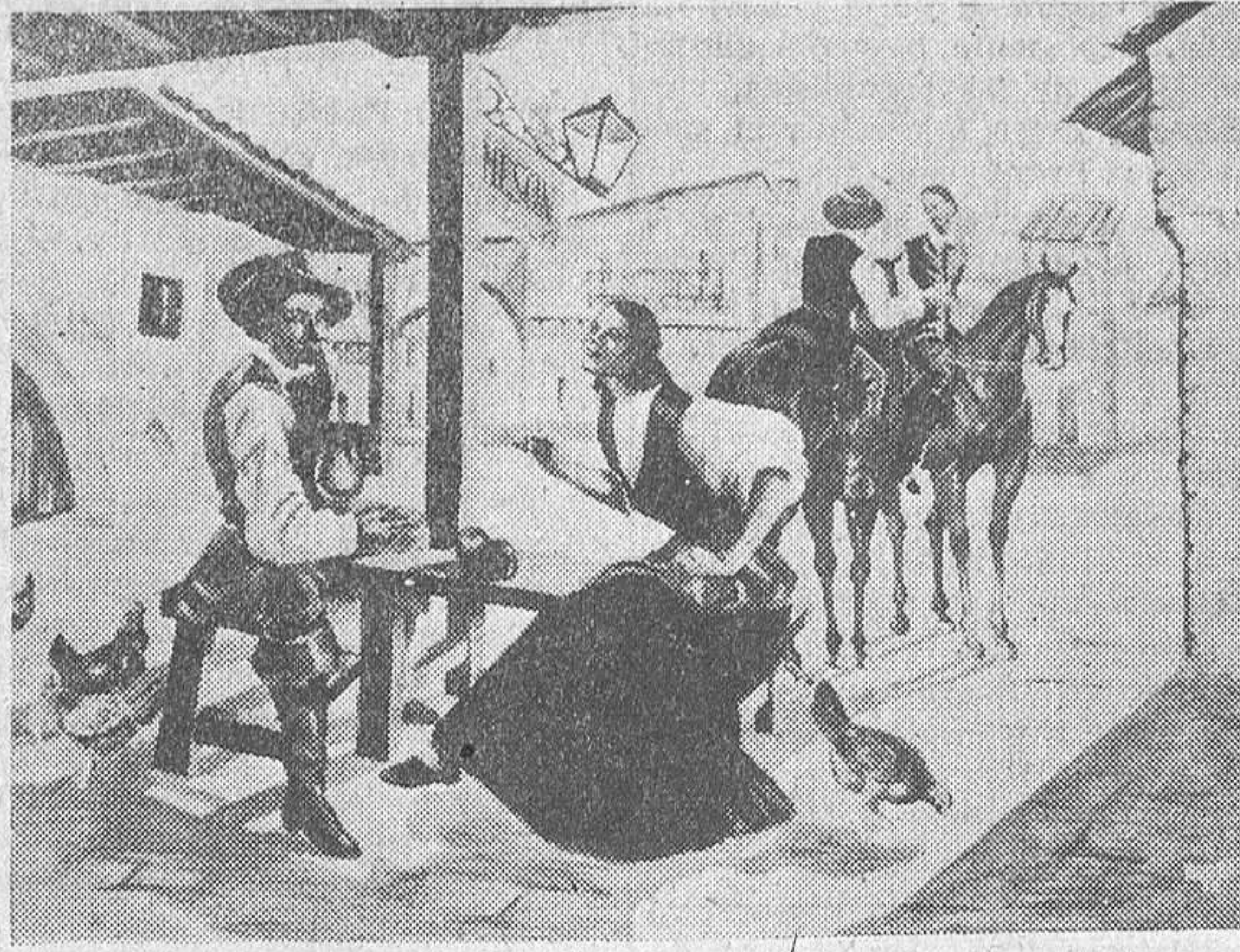
Esta escena flamenca, realizada por «Rodri», adorna las paredes del «bar» del Cuartel Viriato. El grabado muestra bien a las claras su calidad estética.

—Pero es la vida, amigo. Hay que salir a buscarla por todos los caminos.