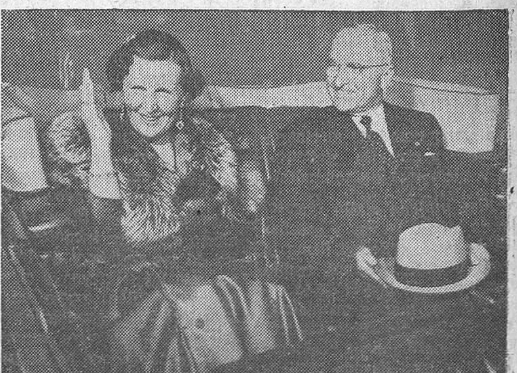
Después de su llegada al Aeropuerto Nacional de Washington, la Reina Juliana de Holanda se dirige a la ciudad, en compañía del Presidente Truman.