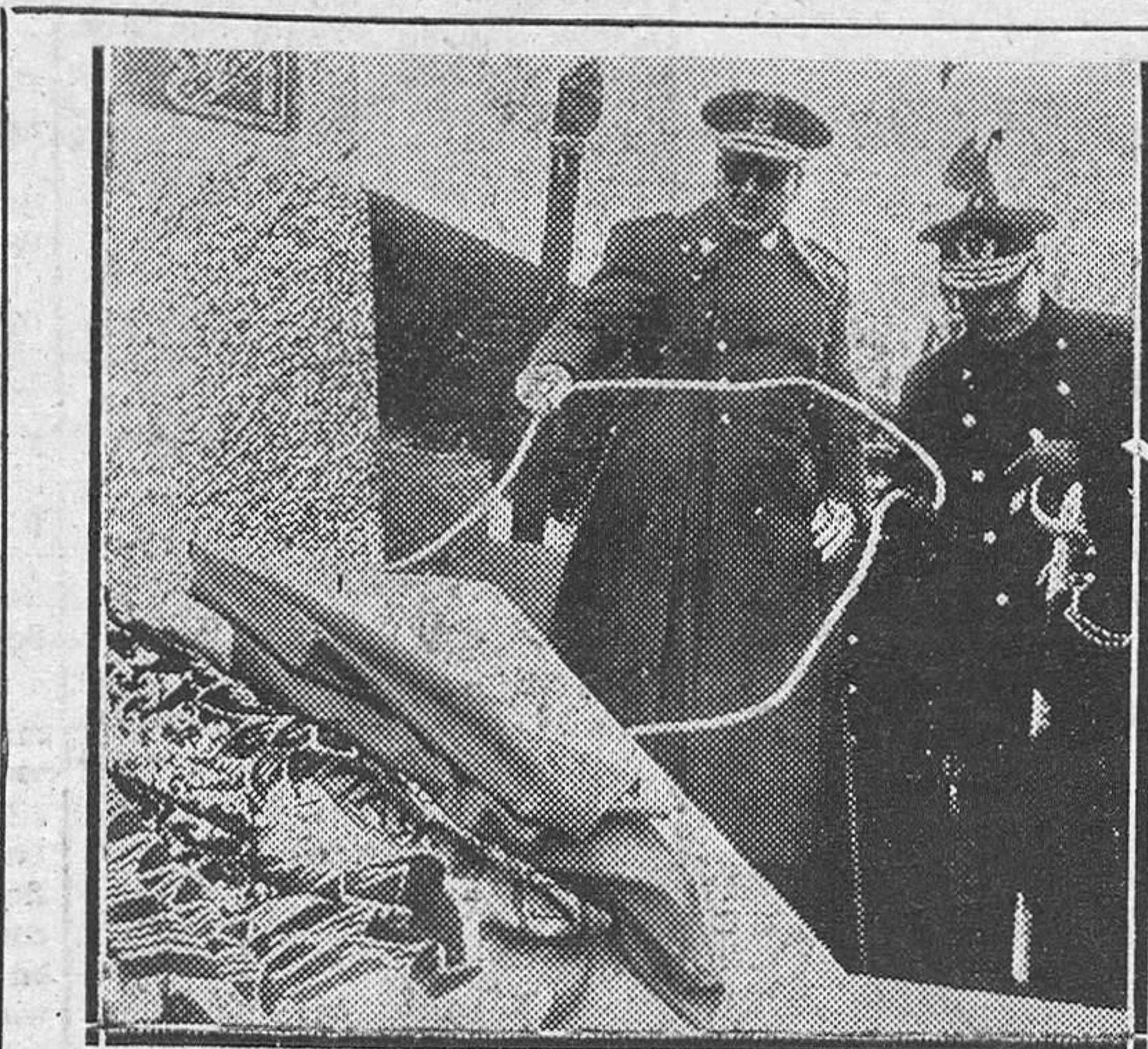
CEUTA.—El alto comisario de España en Marruecos, teniente general García Valiño, en un momento de su discurso en el acto de inauguración de un monolito en la loma de las Trincheras, del poblado de Siut, que conmemora el hecho donde hace treinta y seis años, durante la campaña de Marruecos, fué herido Su Excelencia el Jefe del Estado, entonces capitán de Regulares.

El plan del ministro de Asuntos Exteriores español pondría en posición destacada a España con la que los países árabes se