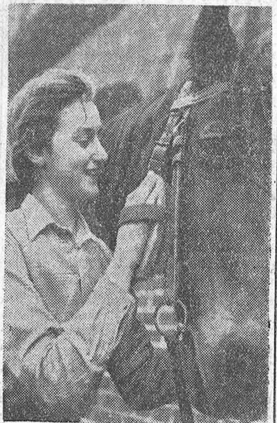
Esta muchacha presta sus servicios en una granja agrícola, contribuyendo al esfuerzo bélico del Reich.