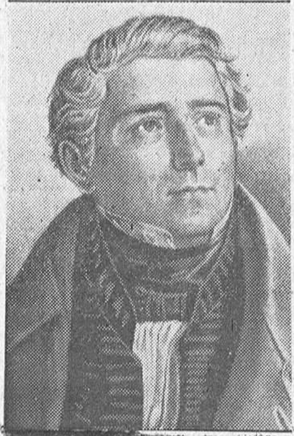
Karl Loewe autor de tantas y tantas melodías populares alemanas, del cual se ha cumplido recientemente el 75 aniversario de su fallecimiento.

75 aniversario de la muerte de Karl Loewe