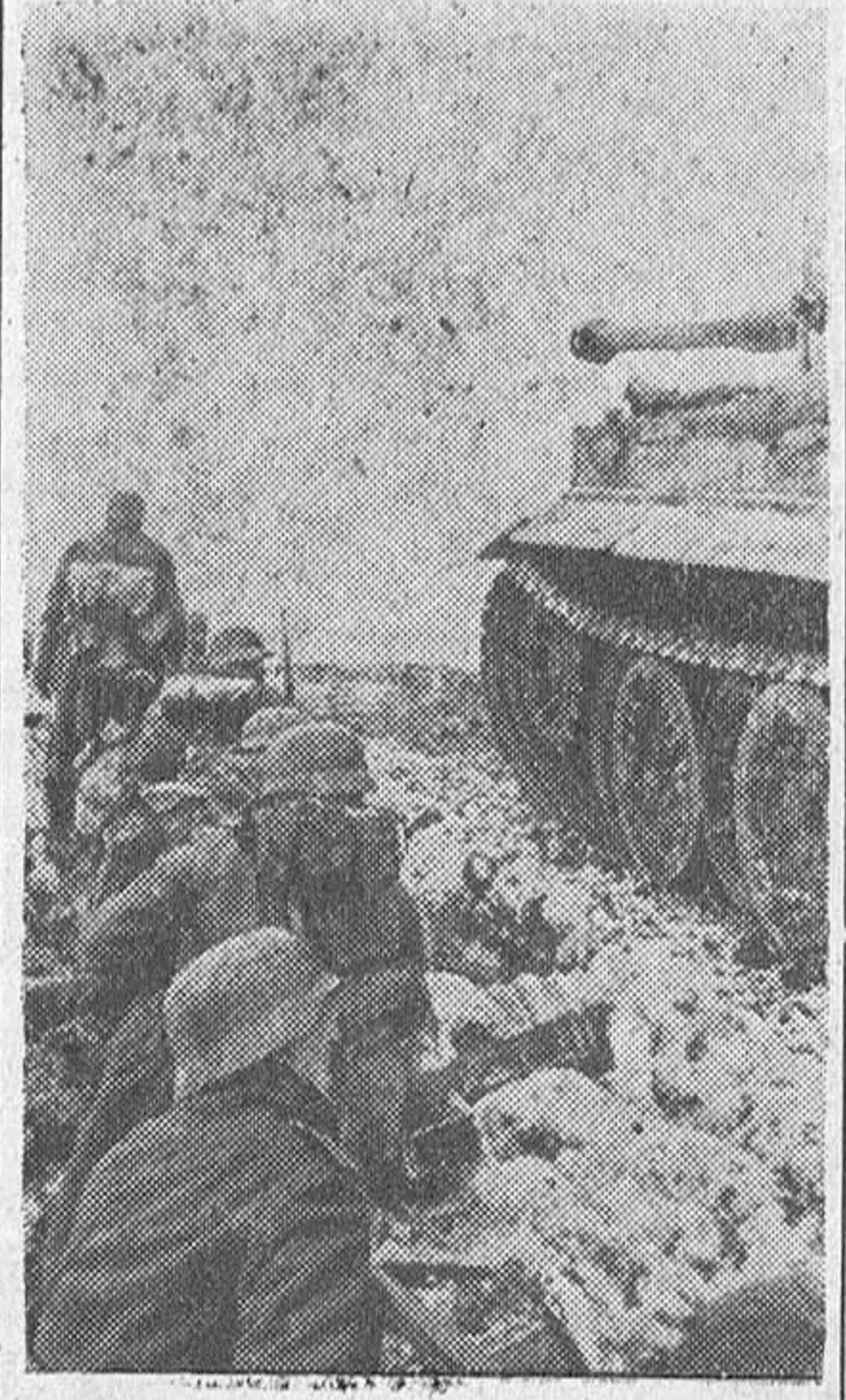
En un sector del frente del Este en que la artillería soviética hostiliza las líneas alemanas, los granaderos avanzan protegidos por tanques