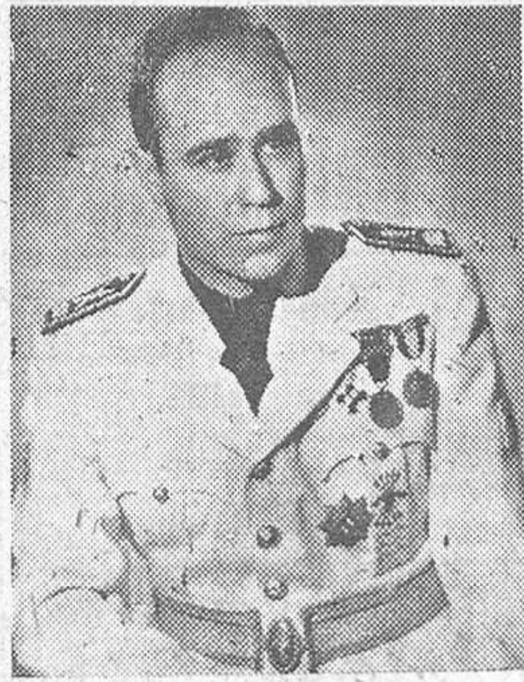
En la página 2.ª DIETARIO BELICO

MADRID, 28.—Siguen reuniéndose las comisiones de las Cortes, habiendo sido convocada la de Trabajo a cuyo dictamen se someterá el proyecto concediendo los beneficios de la ley del 23 de septiembre de 1939 a las viudas y huérfanos de militares. Dicha comisión se reunirá a las once de la mañana del 4 de mayo próximo. El mismo día celebrará sesión la Comisión de Defensa Nacional, que estudiará la reorganización del cuerpo de maquinistas de la Armada y la modificación del artículo 19 del Estatuto de Clases Pasivas. La reunión tendrá lugar a las 5,30 de la tarde. También ha sido convocada la comisión de Presupuestos para las 5 de la tarde del día 6, a fin de dictaminar varios proyectos que tiene pendientes de estudio.—Efe.