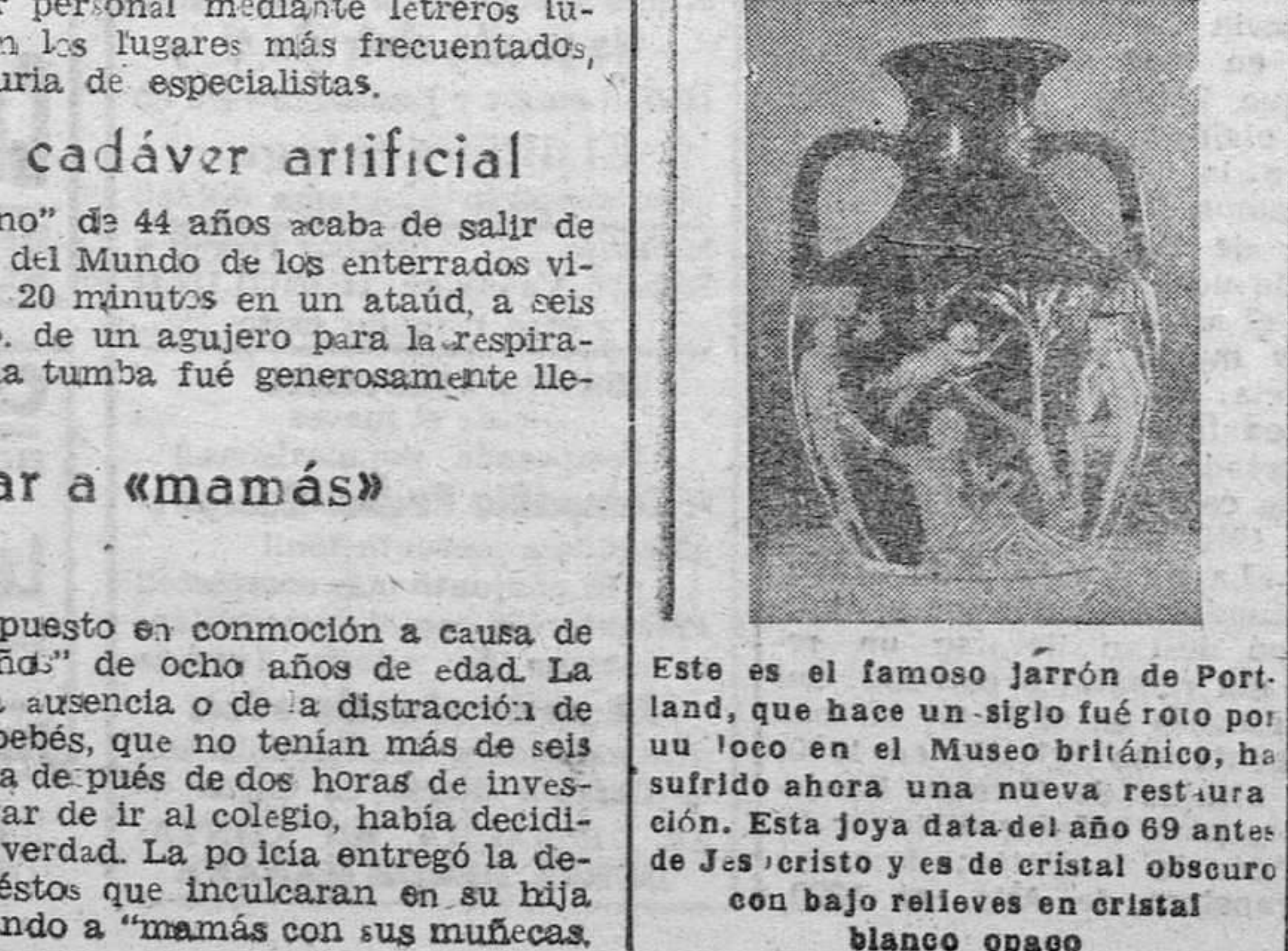
Este es el famoso jarrón de Portland, que hace un siglo fué roto por un loco en el Museo británico, ha sufrido ahora una nueva restauración. Esta joya data del año 89 antes de Jesucristo y es de cristal oscuro con bajo relieves en cristal blanco opaco