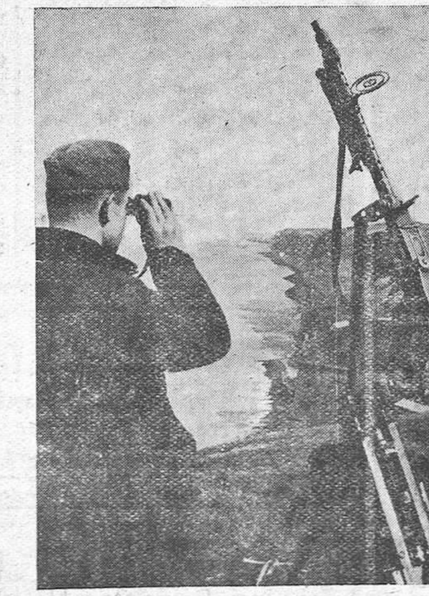
Puesto avanzado de vigilancia antiaérea en la costa francesa

Londres, 12.—El Ministerio inglés del Aire, comunica: «En la noche última los aparatos de bombardeo de las fuerzas aéreas inglesas, han atacado los puertos de invasión y cierto número de aeródromos. Faltan dos aparatos alemanes».—Efe.