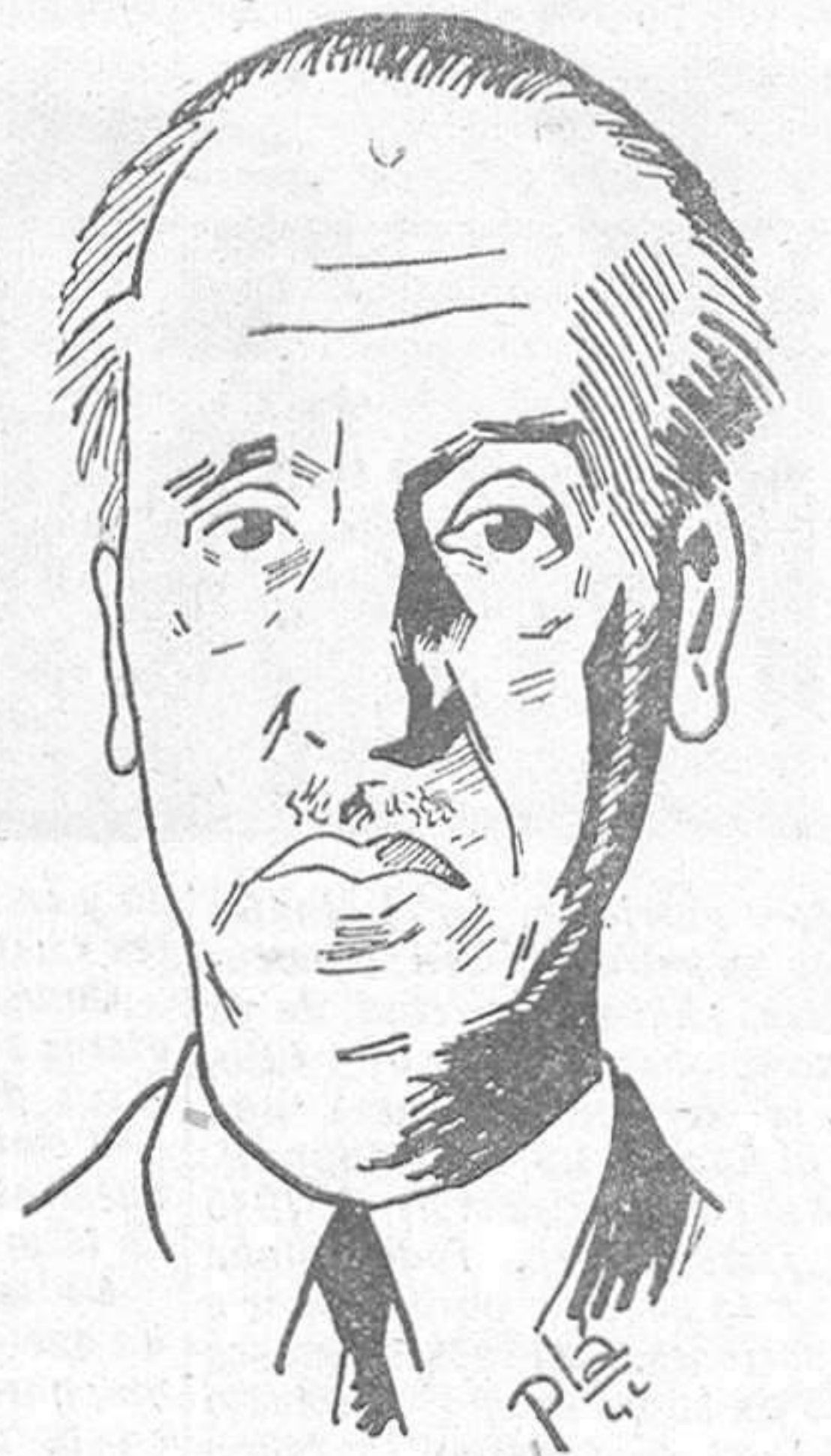
El ministro de Hacienda, señor Benjumea, que pronunció ante el pleno de las Cortes un interesante discurso que publicamos en la página 2.

En ningún caso podrán representar esas participaciones una carga excesiva para el inquilino. Respecto a las causas de resolución del contrato nada nuevo establece la ley manteniendo el estatuto sobre exención de pago de alquileres en beneficio del productor en paro. Habla de lo relativo al procedimiento y de la adicional de la que excluyen, de la ley los arriendos de locales, como industrias en funcionamiento sin más excepción que la referida a las de la clase de espectáculos donde el criterio es el mismo que el vigente en la actualidad. Termina diciendo que al razonar las medidas que autorizan al Gobierno a imponer,