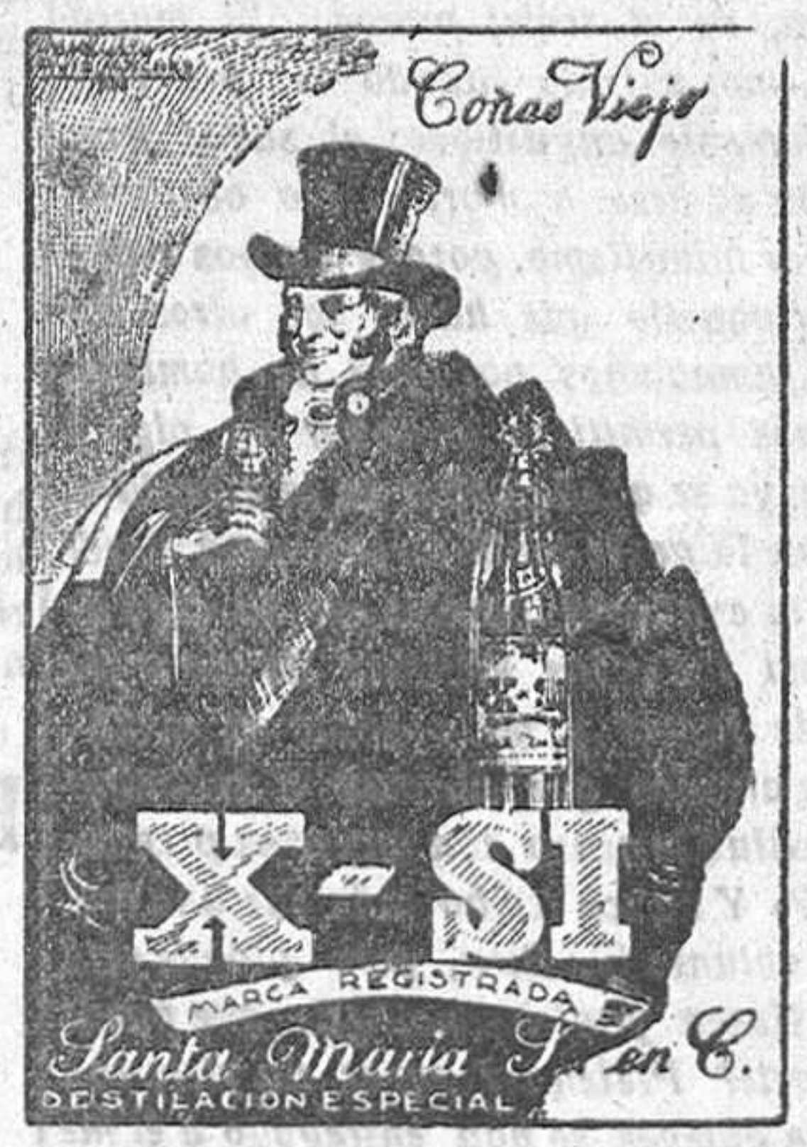
Coras Viejas. Santa María S. en C. REGISTRO ESPECIAL