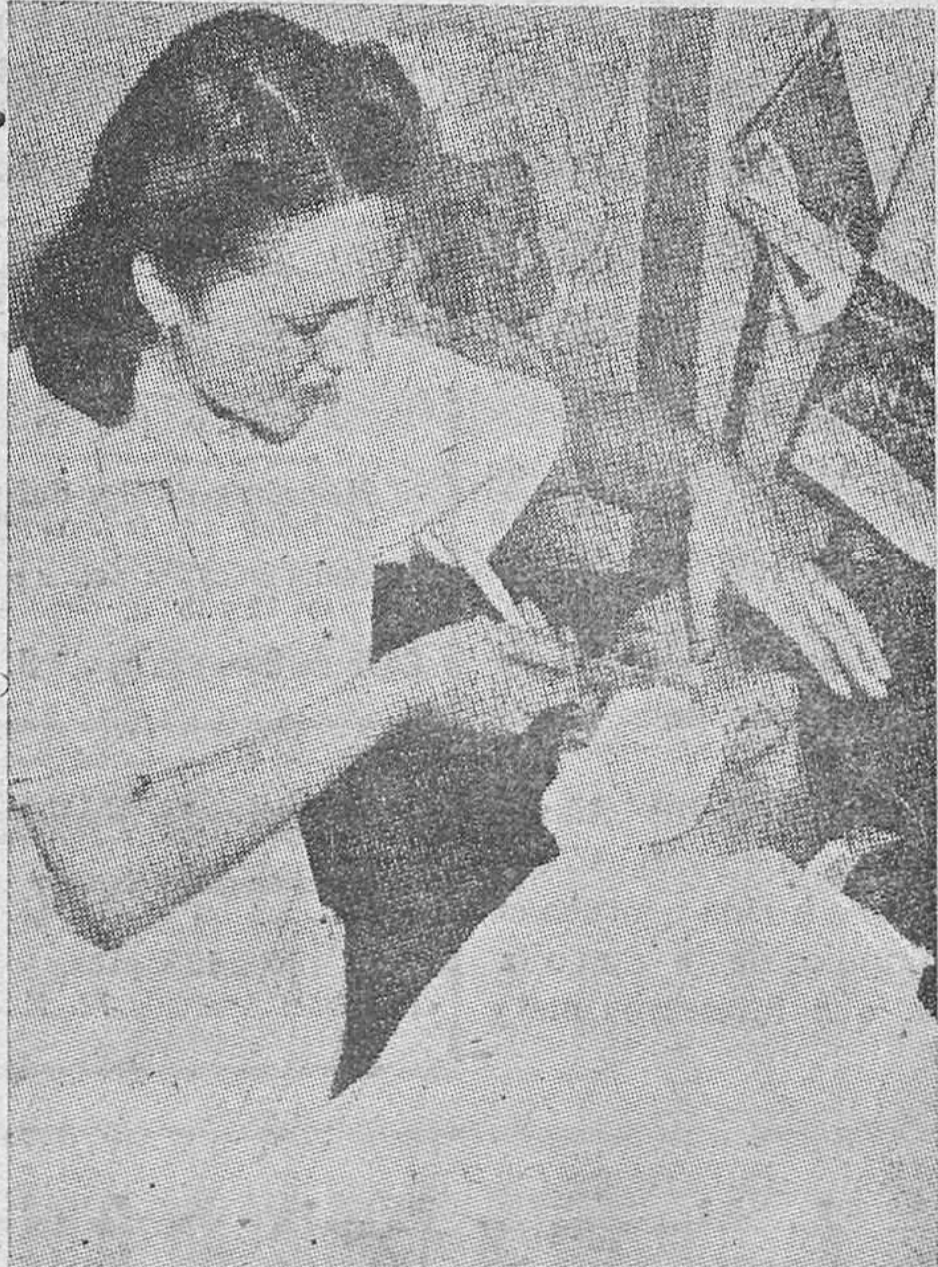
Las mujeres de las naciones beligerantes acuden a sustituir en el trabajo a los hombres movilizados

Hasta ahora se sabe que el número de muertos es de dieciocho, pero se cree que haya más bajo los escombros. Las comunicaciones con dicha región están interrumpidas.—R. N.