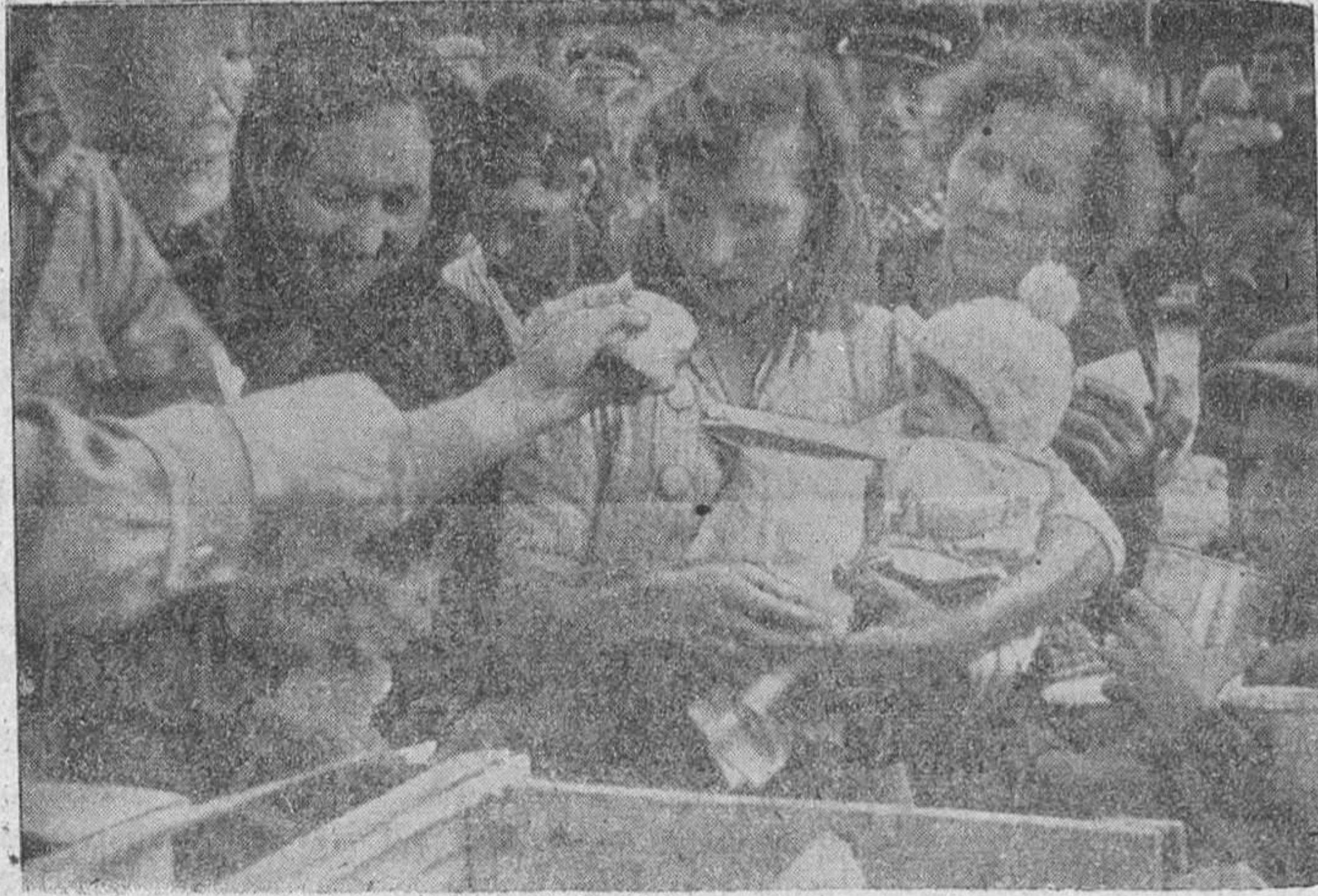
ESTA ESCENA DEL NOTICARIO SEMANAL DE LA CASA ALEMANA TOBIS, RECOGE LOS MOMENTOS DE UN REPARTO DE VIVERES, A LA ENTRADA DE LAS TROPAS DEL REICH, EN UNA CIUDAD RECIEN CONQUISTADA