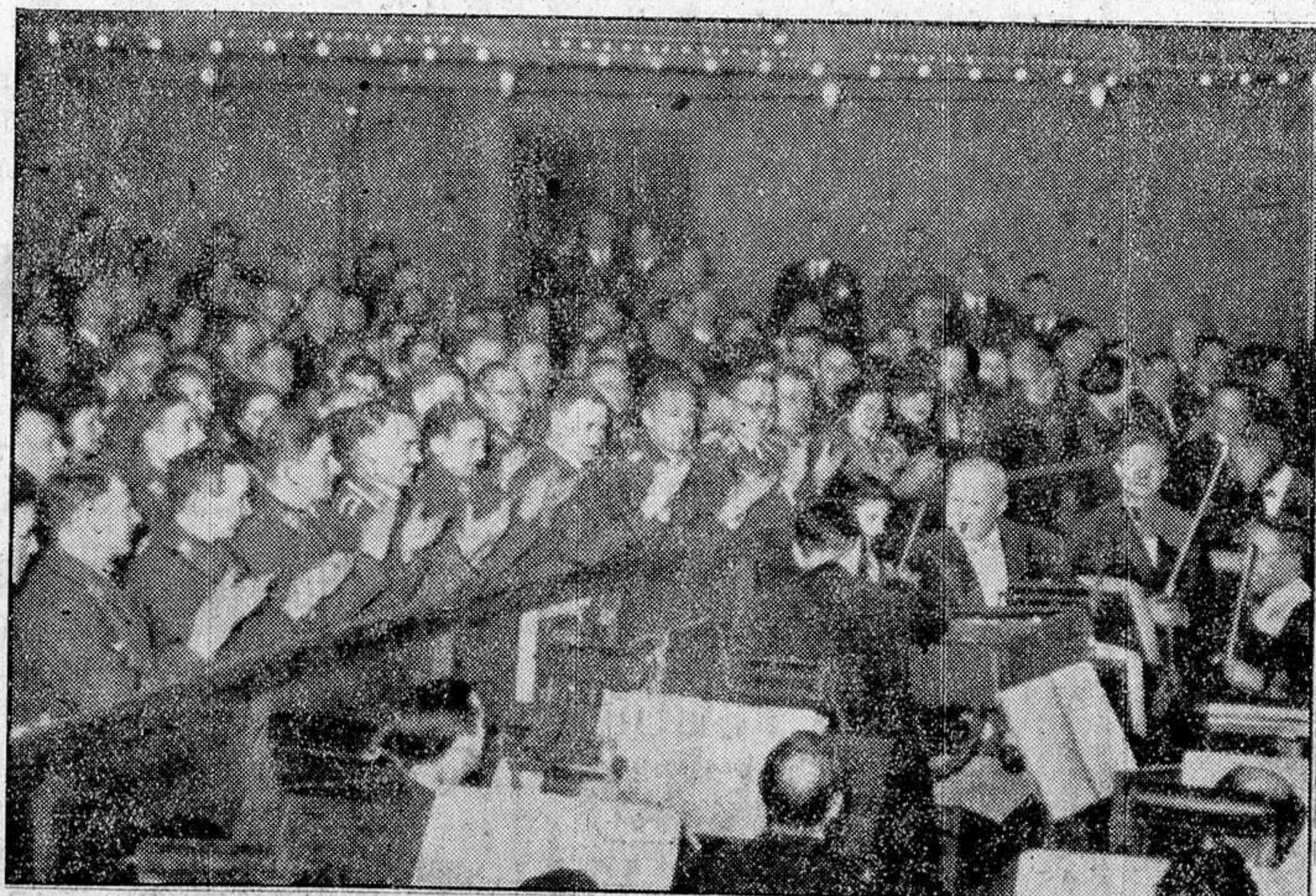
Lehar, el célebre compositor de operetas vienés, dirigió en París una representación de su opereta «El país de la sonrisa», dedicada a los soldados alemanes.

Según parece, los ataques están apoyados por aviones entregados por Gran Bretaña a la Indochina.—Efe.