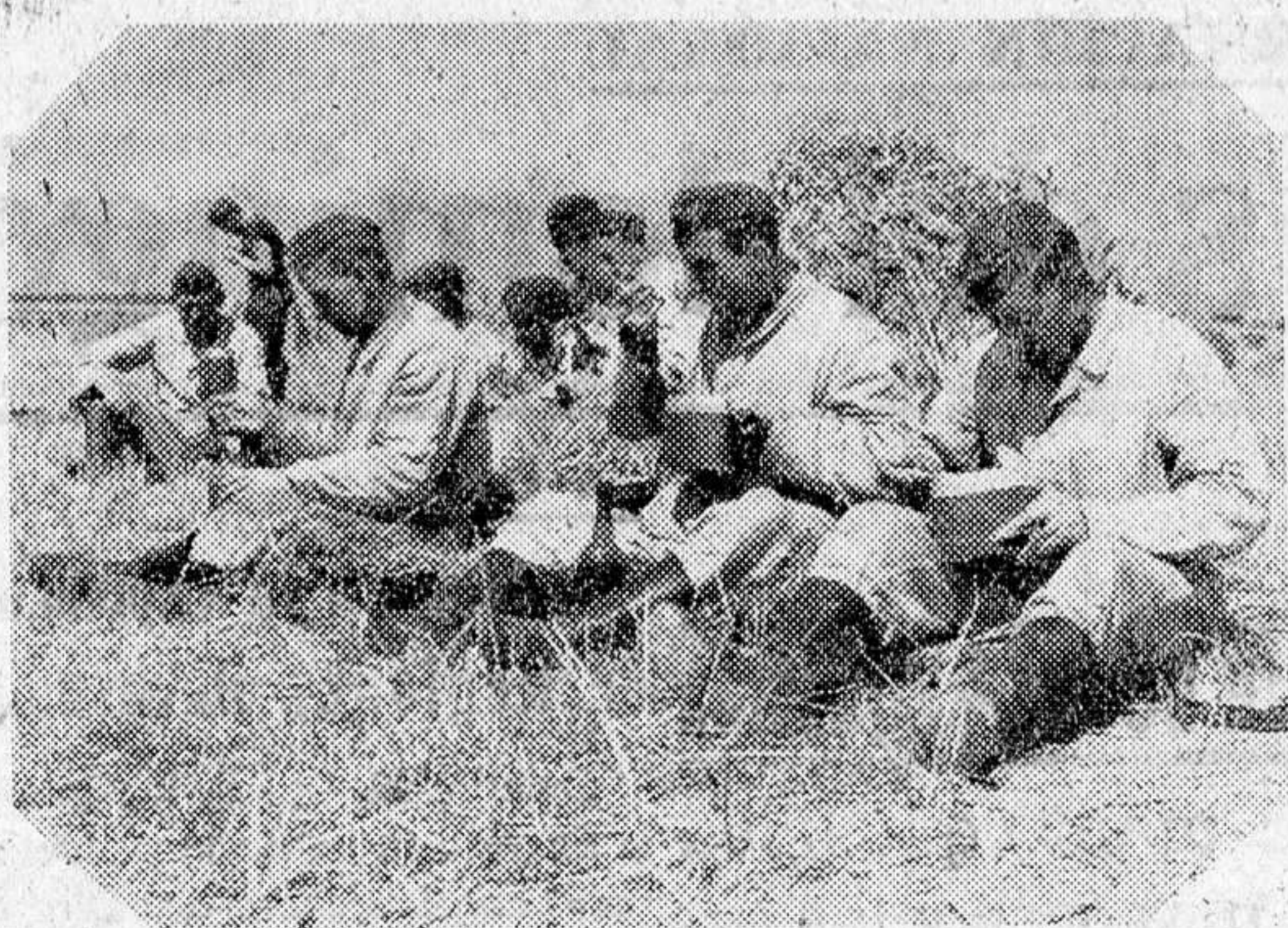
Hora del rancho en un campamento de Zapadores en Francia

Desde luego no es de extrañar esta actividad inglesa, si se tiene en cuenta que, incluso los sacerdotes de la Iglesia anglicana, invitan a la extirpación despiadada del pueblo alemán y a la destrucción completa de las ciudades del Reich.