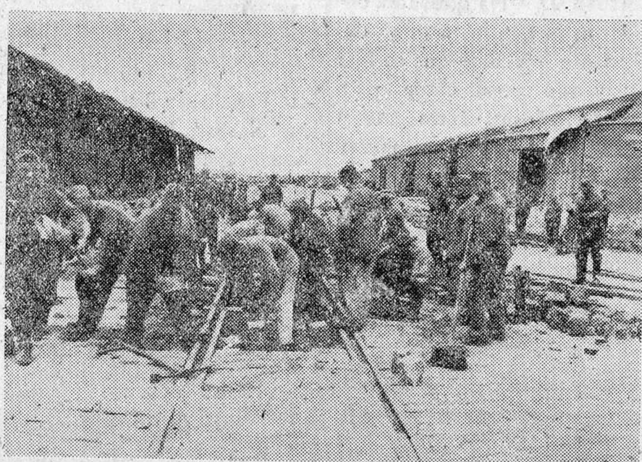
Gastadores alemanes reparando las vías ferroviarias de la costa de Flandes.