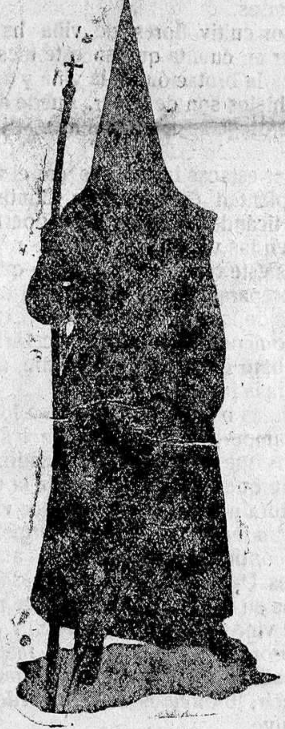
Hermano de la Vera Cruz

ordinariamente la atención, y la imagen del Jesús Nazareno, maravillosa talla, ricamente ornamentada, de autor desconocido. Después que termina la procesión las calles de Zamora, que se hallan invadidas de forasteros e iluminadas profusamente, presentan el aspecto de una gran ciudad.