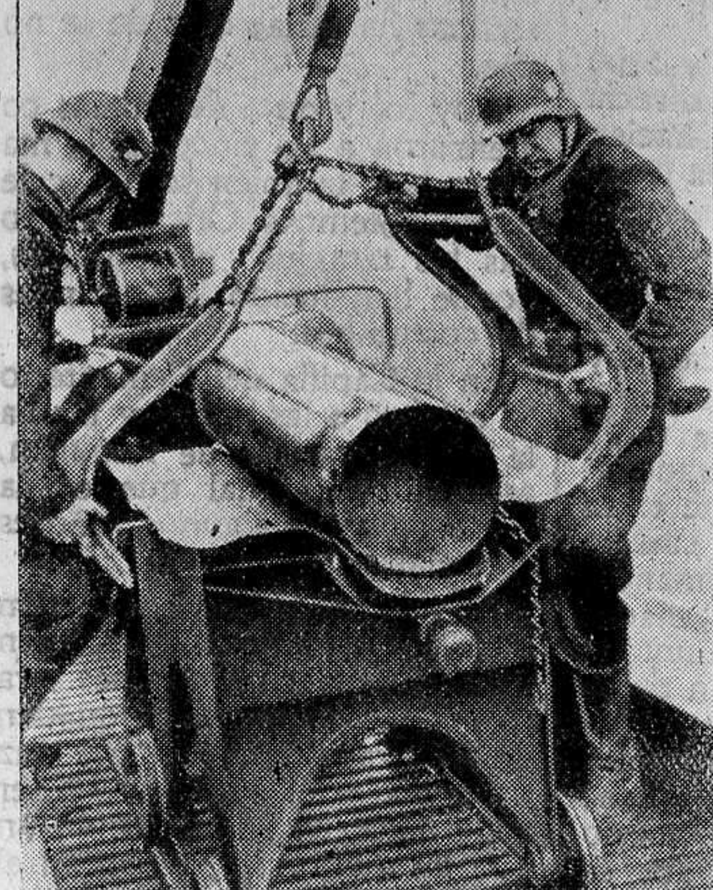
Artillería pesada alemana en la costa del Canal. Los obuses se transportan al cañón con ayuda de una grúa.

Roosevelt quiere llegar a esta cifra Washington.—El presidente Roosevelt ha declarado a los periodistas que el Gobierno federal inaugurará probablemente un nuevo programa de fabricación de aviones, tan pronto como se reúna el Congreso después de las elecciones del día 5. Añadió que este programa impondrá un aumento de rendimiento en todas las fábricas norteamericanas, a fin de que pueda lograr los 50.000 aviones anuales que habló en uno de sus últimos discursos.—Efe.