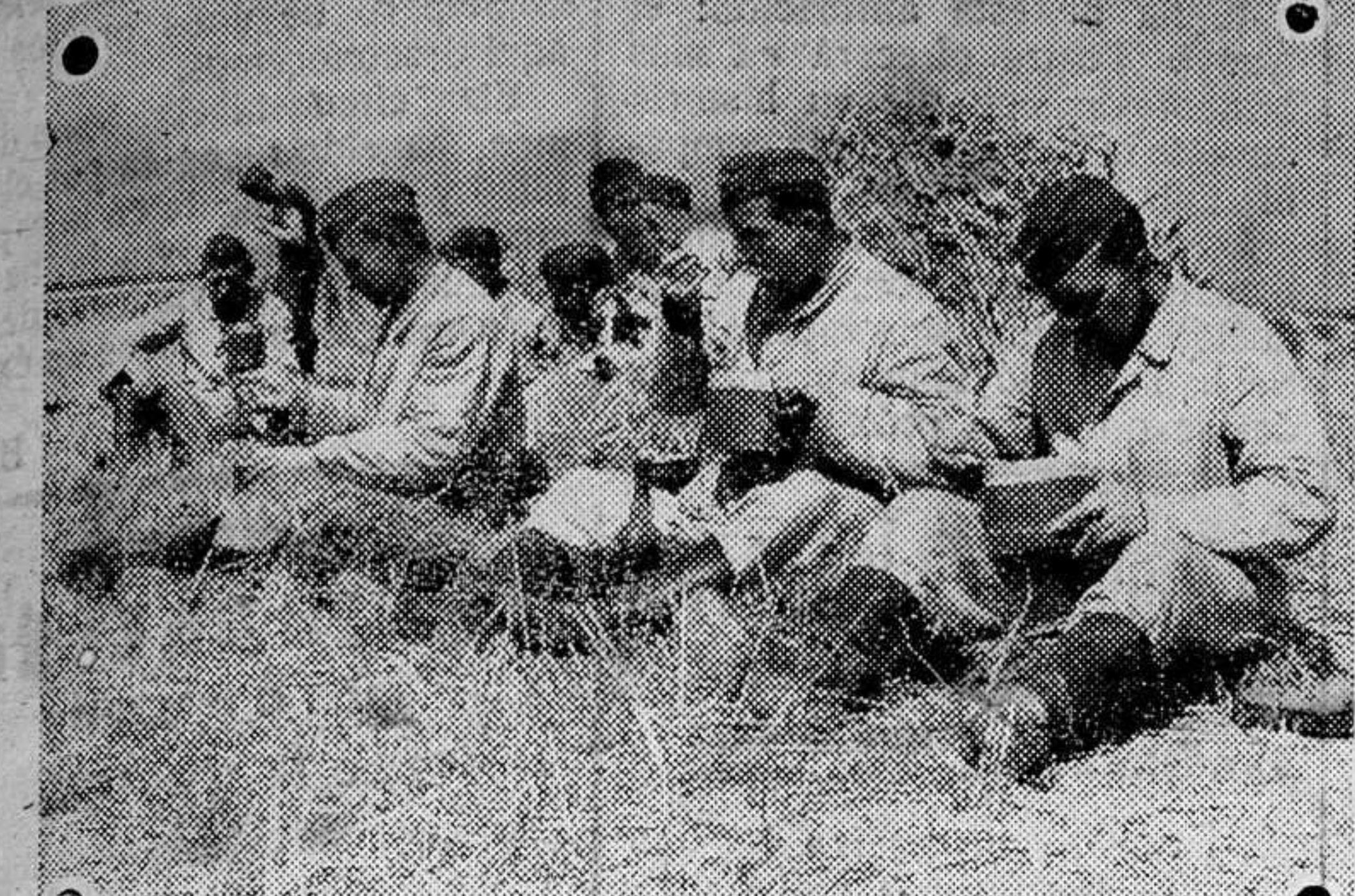
Hora del rancho en un campamento de zapadores en Francia