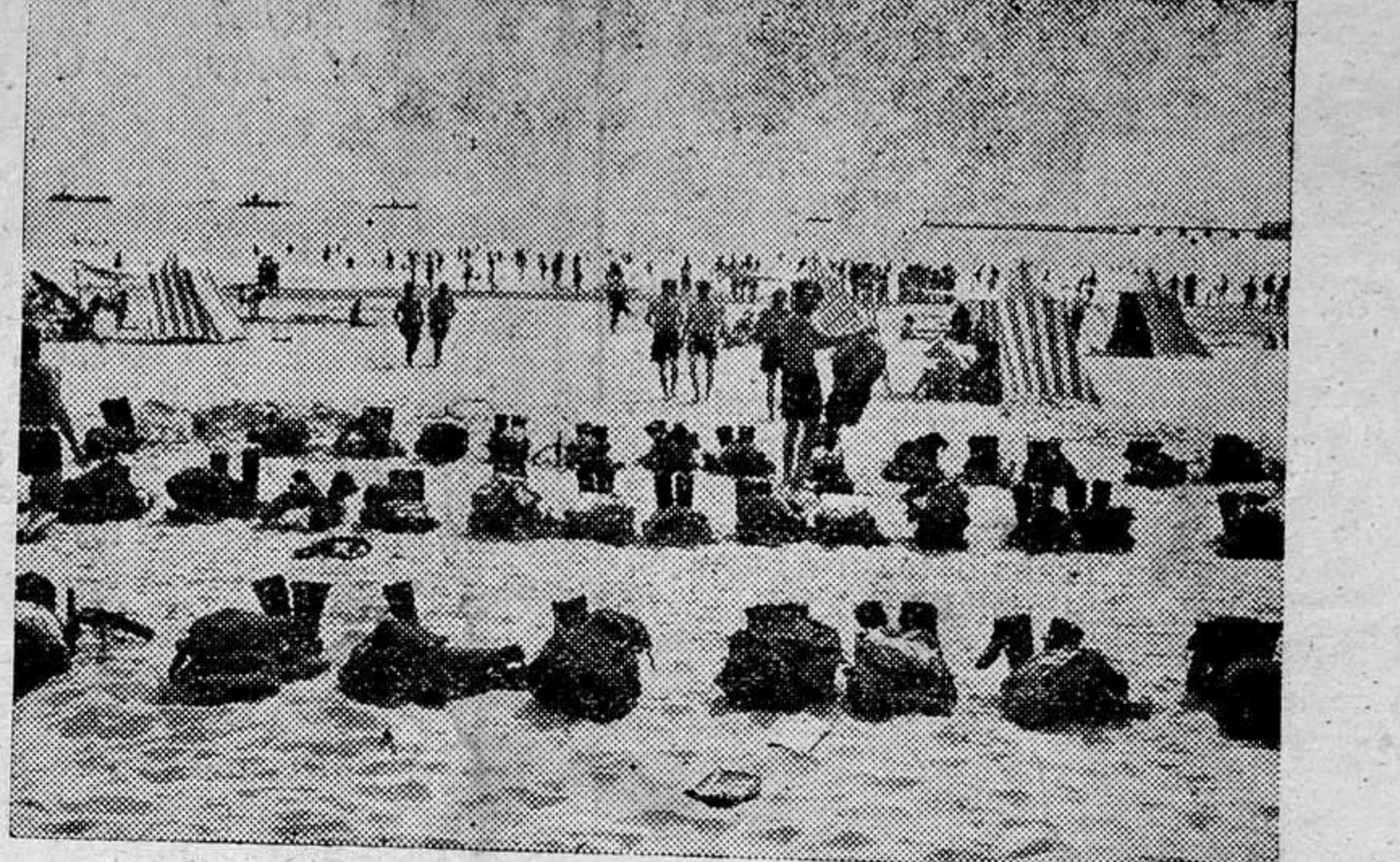
Después de las grandes campañas en Occidente, las fuerzas alemanas se dedican a un descanso bien merecido a la par que se entrenan para la batalla final

BUDAPEST.—El Estado Mayor del Ejército húngaro comunica que durante treinta días queda prohibido terminantemente el acceso al territorio de Transilvania, recuperado recientemente por Hungría.—EFE.