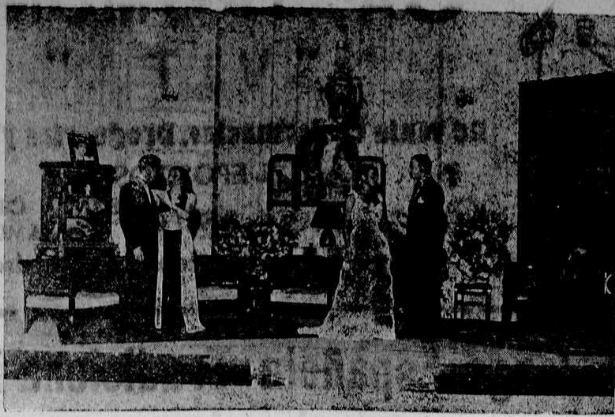
Una escena de la comedia «La Madre Guapa» que se estrenará el próximo lunes en el Teatro Principal