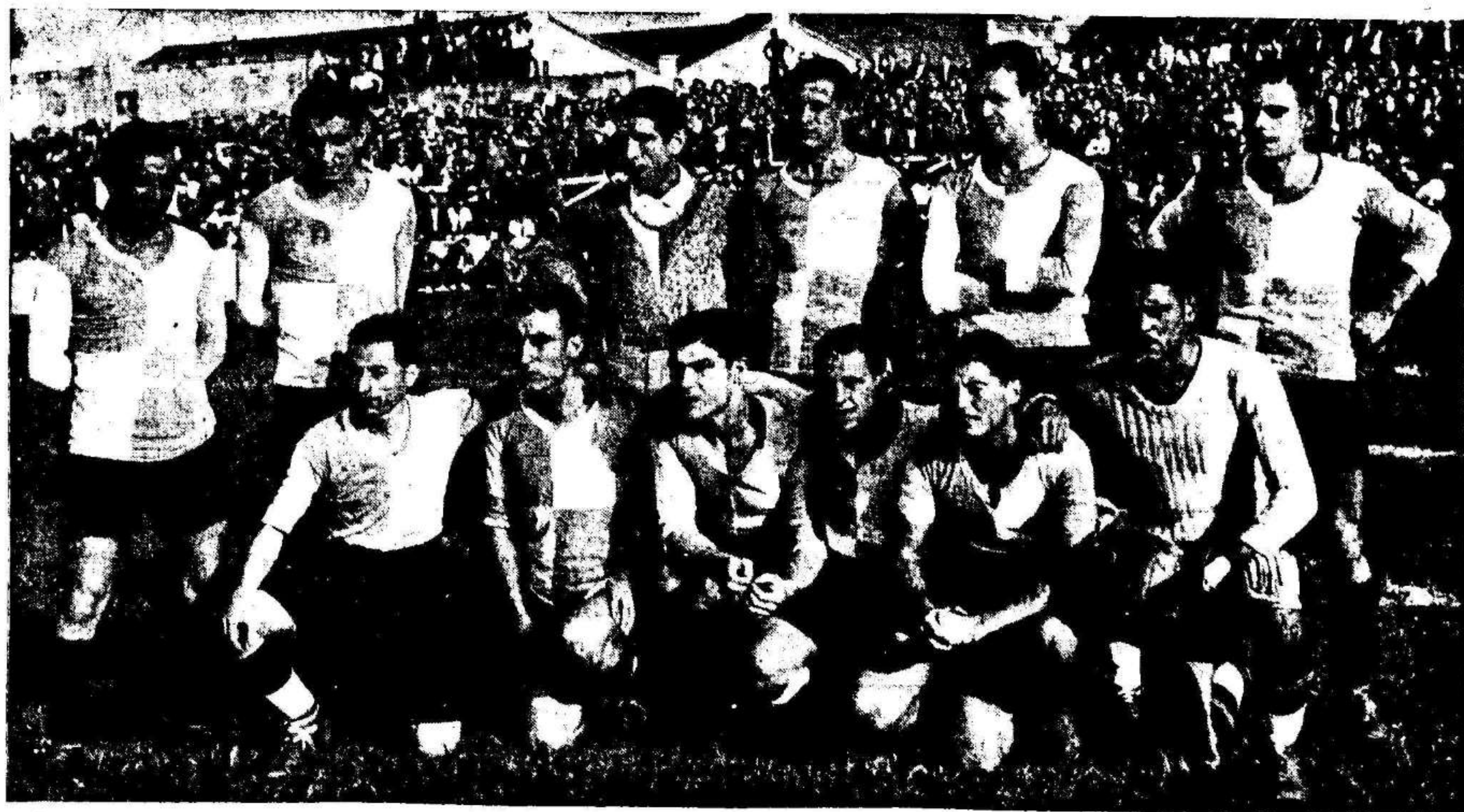
Equipo del Centre Sports de Sabadell, clasificado semifinalista al eliminar al Betis sevillano, campeón de la Primera División de Liga.