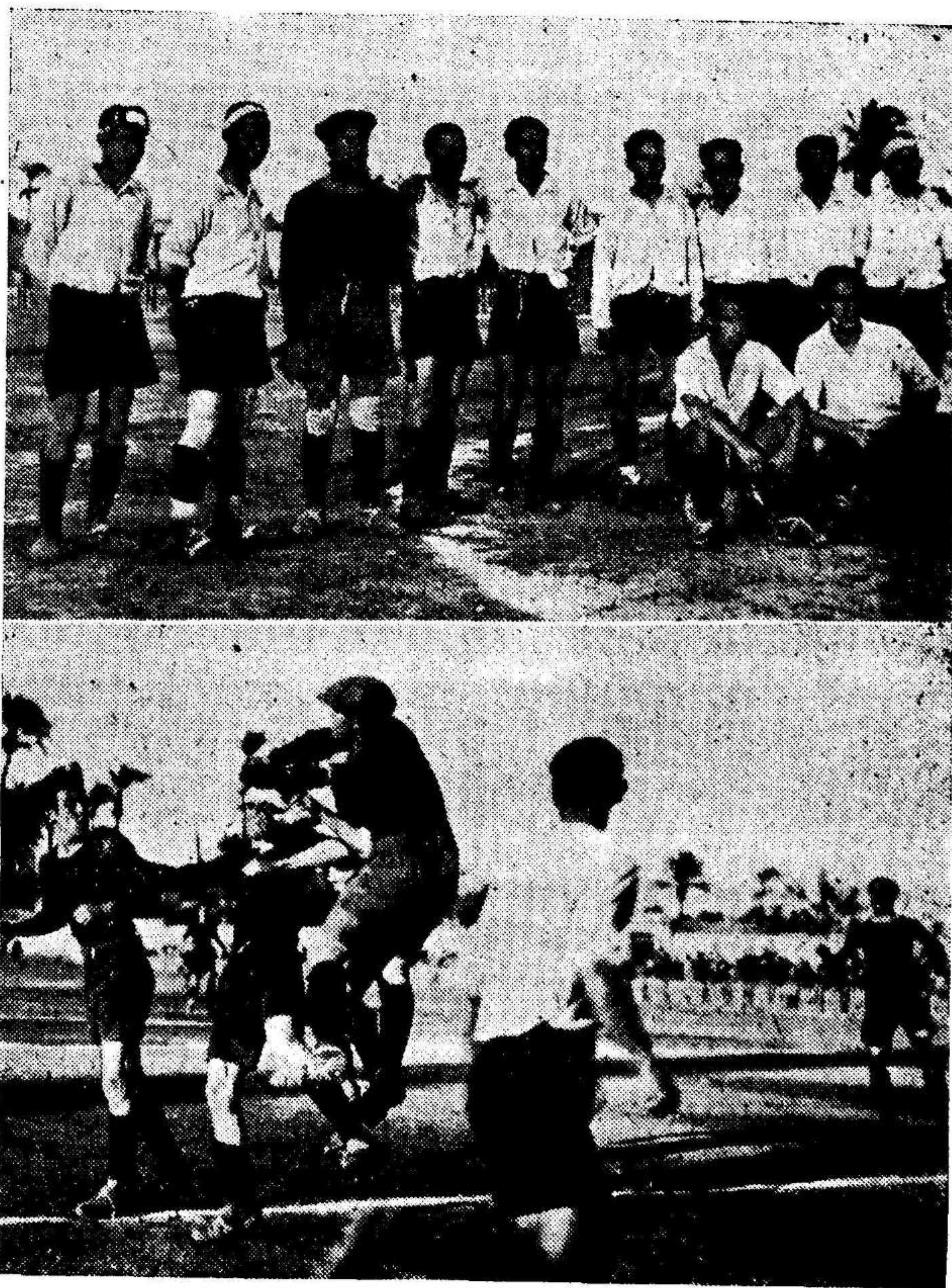
Equipo de Alicante F. C.—Una situación comprometida para el marco alicantino que resuelve el portero.