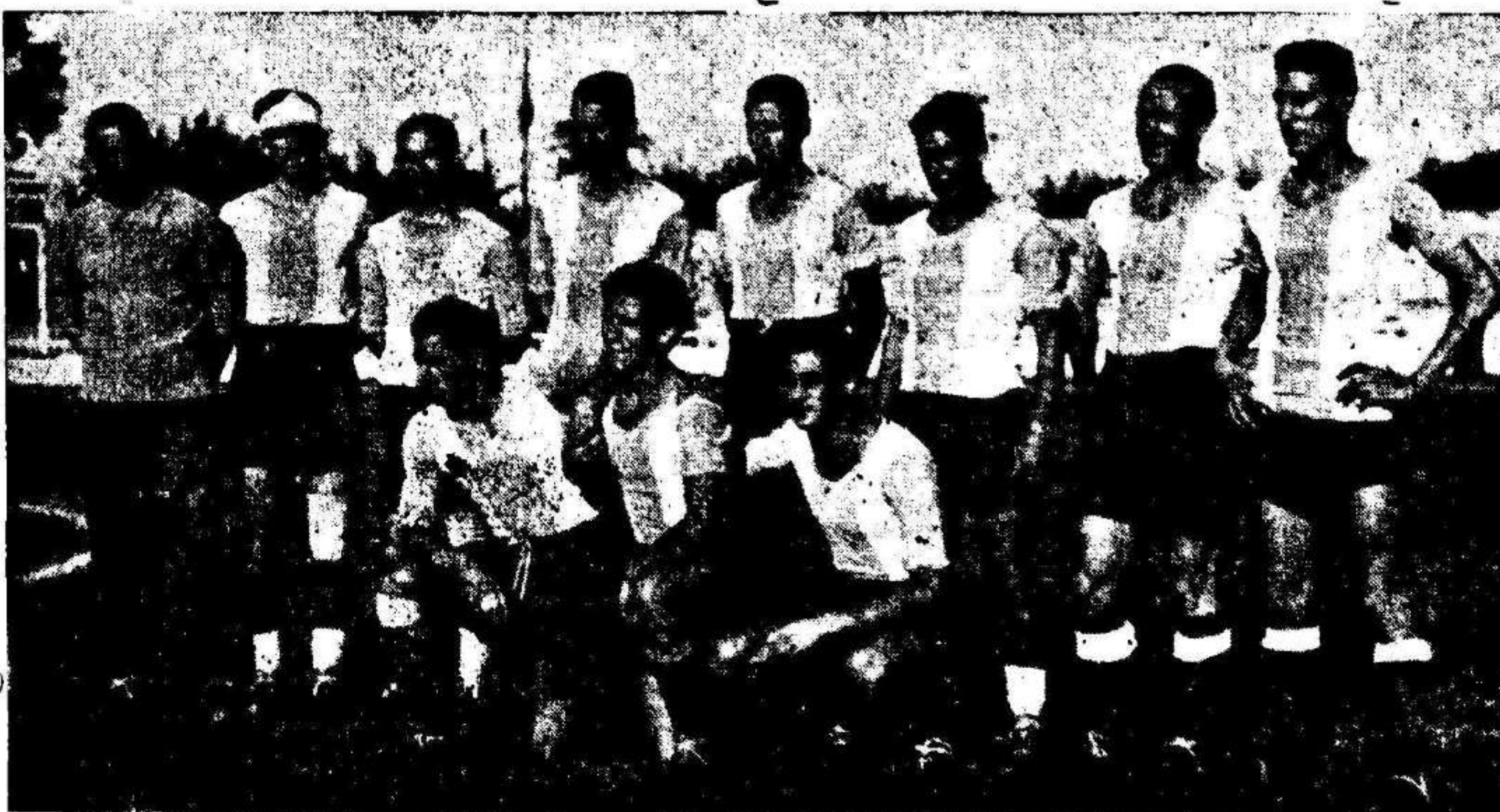
Equipo del Levante, de Valencia, que fué vencido por el Murcia.

(Continúan los partidos de este grupo en la página doce).