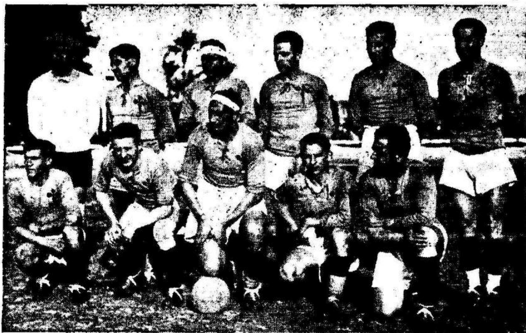
Equipo del Club Celta, de Vigo, que actuó ayer, en la Condomina, y que fué vencido, por el Murcia, por 3 goals a 1.