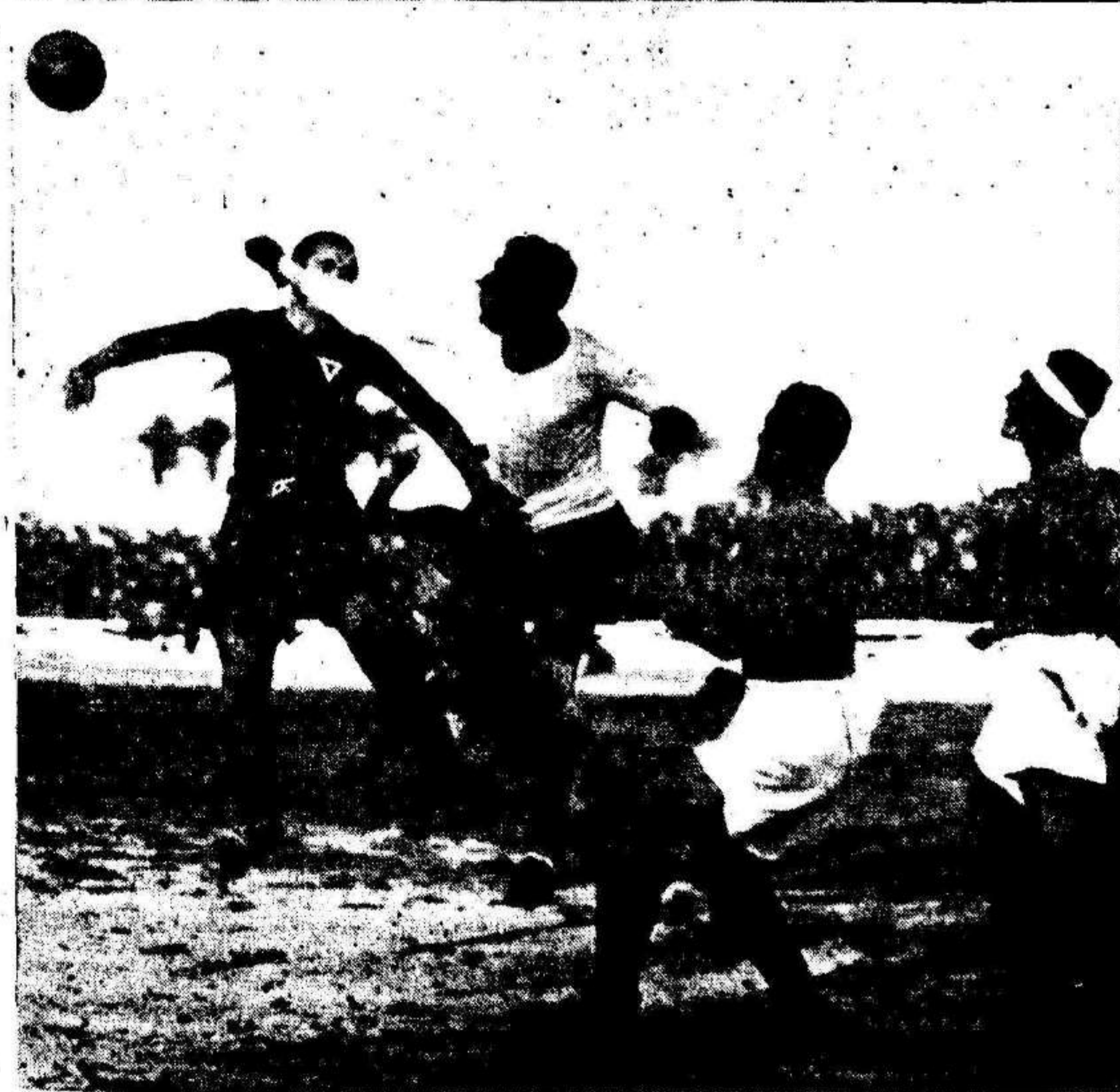
Dos acertadas intervenciones de Lilo, el guardameta gallego, en el partido jugado ayer en la Condomina.