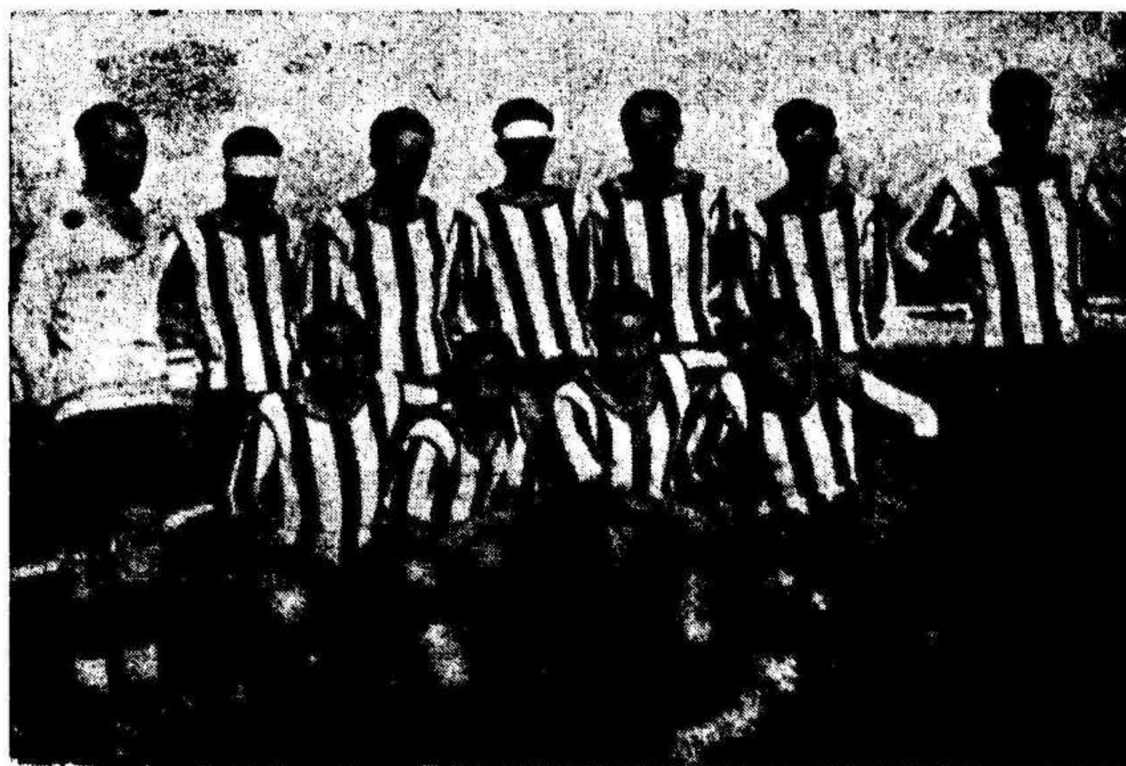
Arriba: Sión y Herrera las dos figuras más destacadas en el equipo asturiano.