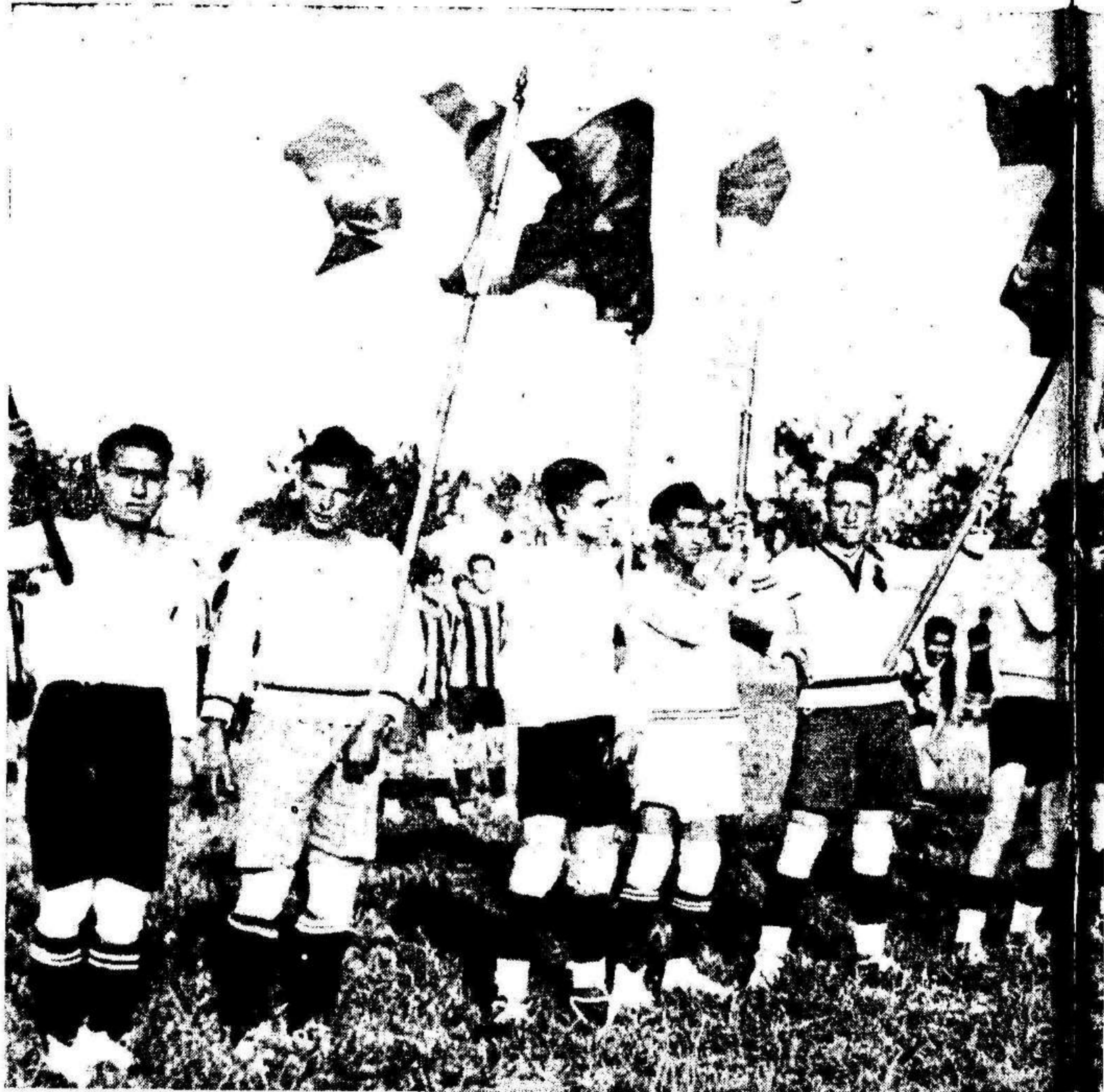
Las banderas de los equipos participantes en el torneo, en el festival celebrado en la Coma

Con la celebración del partido Rácing del Barrio-Nacional de Espinardo, dió fin el domingo