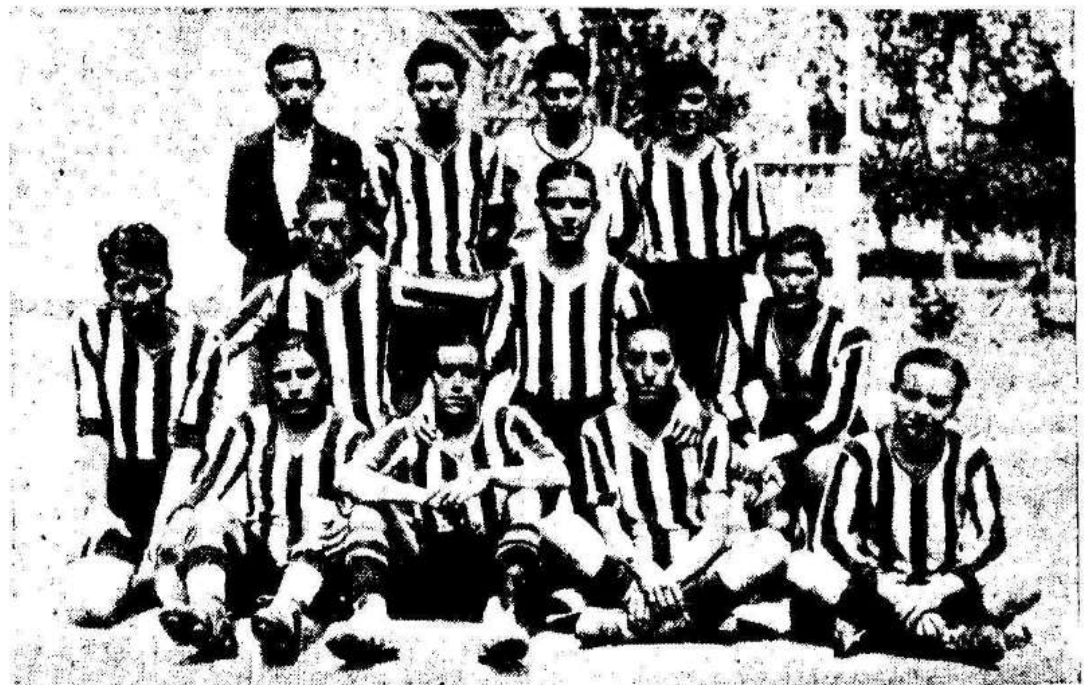
El equipo del Racing del Barrio, que jugó ayer la final con el Nacional de Espinardo —(Foto Arenas).