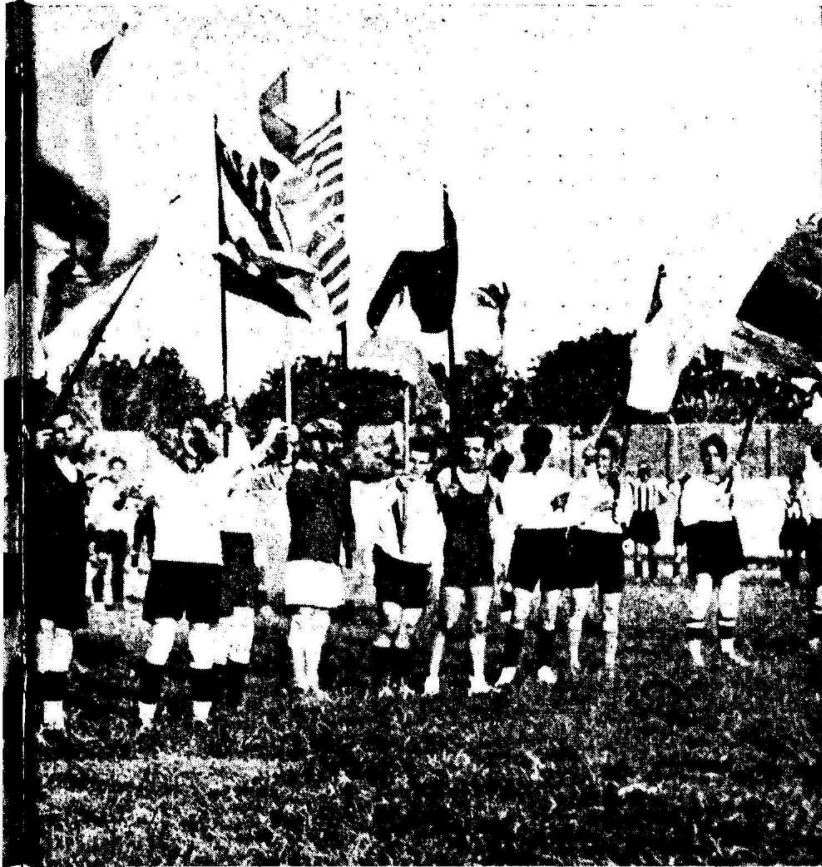
domina, en el que tomaron parte los 24 equipos que han jugado la competición

El torneo «Copa Murcia», ha constituido el acontecimiento de-