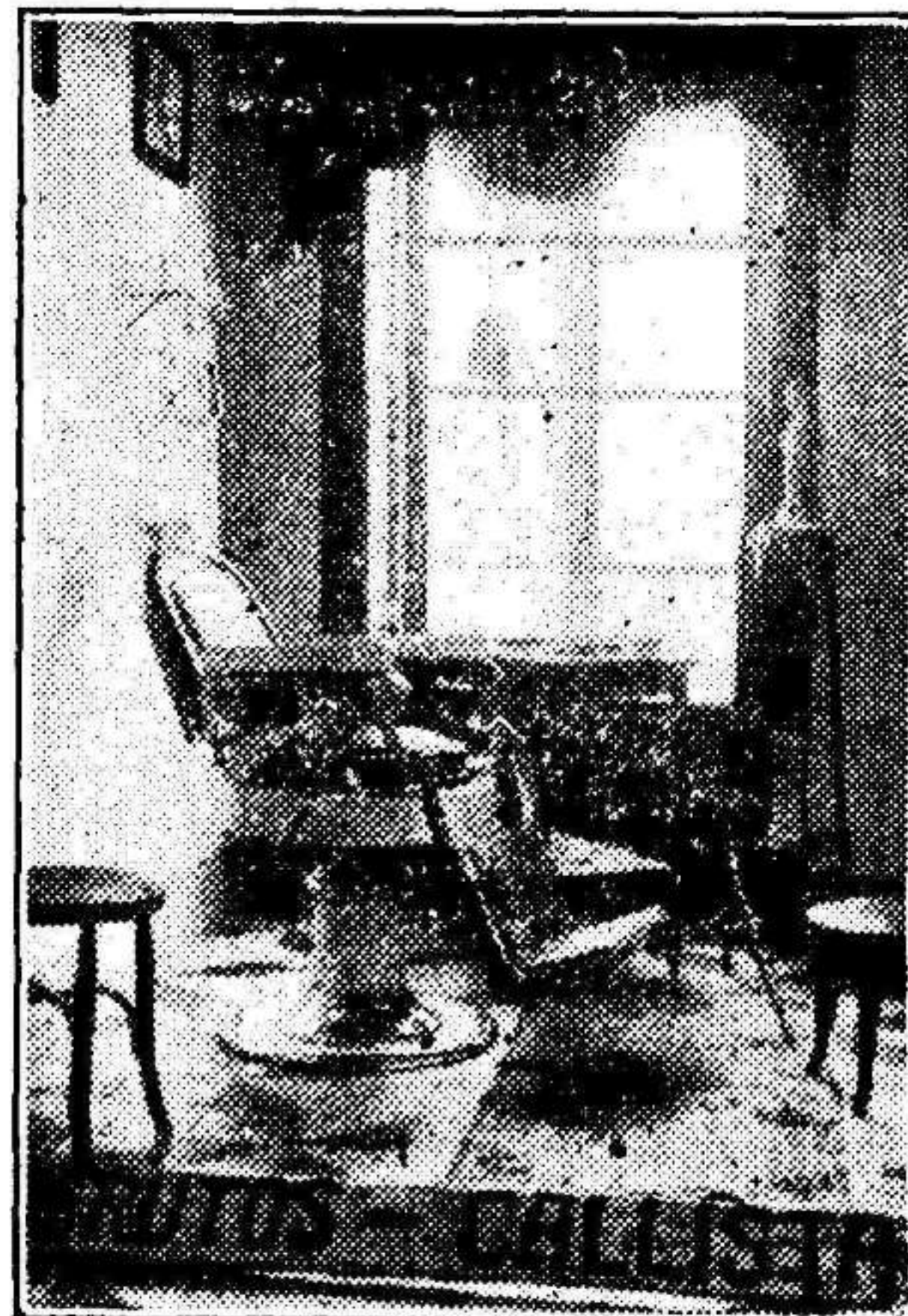
Santa Isabel, 5.—Murcia

En el campo de La Florida se celebró el partido de competición de la tercera Liga correspondiente a estos dos Clubs.