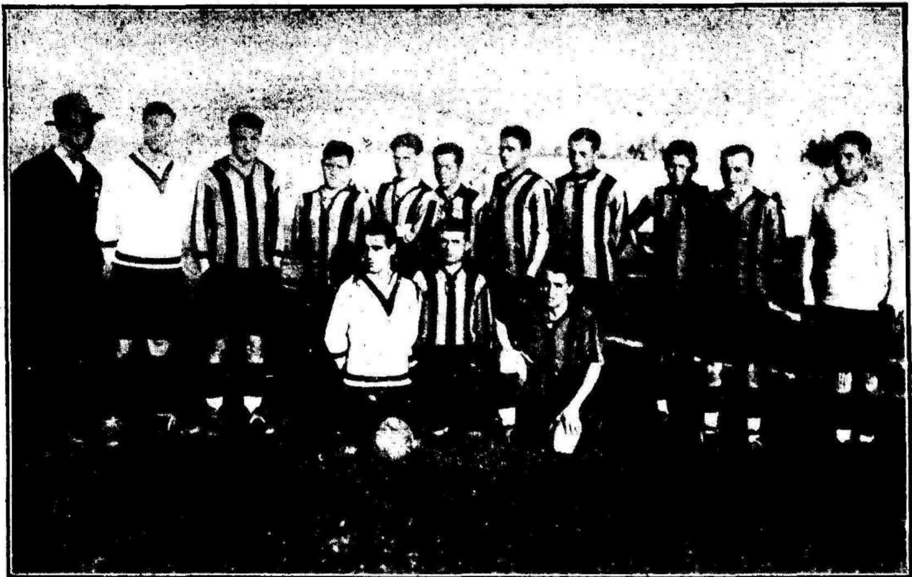
El campeón de Aragón Iberia S. C. que ha jugado en Murcia dos interesantes partidos, venciendo en el primero y empatando en el segundo jugado ayer