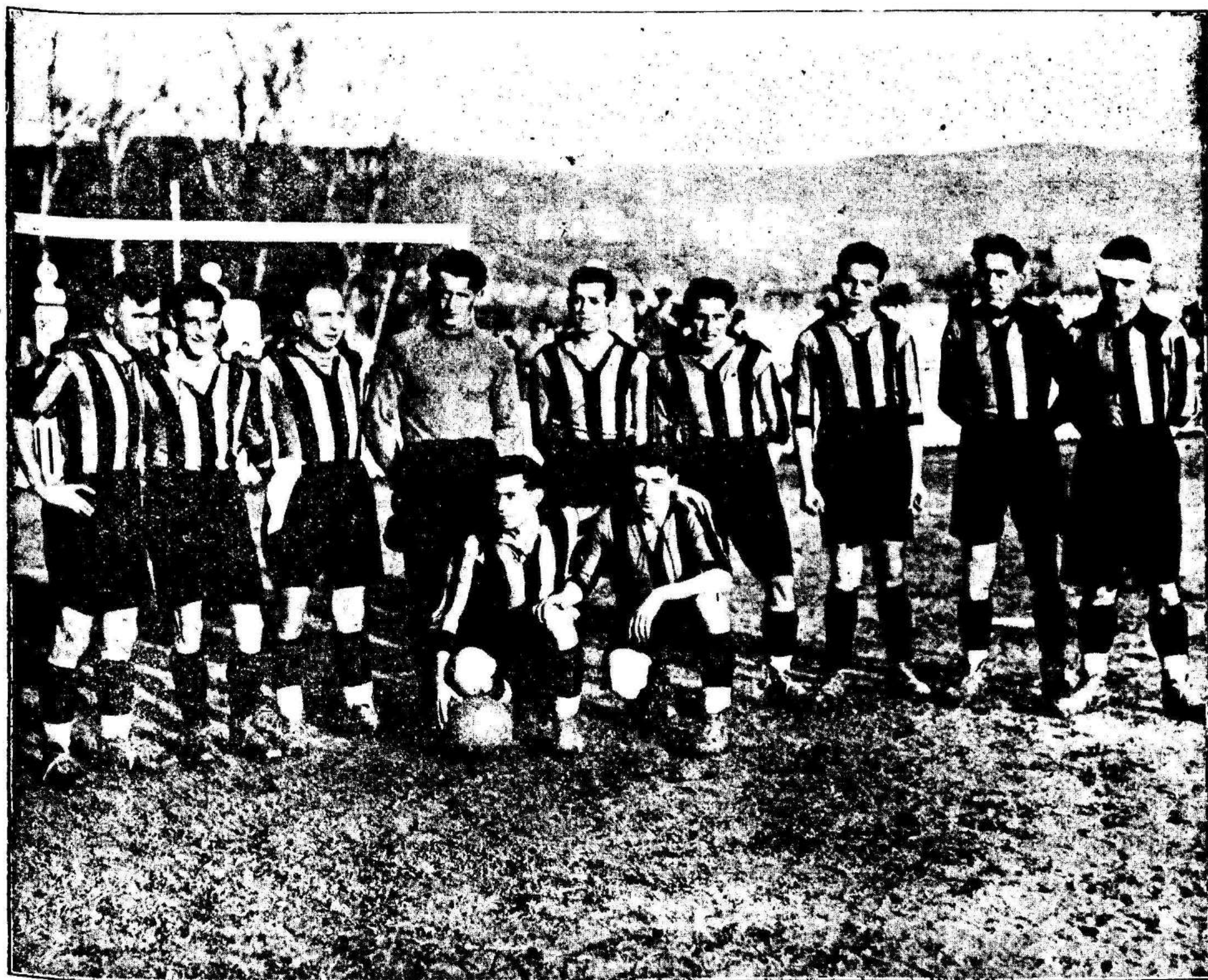
El notable equipo vizcaino que empató a dos goal con el Real Murcia el pasado sábado, en la Condomina